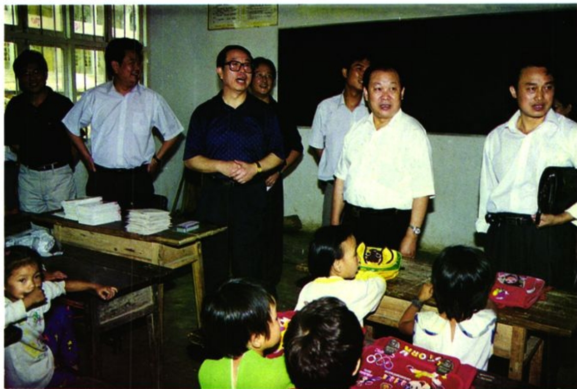
重庆市人大常委会主任王云龙在人大主任杨家常和县长张泽洲的陪同下视察龙池小学（图一）