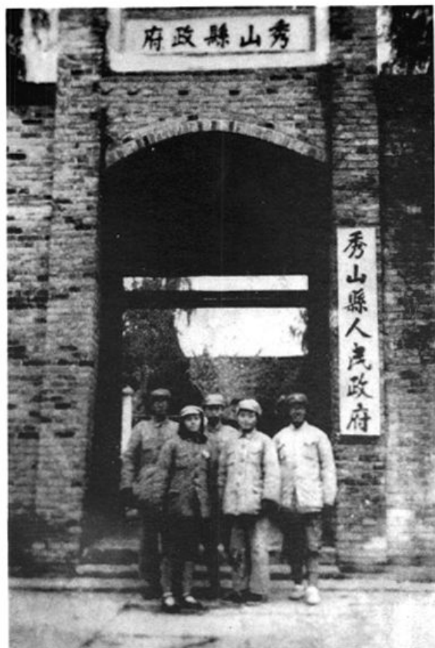
1949年11月21日，西南地区诞生的第一个新政权——秀山县人民政府，挂牌后第一届县政府主要领导人合影