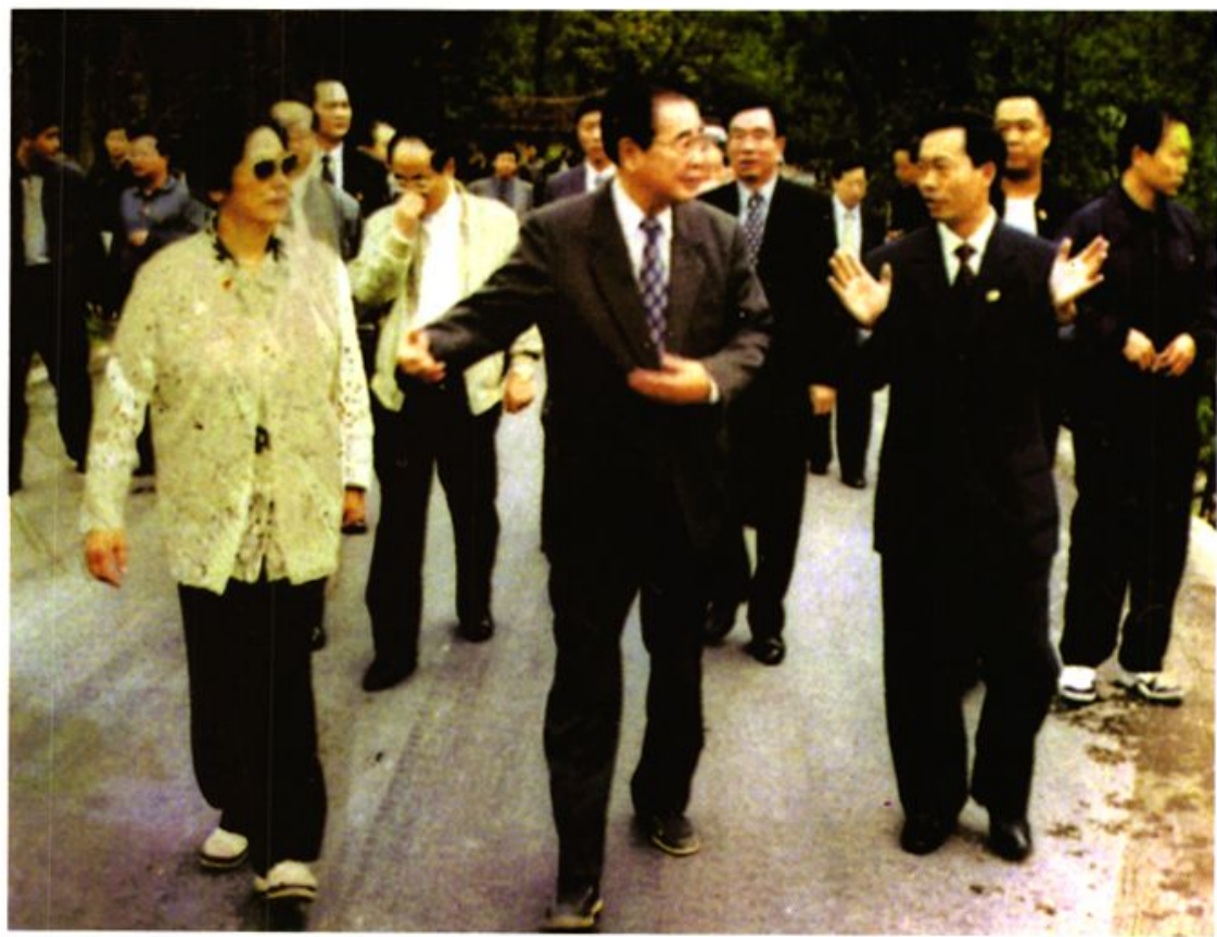
李鹏委员长及夫人朱琳在县委书记向涛的陪同下视察妙泉旅游开发