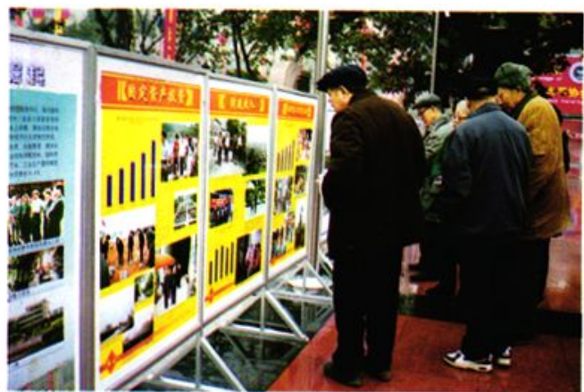
一在市一届人大六次会议期间,主城区市民驻足观看秀山宣传展板