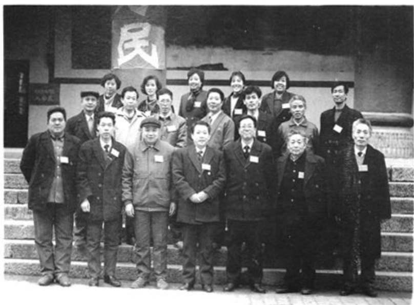
第十二届县人大常委会组成人员合影