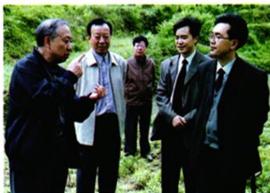
↑市人大常委会副主任康刚有(左1)在秀山视察退耕还林工程