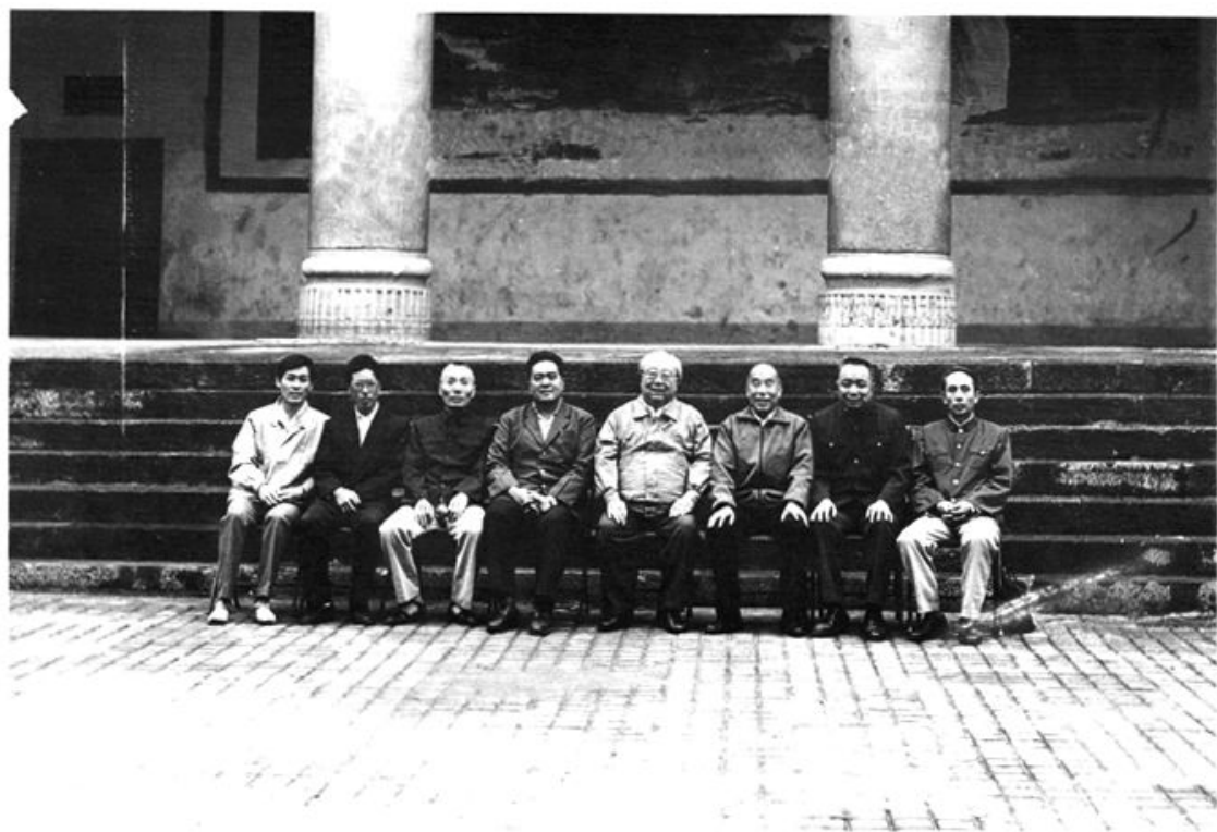
全国人大常委会副委员长费孝通（左5）在四川省人大常委会主任刘海泉（左6）陪同下，在秀山调研期间与市人大常委会主要领导合影