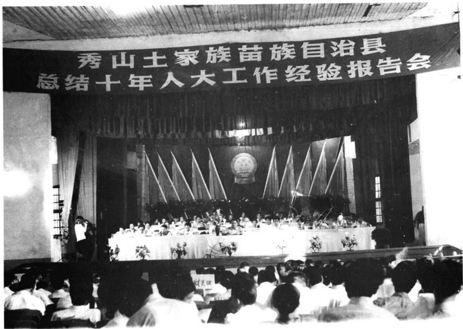
1990年7月，县召开总结十年人大工作经验报告会会场