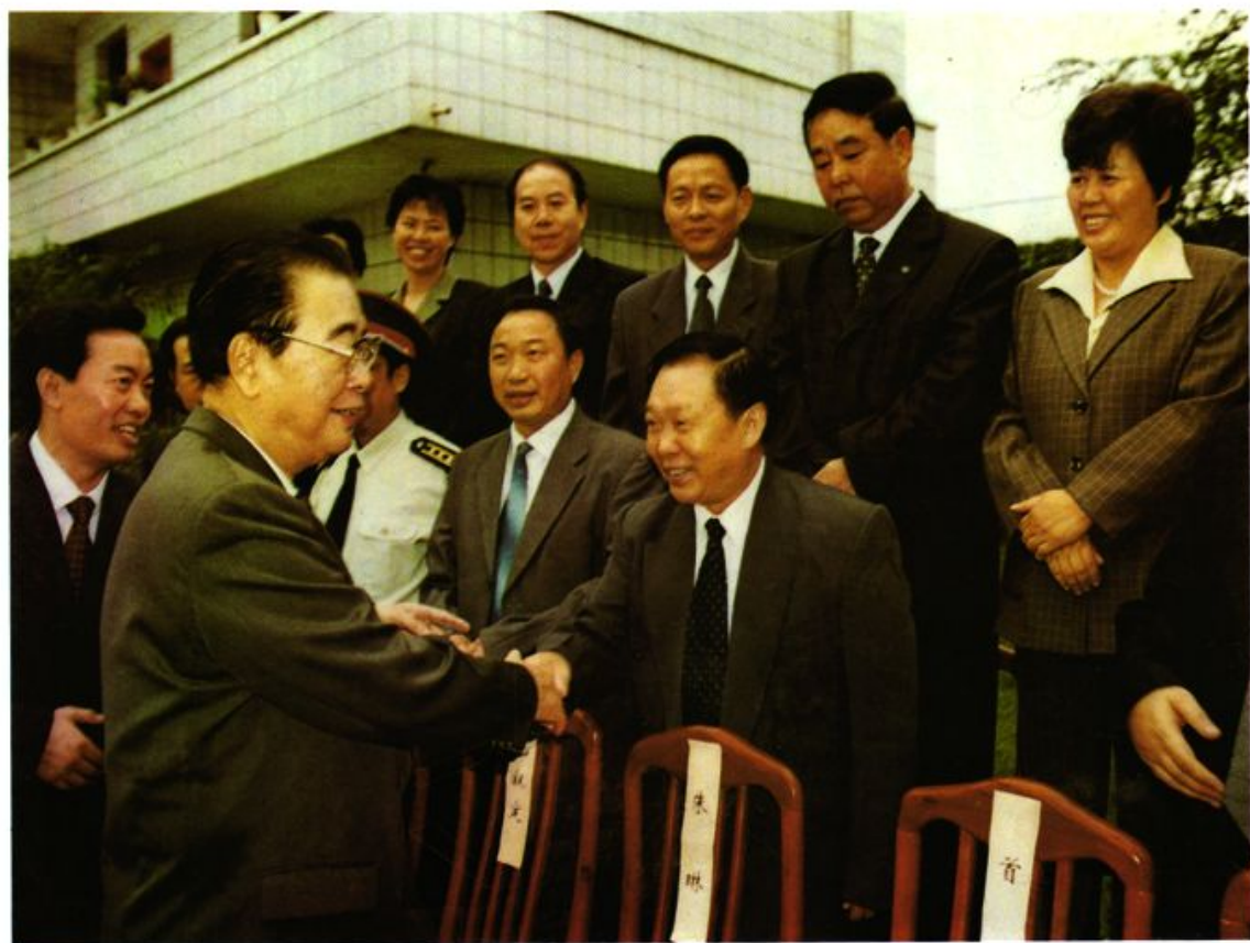
李鹏委员长在县宾馆亲切接见县人大常委会主任杨家常