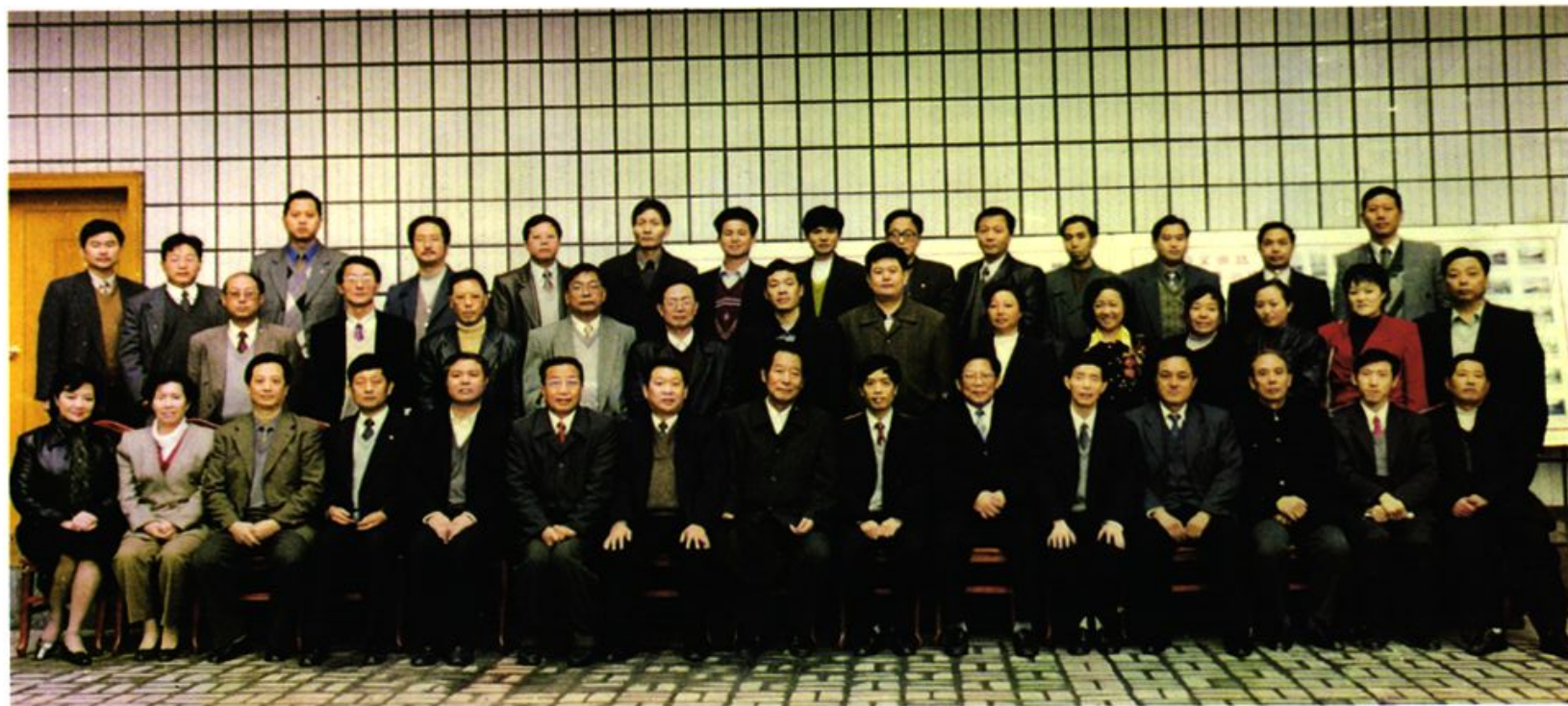
全国人大民委领导赴秀山执法检查期间与县领导及有关部门负责人留影