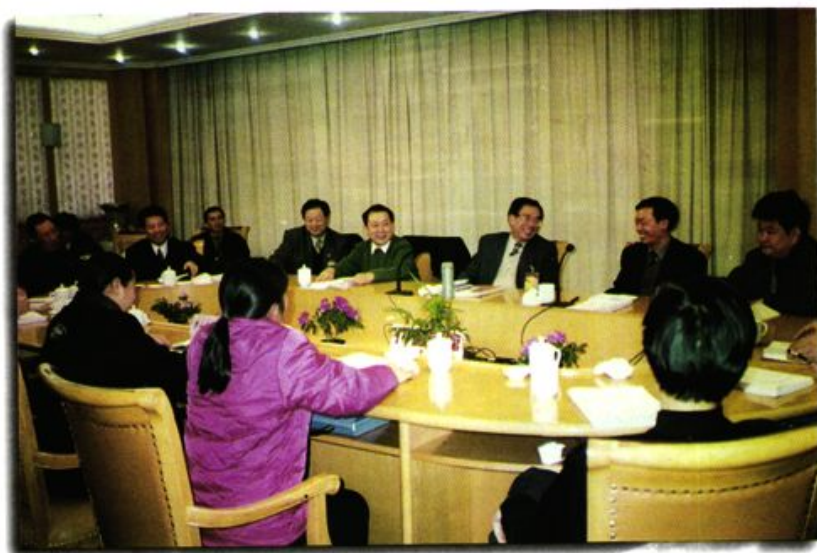
市人大一届六次会议期间，市委书记贺国强参加秀山代表团讨论