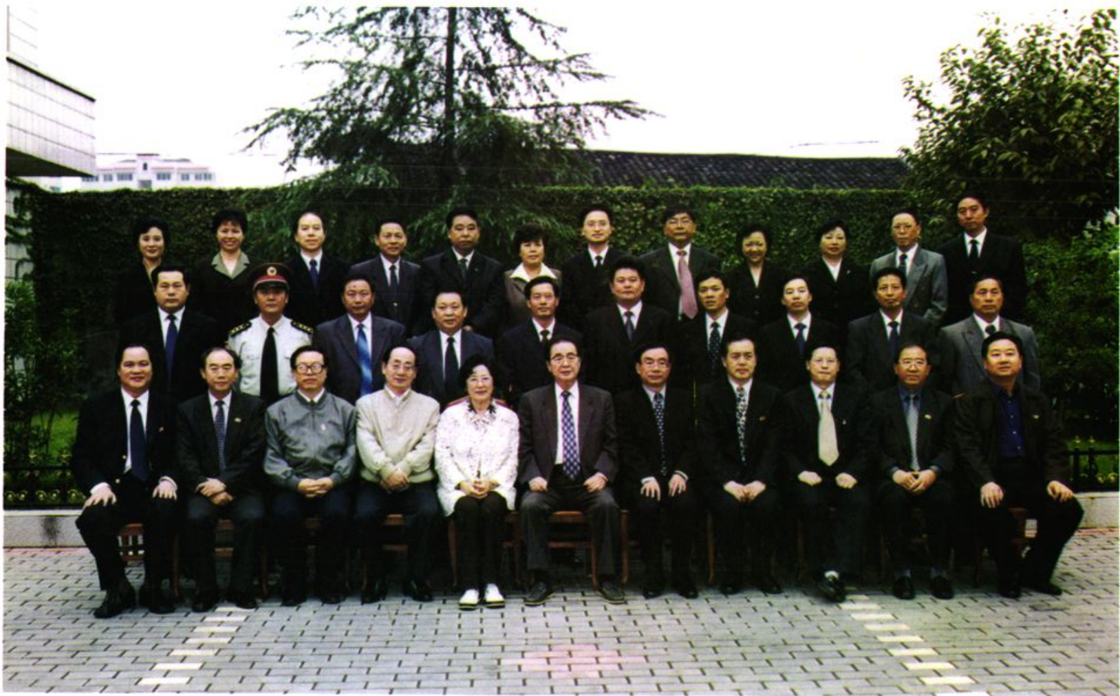
2001年10月2日，全国人大常委会委员长李鹏及夫人朱琳在重庆市委、人大、政府领导陪同下在秀山视察时与县“四大家”主要领导合影