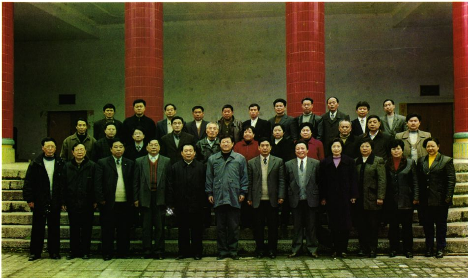
重庆市人大常委会副主任金烈(前排左起6)与县人大机关干部合影