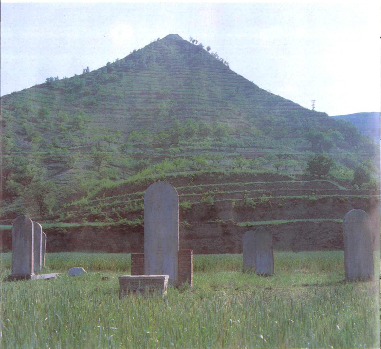
霸陵历经千古，人间春意正浓——汉文帝霸陵