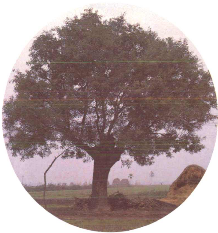
千年古槐，根深叶茂 ——新筑新寺古槐