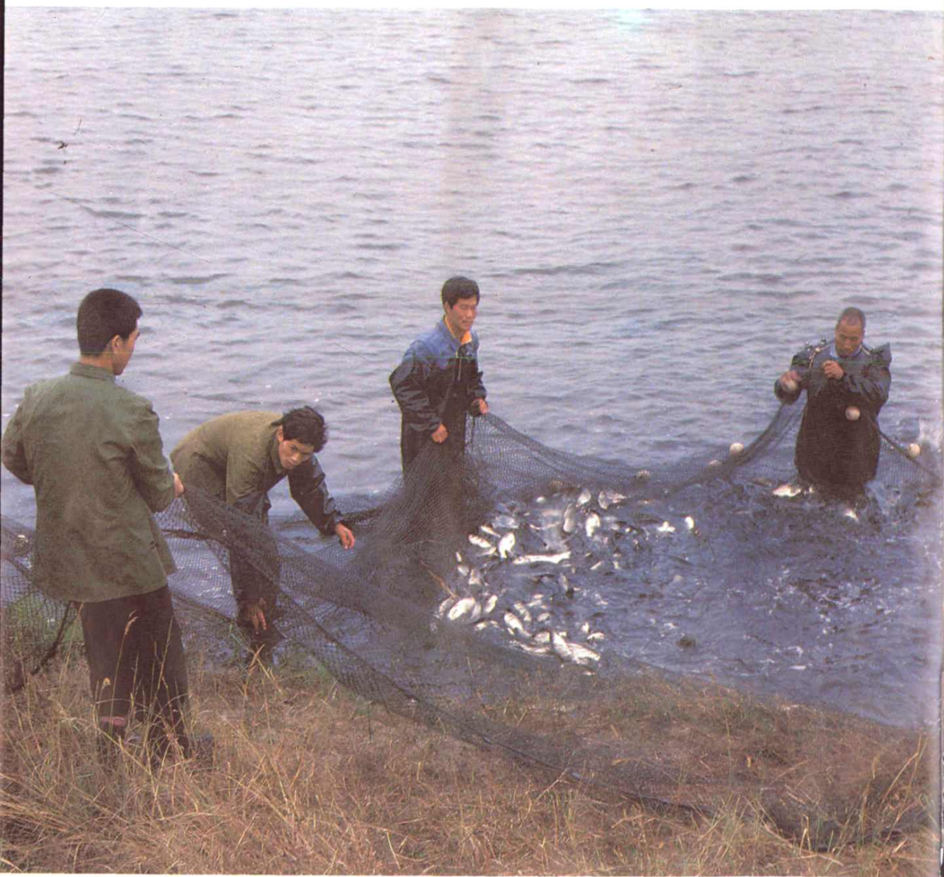
渭水涟漪鲤鱼肥——水流渭河渔场