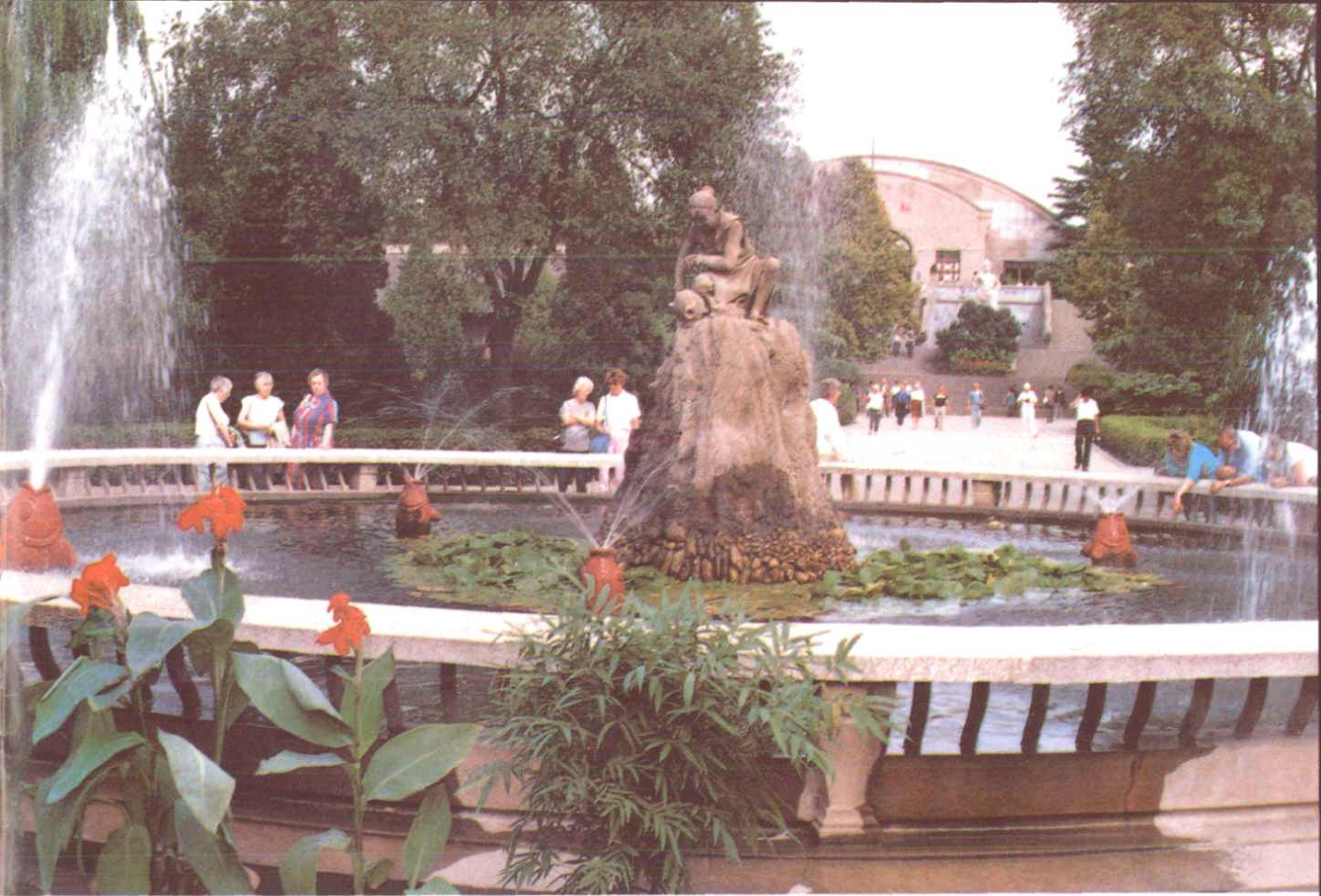
原始先民勤劳聪慧，仰韶文化拓荒启后——半坡博物馆