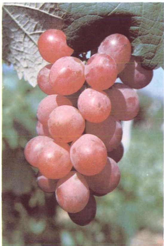
满架葡萄绿满园，出自西域念张骞 ——灞桥区葡萄园基地