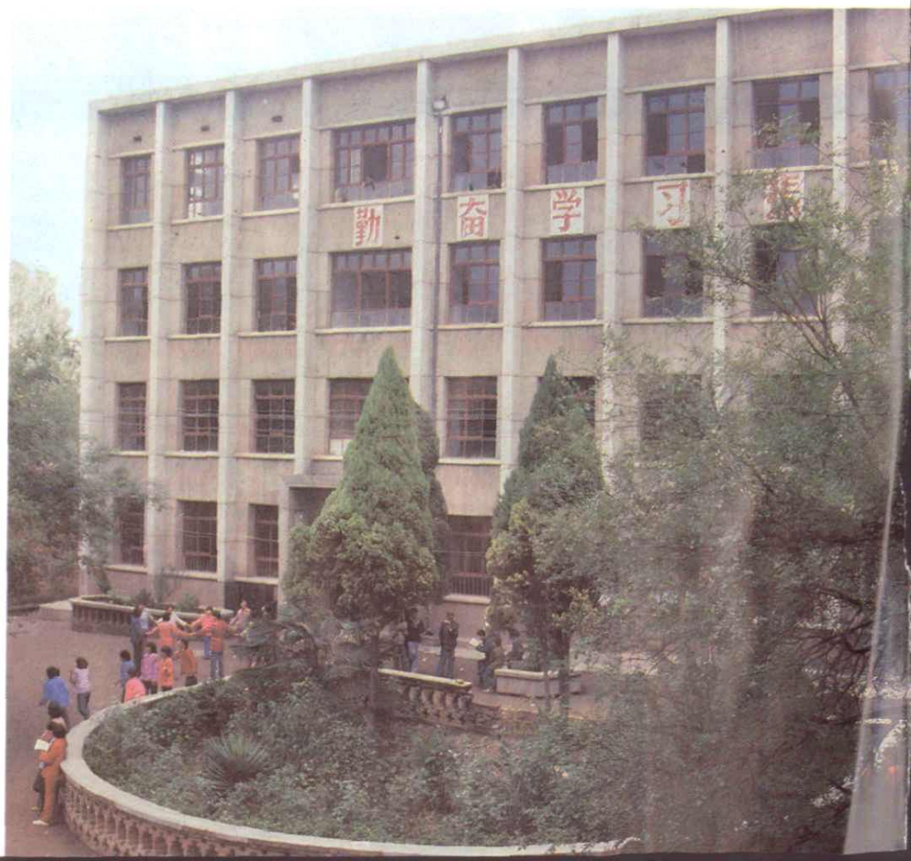
人在春风化雨中 ——西安市五十 五中学