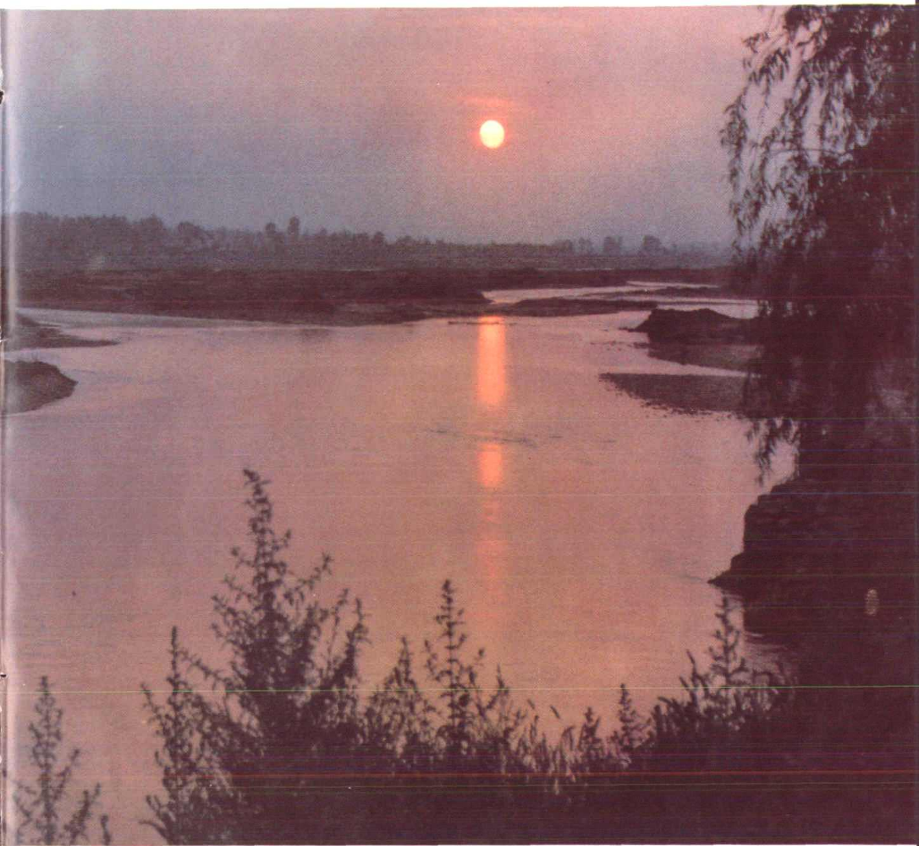
晚霞映倒影，灞柳春色浓——灞河夕照