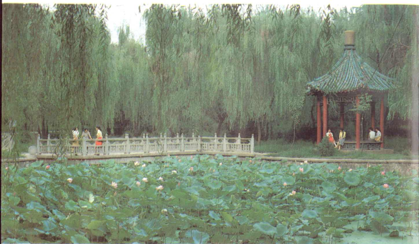
曲径长廊信步，柳荫花下低语——纺织城公园一角