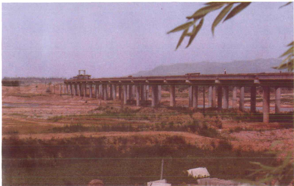
灞桥人喜迎宾客往，“高速桥”助君去观光——正在建设中的高速公路大桥