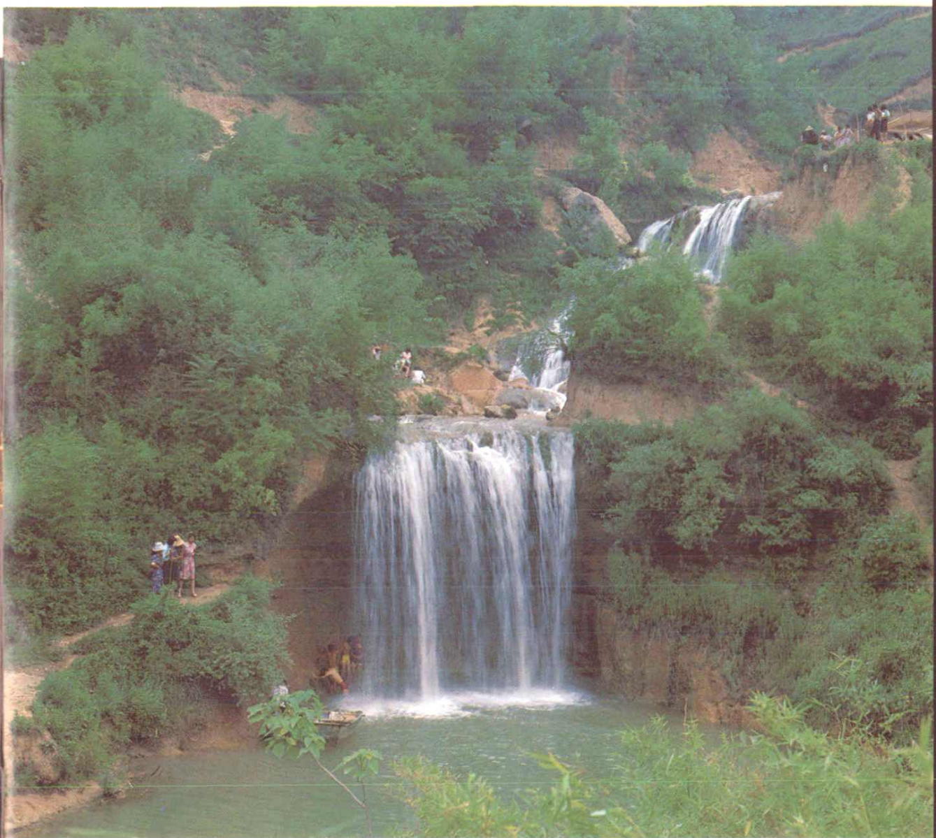
飞流直下千尺崖，疑似银河落人间——狄寨鲸鱼沟瀑布