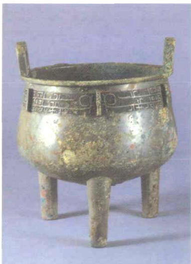
★ 博物馆藏品——成周鼎

博物馆拥有13561件藏品，分为石器、铜器、甲骨、陶器、瓷器、书画、碑帖等几大类。展厅面积有2000多米 2 ，分为10个展区。展览分为基本陈列和临时展览两部分。基本陈列为按时代排布的考古教学标本展，分为旧石器时代、新石器时代、夏商周时期、战国时期、秦汉时期、三国两晋南北朝隋唐时期、宋辽金元明时期七个部分。展品主要包括两个方面的内容：一个方面是辅助中国考古学教学的标本陈列，另一个方面是北京大学考古文博学院的师生历年来考古发掘所取得的重要收获。除此之外，每年至少举办一次特别的临时展览。特展多是兄弟单位支援协助举办的展示考古重大发现的专题展览，先后举办过“韦绝凝思——近年出土简帛精品展”、“西垂遗珍——甘肃礼县秦国西垂陵区铜器特展”、“吉金铸国史——周原出土西周青铜器精粹展”、“金沙淘珍——成都市金沙村遗址出土文物展”、“花舞大唐春——何家村遗宝精粹展”、“景德镇出土明代御窑瓷器珍品展”等有较高研究价值和欣赏价值的专题特展。