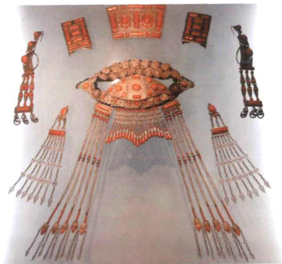
★ 察哈尔蒙古王妃银镶珊瑚头饰

为弘扬民族服饰文化,本馆多次在境内外成功举办展览,2001年在香港成功举办“银装盛彩——中国民族服饰展”,2003年在巴黎举办了“百年时尚——中国服饰展”,受到了法国政府的关注和公众的欢迎。民族服饰博物馆基本陈列“衣冠王国