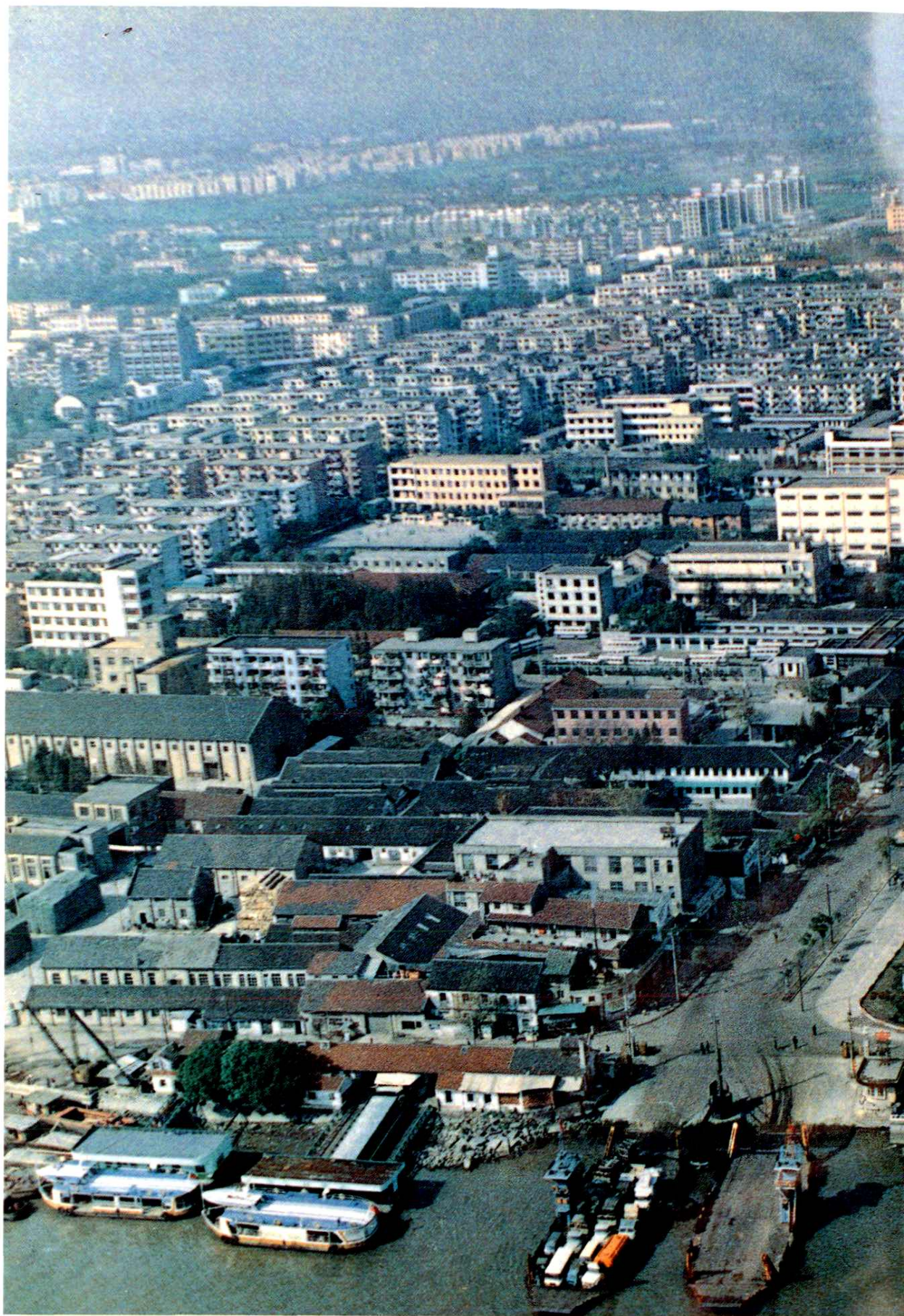
● ● ● 闵行地区鸟瞰