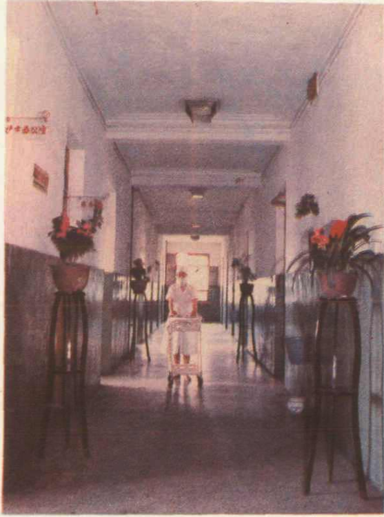
▶ 10. 市第三人民医院外科病区