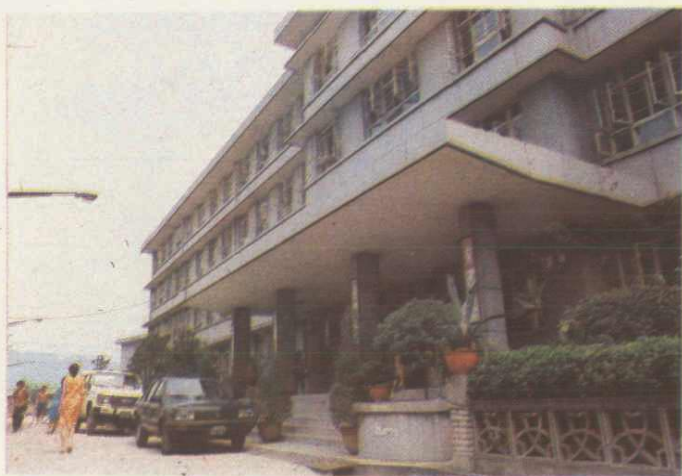
▶ 2. 市妇幼保健院门诊楼