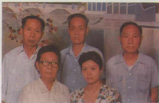
▶ 27. 《自贡市卫生志》编纂人员