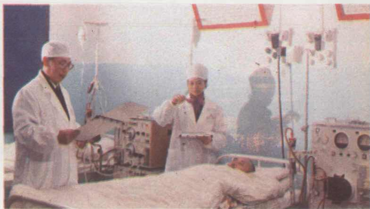
▶ 17. 对病员进行血液净化治疗