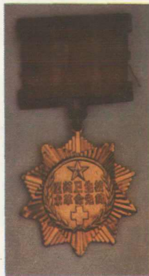
▲ 23. “人工冬眠疗法治疗小儿乙型脑炎”获一九五八年卫生部技术革命先锋奖章