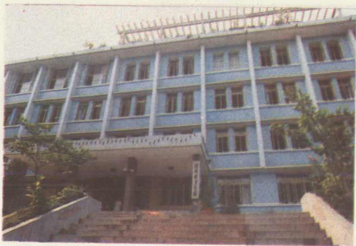
◀ 1. 自贡市卫生局