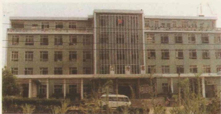
◀ 6. 沿滩区人民医院门诊部