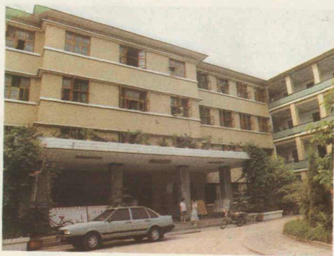
► 7. 川西南矿区医院