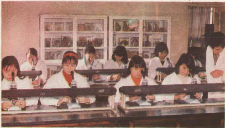
◀ 11. 市卫生学校化验实验室