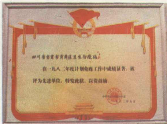
▼ 24. 贡井区卫生防疫站一九八二年获卫生部“计划免疫成绩显著”奖状