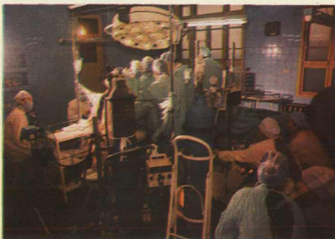
直视手术 ▶ 14. 医护人员正在作体外循环心脏