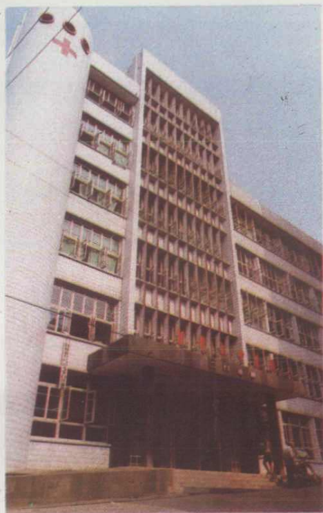
◀ 4. 市第一人民医院内科楼