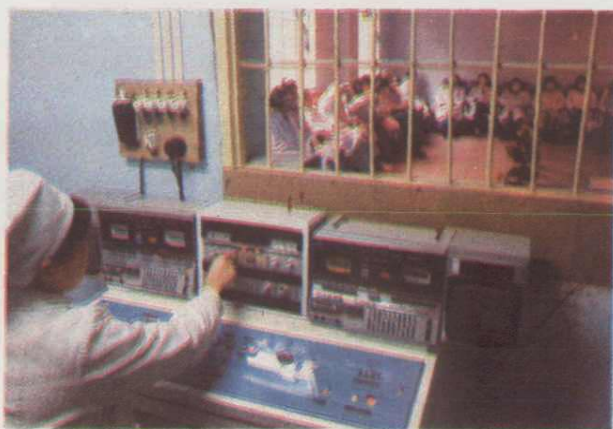
◀ 16. 对精神病患者给予音乐治疗