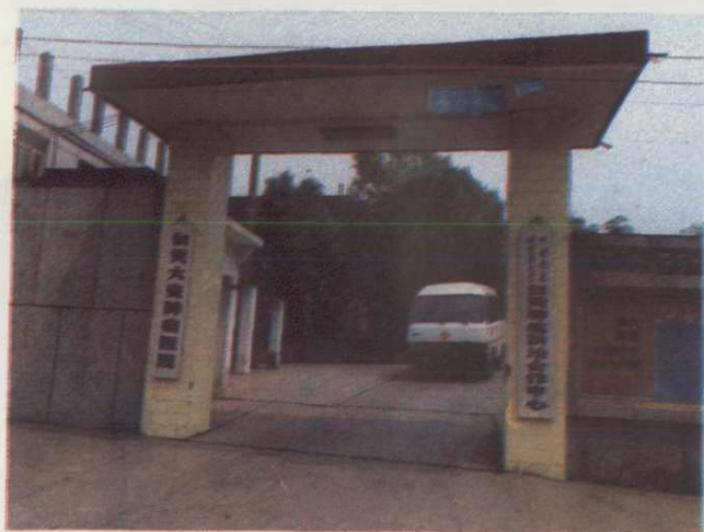
◀ 8. 大安肿瘤医院