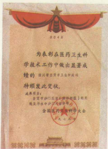
◀ 22. 「自贡市沙门氏菌(国际新型)的发现及污水中沙门氏菌分布」获一九七八年全国医药卫生科学大会奖状