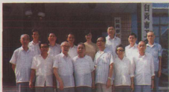
◀ 26. 《自贡市卫生志》编纂领导小组人员