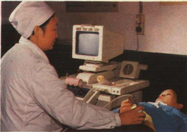
◀ 19. 超 检查