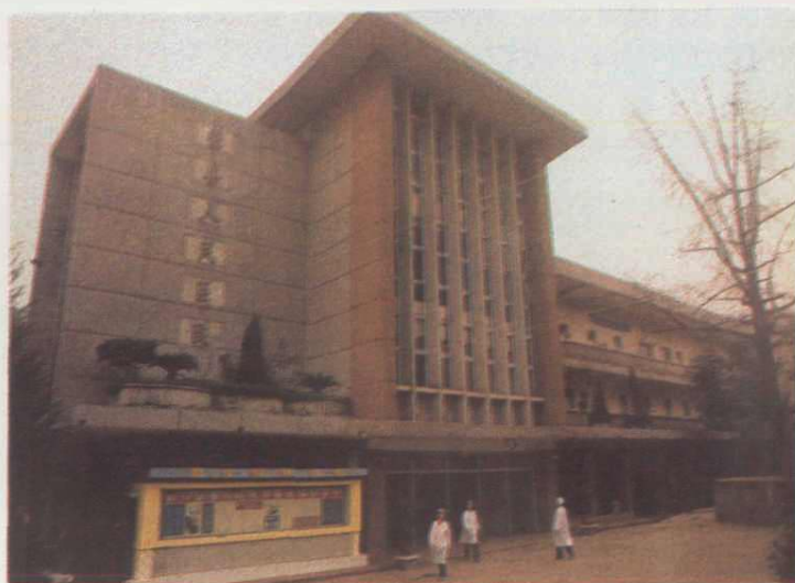
▶ 9. 荣县人民医院门诊楼