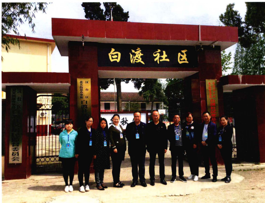
社区两委及工作人员