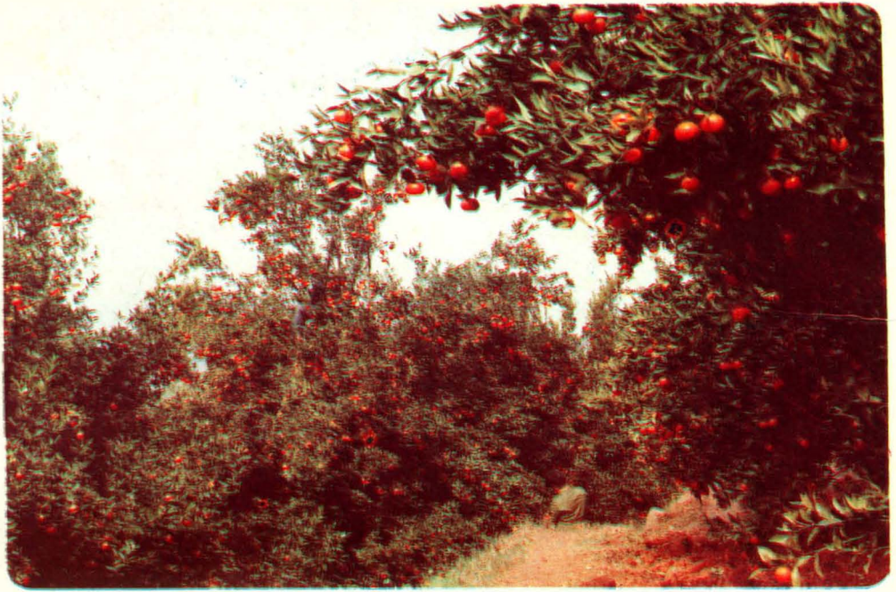
图为硕果累累的大安公社三桥大队广柑园