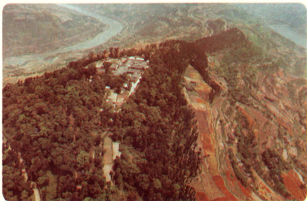
“云顶山寺”——成都市文物保护单位。 图左上为沱江 右上为云顶湖。