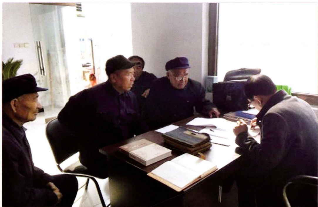
东钟村志编委会在工作