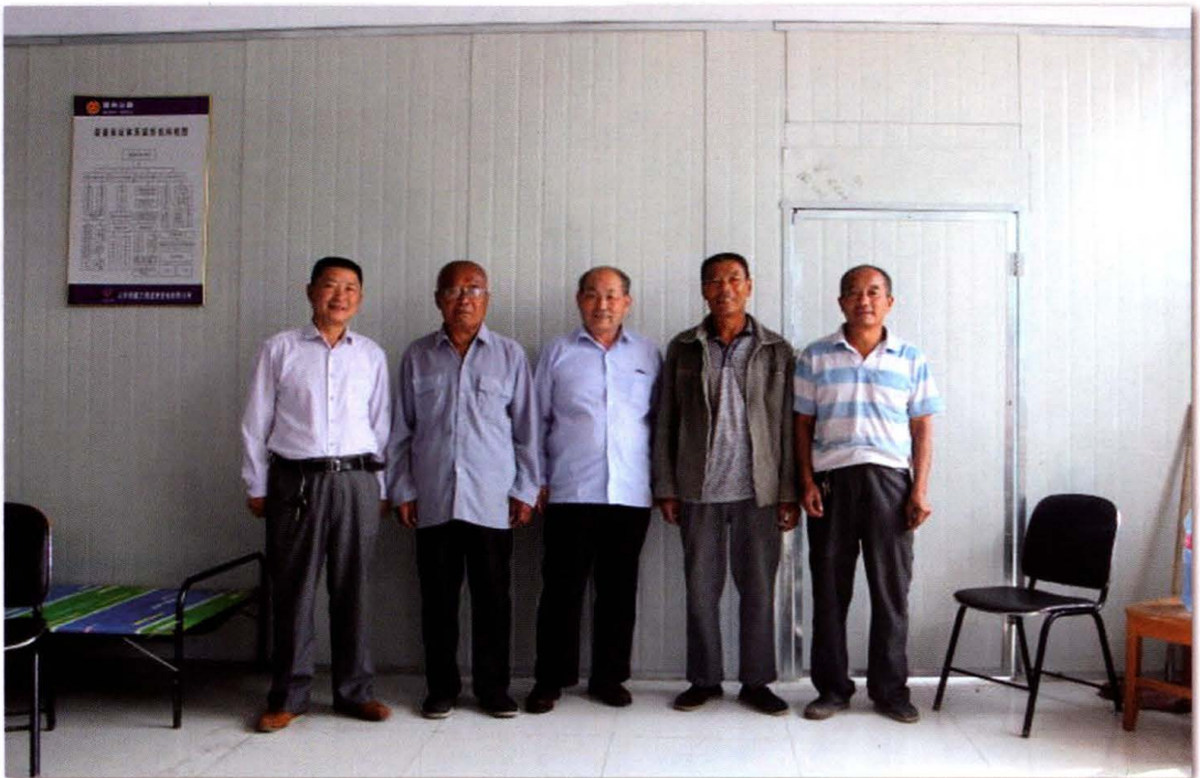
东钟村红白理事会成员