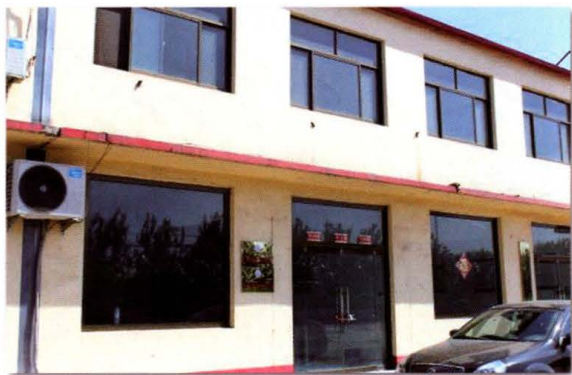
忠义社区居民委员会办公室