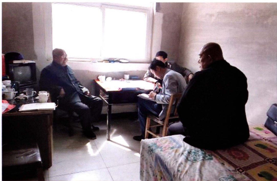
东钟村志编写人员入户采访资料