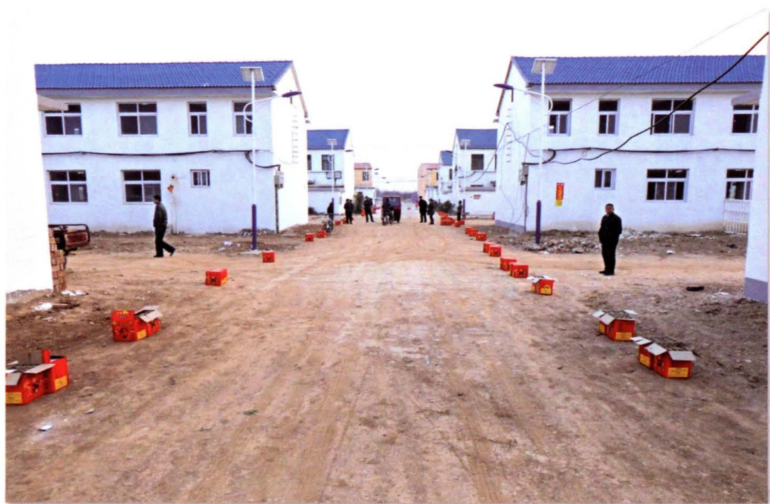
忠义社区居民点建成之初