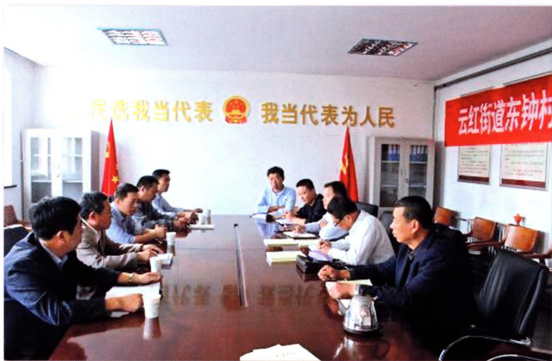
2016年10月东钟村志评审会