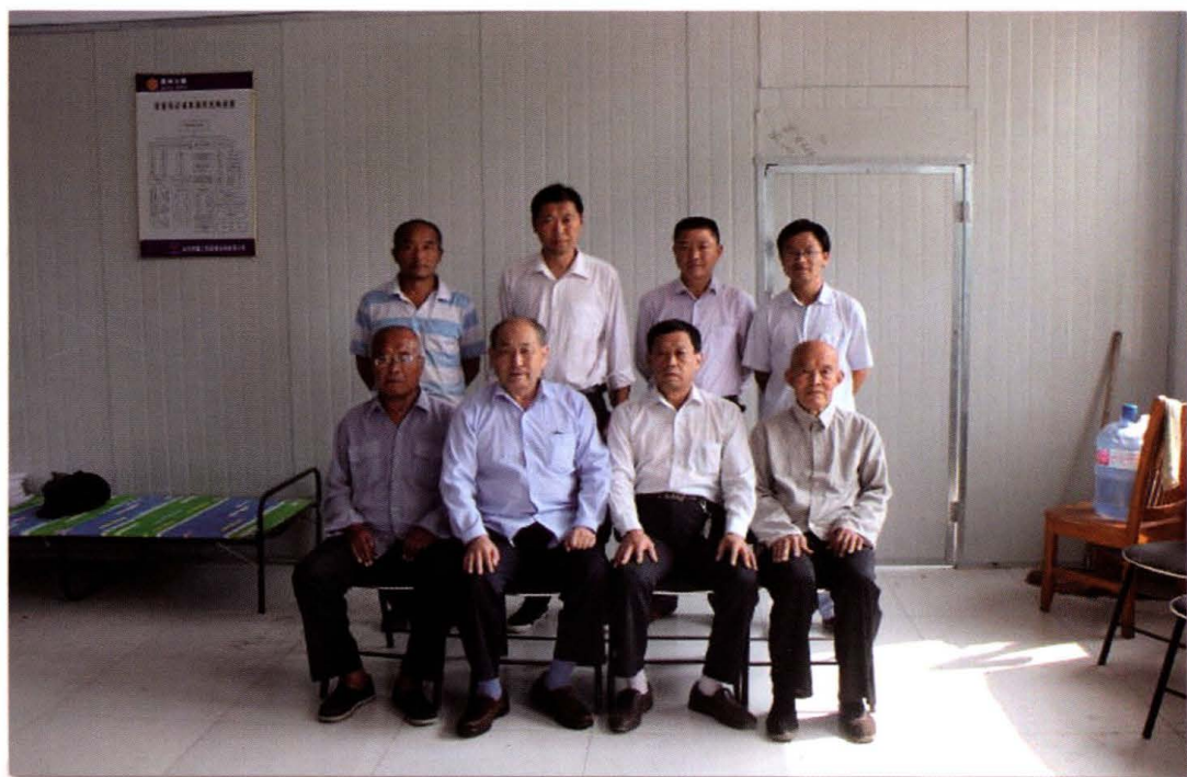
东钟村志编委会成员