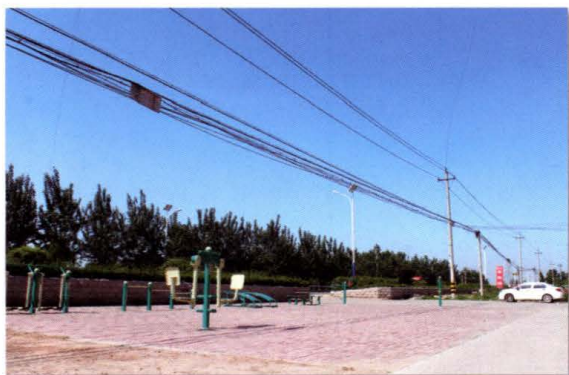
社区广场内的健身器材