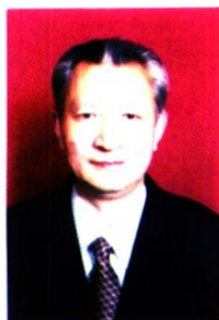
康 阳 明 曾任局秘书股、政工股股长