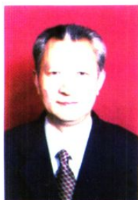
康 阳 明 曾任局秘书股、政工股股长