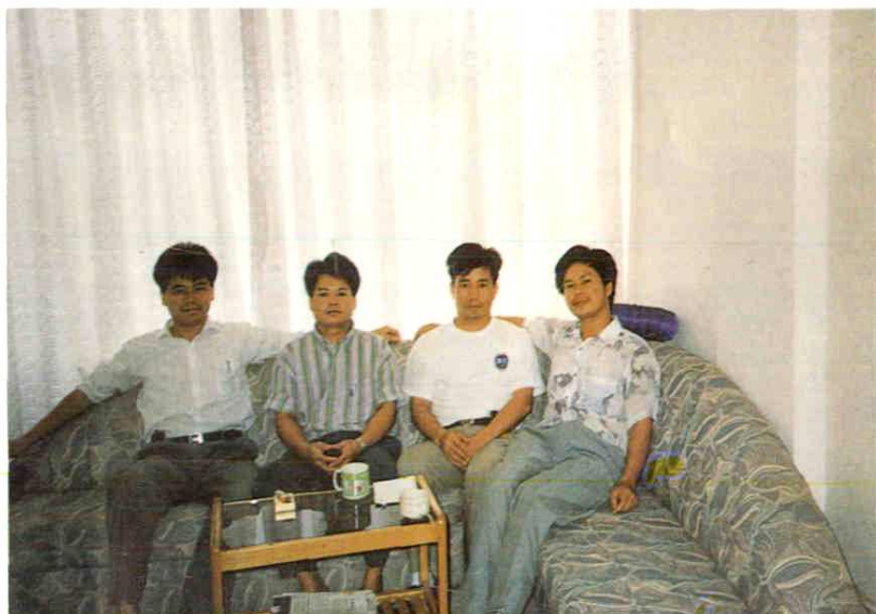
农机服务公司领导干部合影