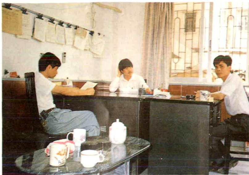
农机供应公司领导干部在办公室工作