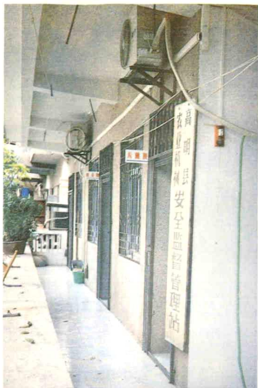
高明县农业机械安全监督管理站