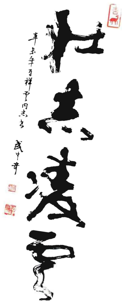
武中奇 中国著名书法家