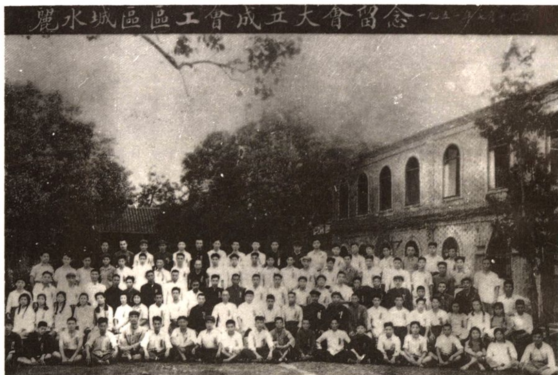
麗水城區區工會成立大會合影