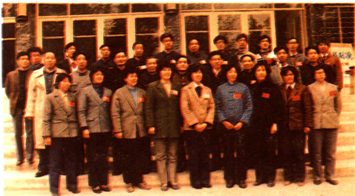
市总工会第十一届委员会委员合影