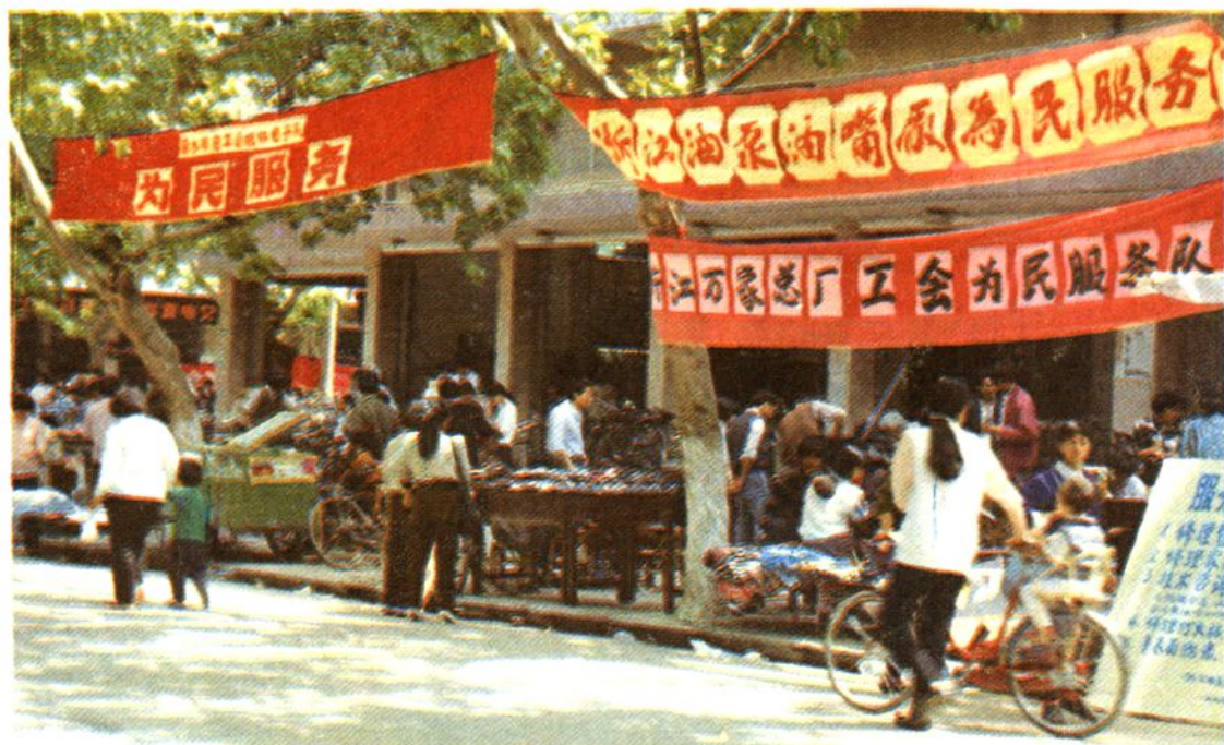
工会为民 服务队街头