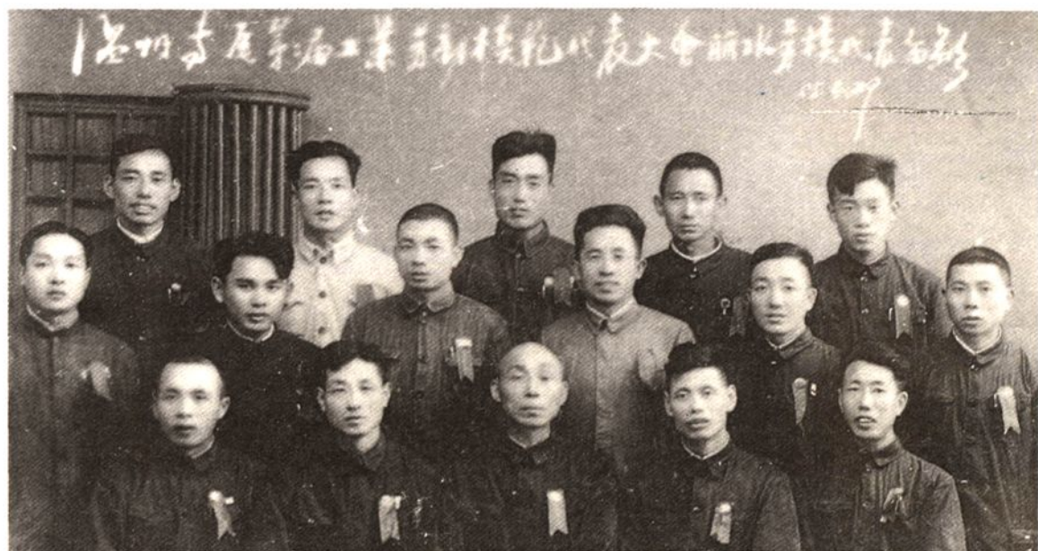
出席专区工业劳模代表大会丽水县代表合影