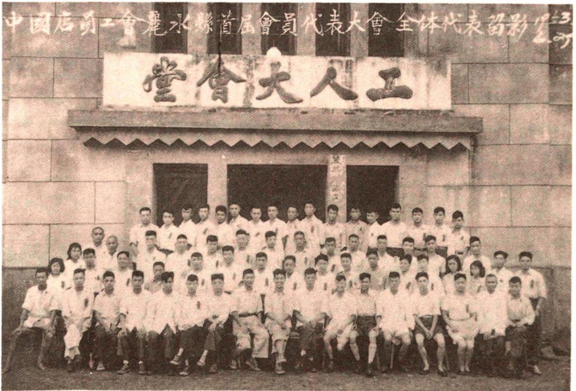
产业工会店员工会 成立大会合影