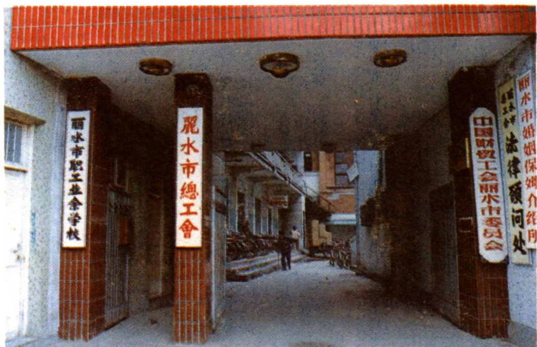
丽水市总工会大门