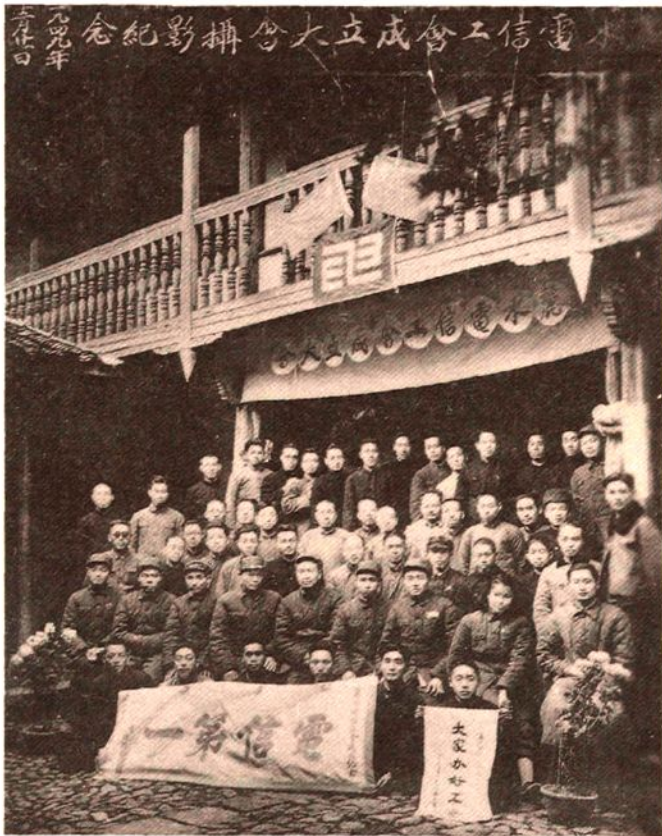
基层工会电信工会 成立大会合影