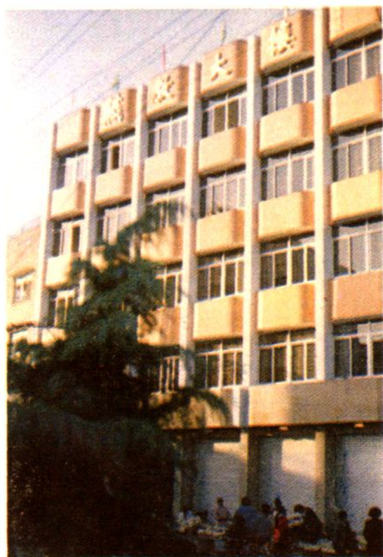
市职工业余学校教学大楼