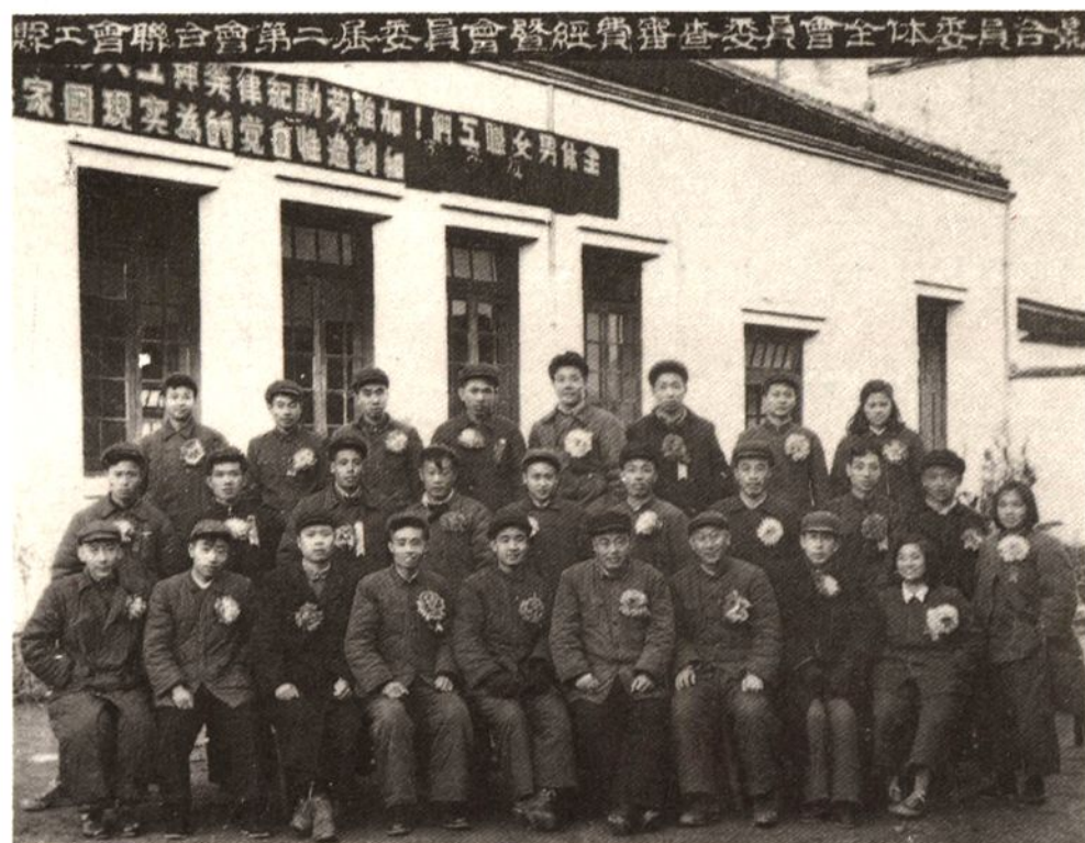
县工会第二届委员会委员合影