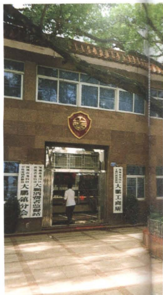
▲ 深圳市龙岗工商分局枯倒的百年古榕树上“爱古榕”碑志（1997年11月）