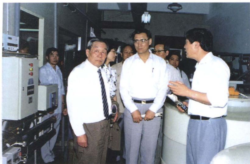
◀ 国家工商行政管理局局长任中林（前左1）在广东省工商行政管理局局长刘春亭（前左2）陪同下考察深圳市企业（1987年5月）