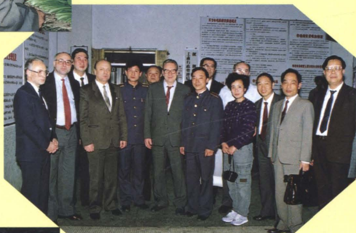
▶ 苏联国家物价委员会代表团访问深圳市（1990年12月）