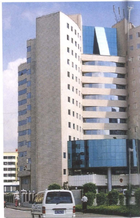
▲ 深圳市龙岗工商分局办大