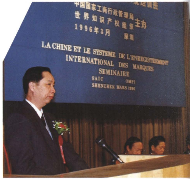
▶ 国家工商行政管理局和世界知识产权组织联合在深圳市举办培训班,国家工商行政管理局局长王众孚在开幕式上讲话(1996年3月)