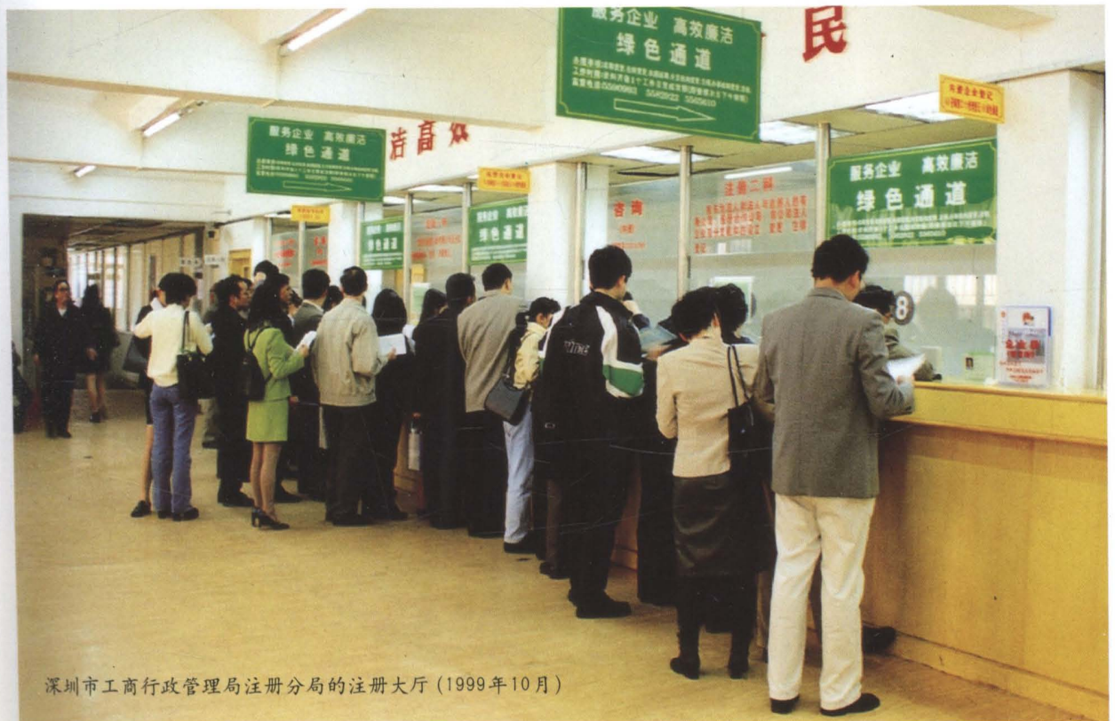
深圳市工商行政管理局注册分局的注册大厅（1999年10月）

◀ 深圳市工商行政管理局召开“深圳市转变政府职能试点工作总结大会”（1994年10月）