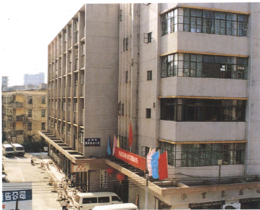
▲ 深圳市工商行政管理局1982年12月迁入桂园路红围一巷一号新办公大楼