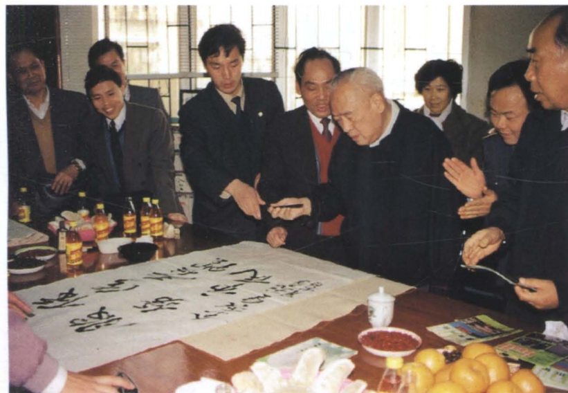
◀ 原中共中央顾问委员会委员、原中国人民解放军总政治部主任余秋里（右4）到深圳市福田区园岭市场视察并题词（1993年1月）