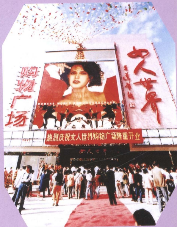
▲ 深圳市福田区华强北路商业 街的“女人世界”（1995年8 月开业）