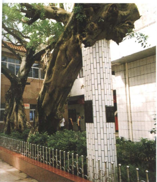
大鹏工商所办公楼(为保护门前两棵行将 工商所特竖立水泥支柱,建起花坛,并刻 成人们传为“爱护环境,保护树木”佳话