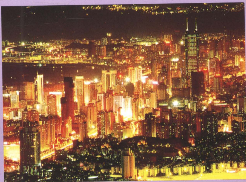
▲ 繁华灿烂的深圳夜市