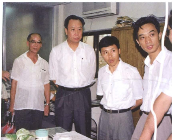
▲ 中共深圳市委书记厉有为(右3)到市工商行政管理局检查工作(1994年7月)