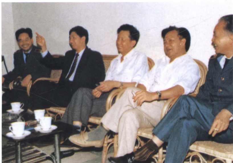
▶ 国家工商行政管理局副局长甘国屏（左2）在深圳市个体劳动者协会检查指导工作（1989年3月）