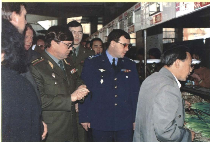
◀ 苏联国家价格委员会主席帕甫洛夫（前右2）一行6人访问深圳市（1988年9月）