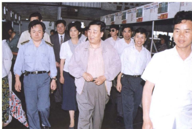
▲ 中国人民银行行长李贵鲜(前中)到深圳市福田区园岭市场考察(1994年5月)