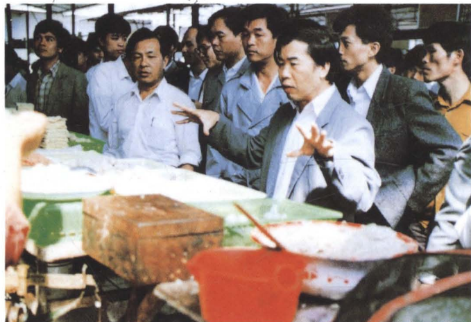
▲ 深圳市工商行政管理局领导深入罗湖区广场临时市场了解市场监管情况 (1986年11月)