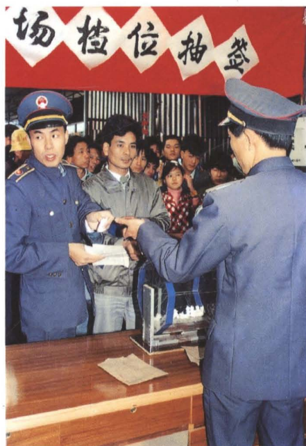
▲ 深圳市福田区白沙岭临时市场在进行档位抽签 (1990年1月)