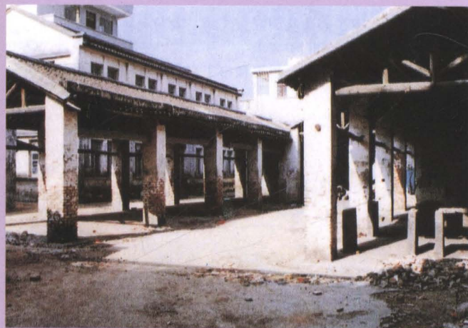
▲ 面积只有300平方米的蛇口旧市场(20世纪60年代初建)