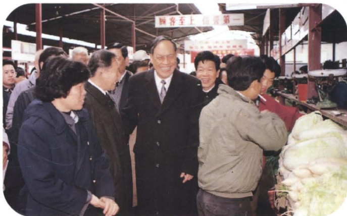
▲ 深圳市市长李灏(左3)到罗湖区广场市场检查节日供应情况(1994年7月)