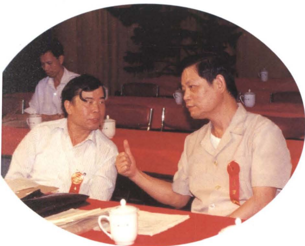
▲ 深圳市副市长李广镇(右1)出席市个体劳动者协会第二届代表大会(1988年10月)