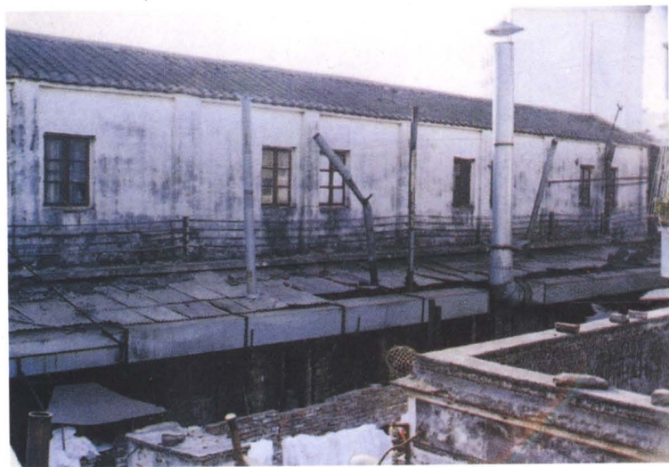
▲ 深圳市工商行政管理局位于东门老街南塘肉菜市场砖瓦加铁皮结构的原办公楼，被人们戏称为“铁打的工商”（1982年以前）