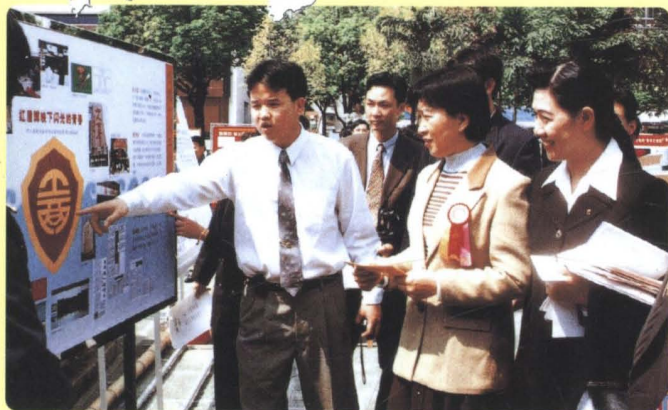
◀ 中共深圳市委副书记黄丽满（前左2），在共青团市委书记林洁（右1）陪同下，到市工商行政管理局专业市场管理分局考察创建“青年文明号”工作（1997年3月）