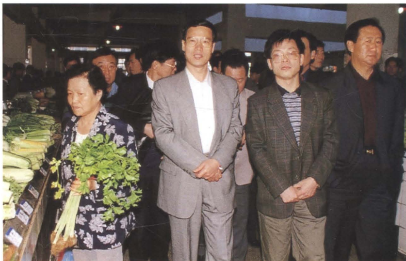
▶ 中共广东省副书记、中共深圳市委书记张高丽(右3)到深圳市福田区园岭市场了解商品供应与管理情况(1999年2月)