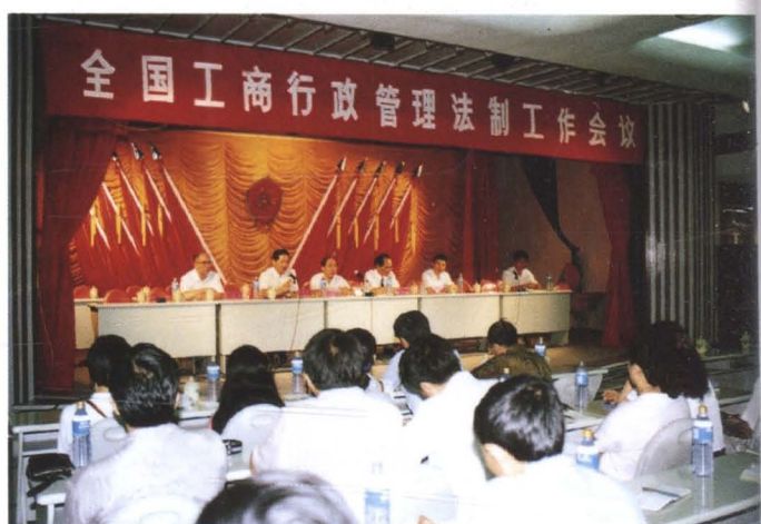
▲ 国家工商行政管理局副局长曹天站(左2)在深圳市召开的全国工商行政管理法制工作会议上讲话(1993年7月)