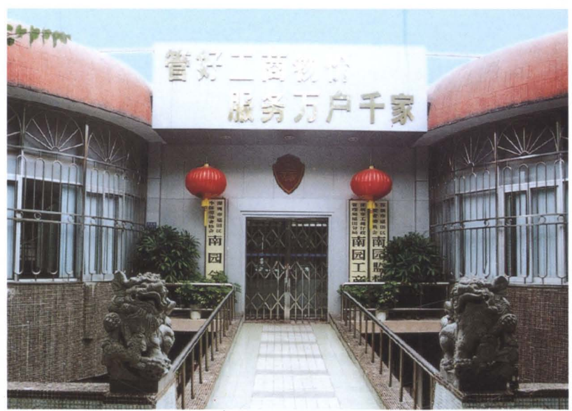
▲ 深圳市福田区工商分局南园工商所办公楼(1999年迁入)