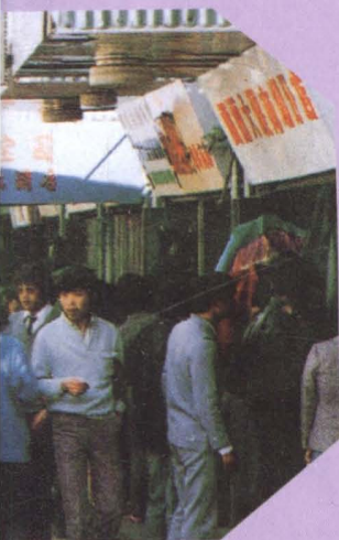
◀ 深圳市工商行政管理局组织兴建的第一座 专业市场——位于布吉北侧的人民桥小 商品市场（1984年5 月建成）