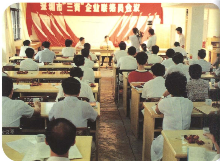
▲ 深圳市工商行政管理局在“三资”企业中建立联络员制度 (1990年)