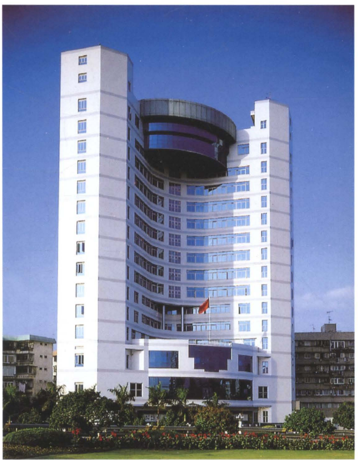
▲ 深圳市罗湖工商分局办公大楼(1998年4月建成)