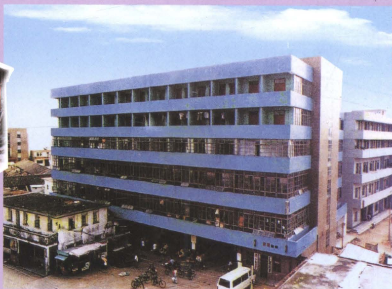
▲ 深圳市盐田区农贸市场(1985年10月建成)