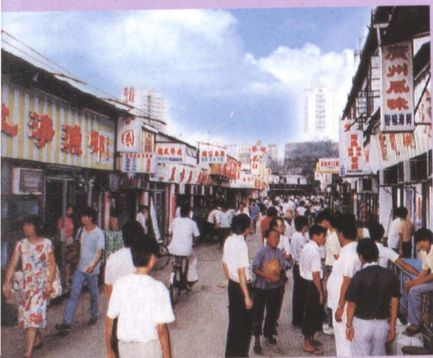
▲ 深圳经济特区初期兴建的东门南塘 汇食街（20世纪80年代）