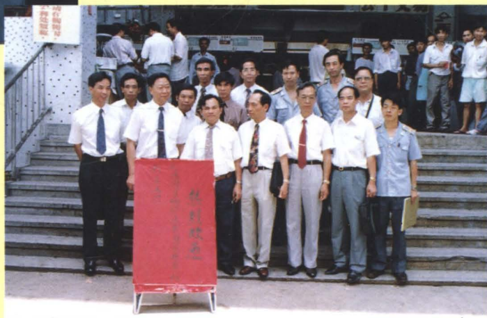
▶ 越南国家物价代表团到深圳市福田区园岭市场参观考察（1994年1月）