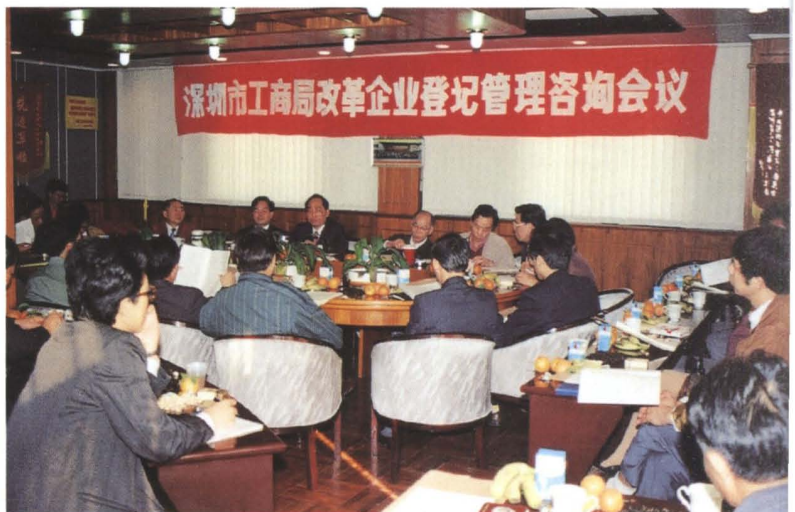
▶ 深圳市工商行政管理局召开“改革企业登记管理咨询会议”，广泛征求社会各界意见 (1993年5月)