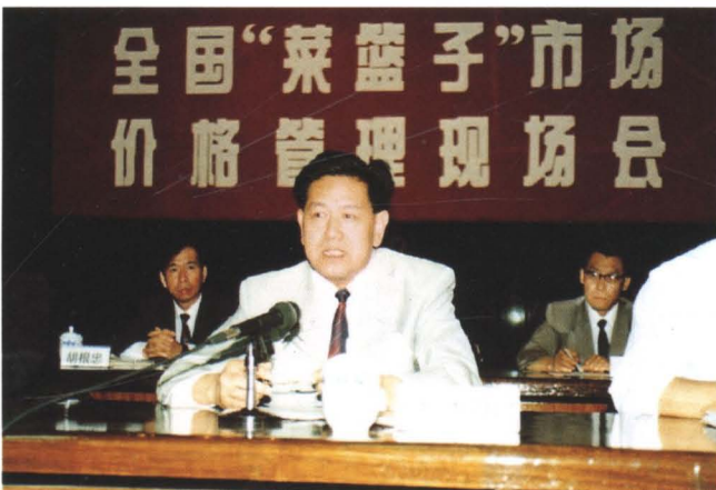
◀ 广东省副省长刘维明在深圳市召开的全国“菜篮子”市场价格管理现场会上讲话(1994年11月)