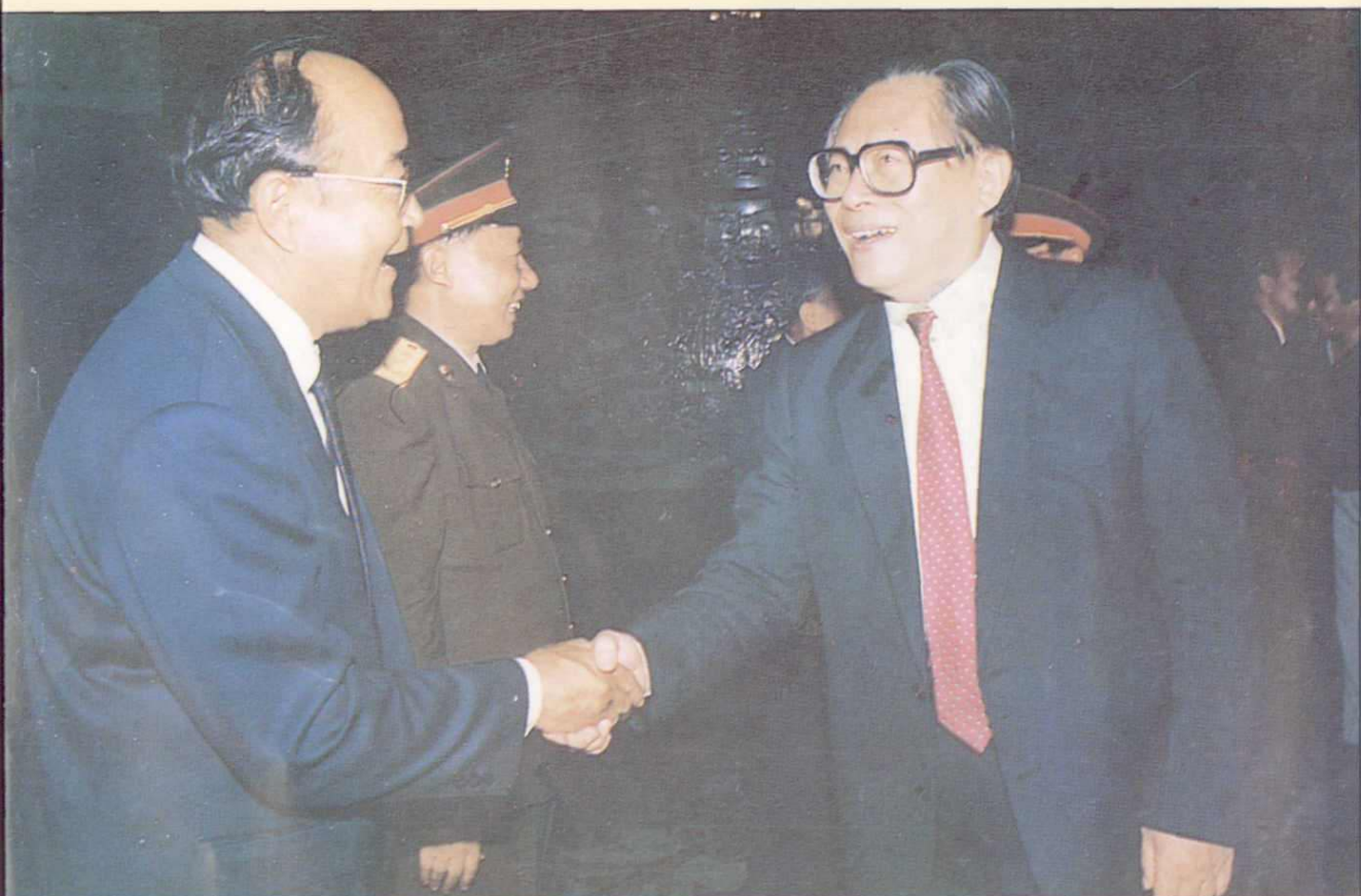
▲中共中央总书记江泽民与新疆自治区第六届政协主席巴岱亲切握手