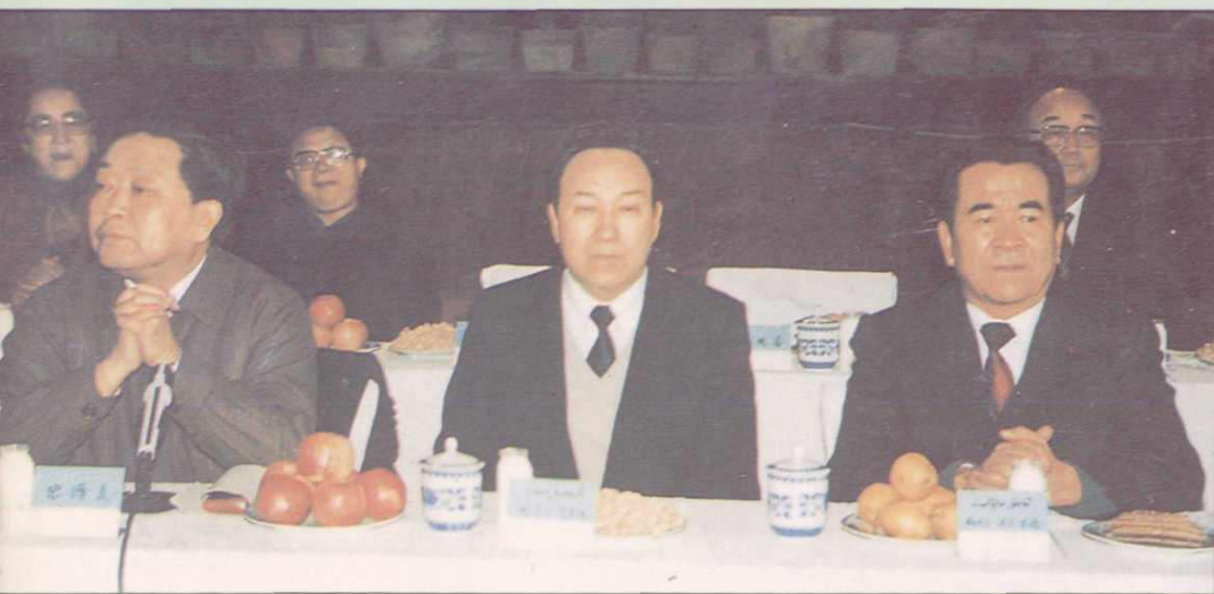
▲全国政协副主席司马义·艾买提和新疆维吾尔自治区主要领导参加政协茶话会