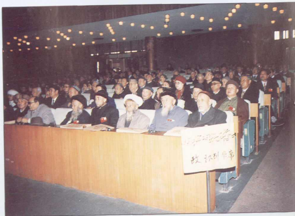
►新疆自治区政协委员列席自治区人大会议,听取政府工作报告