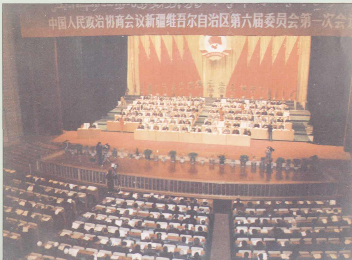
▲新疆自治区政协六届一次会议会场