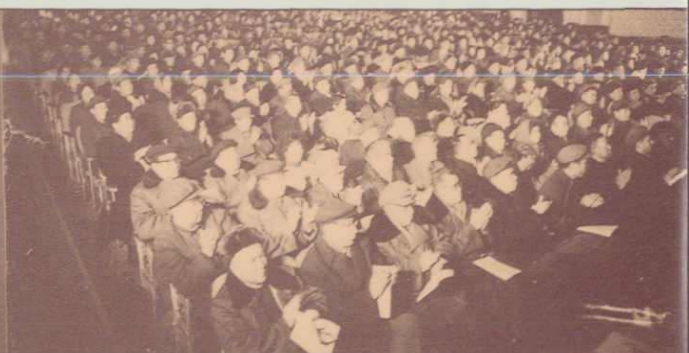
▲新疆维吾尔自治区政协四届五次會議会场