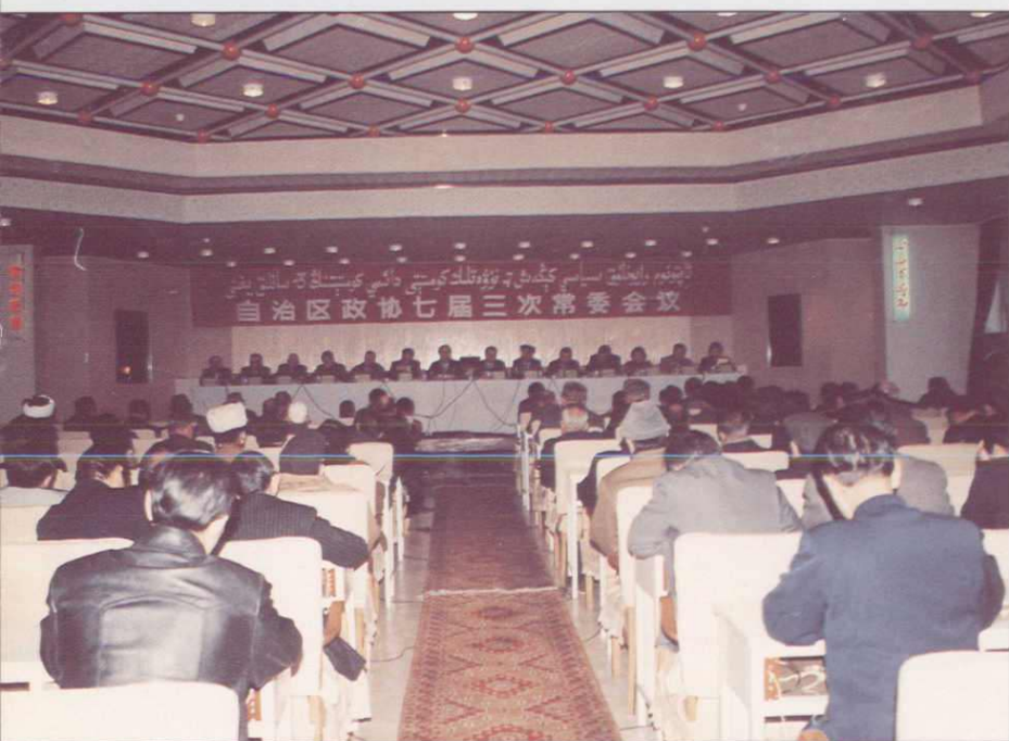
◀1993年12月15日,新疆自治区政协七届三次常委会委员听取自治区党委副书记、自治区副主席王乐泉关于新疆经济形势的通报