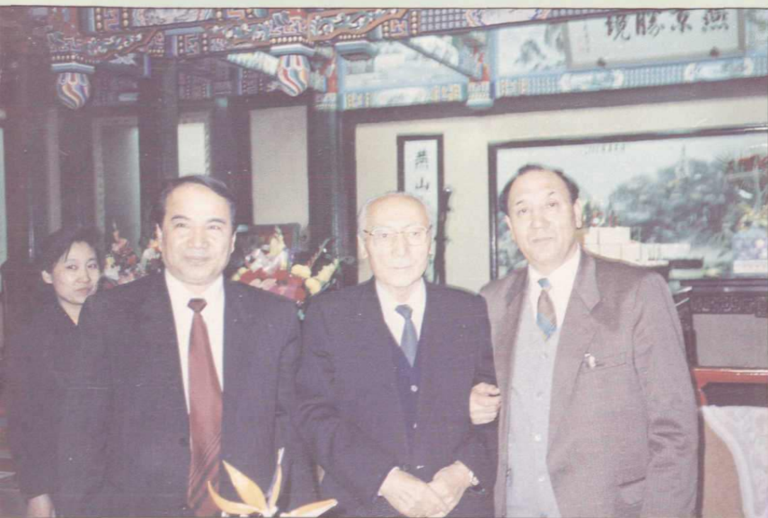
▲全国政协副主席赛福鼎·艾则孜和新疆维吾尔自治区部分领导在一起