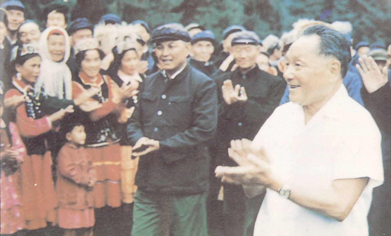
▲1981年，全国政协主席邓小平视察新疆期间，接见部分群众