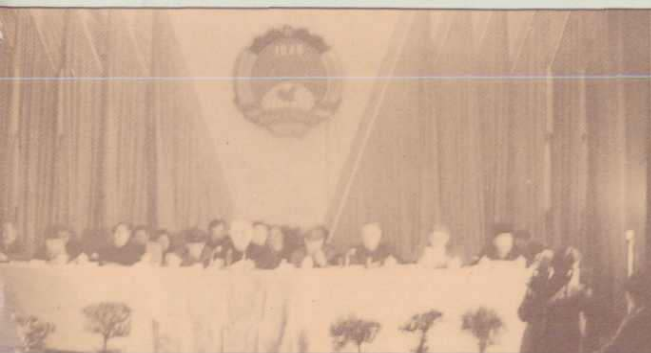
▲新疆维吾尔自治区政协四届五次會議主席台