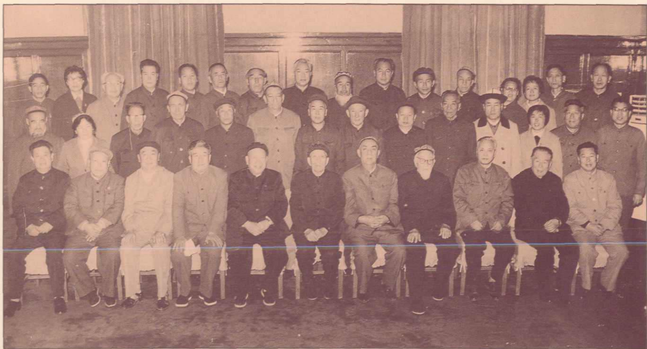
▲1983年10月,王震、杨静仁、包尔汉等中央领导接见新疆自治区政协赴内地参观团全体成员时合影