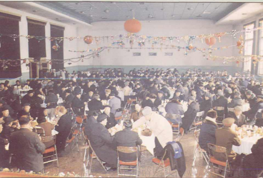
◀ 新疆自治区政协 1988年迎春茶话会