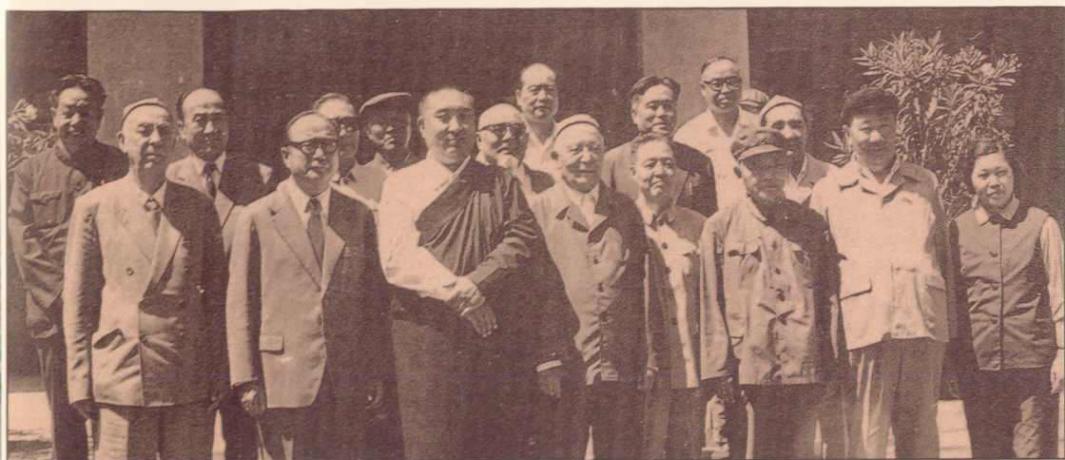
▲1984年，全国人大常委会副委员长班禅·额尔德尼却吉坚赞与新疆自治区政协领导合影