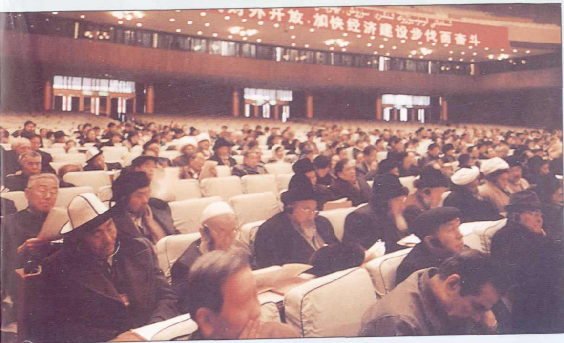
▲新疆自治区政协七届一次会议大会会场