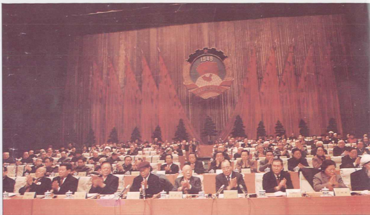
▲新疆自治区政协七届一次会议主席台