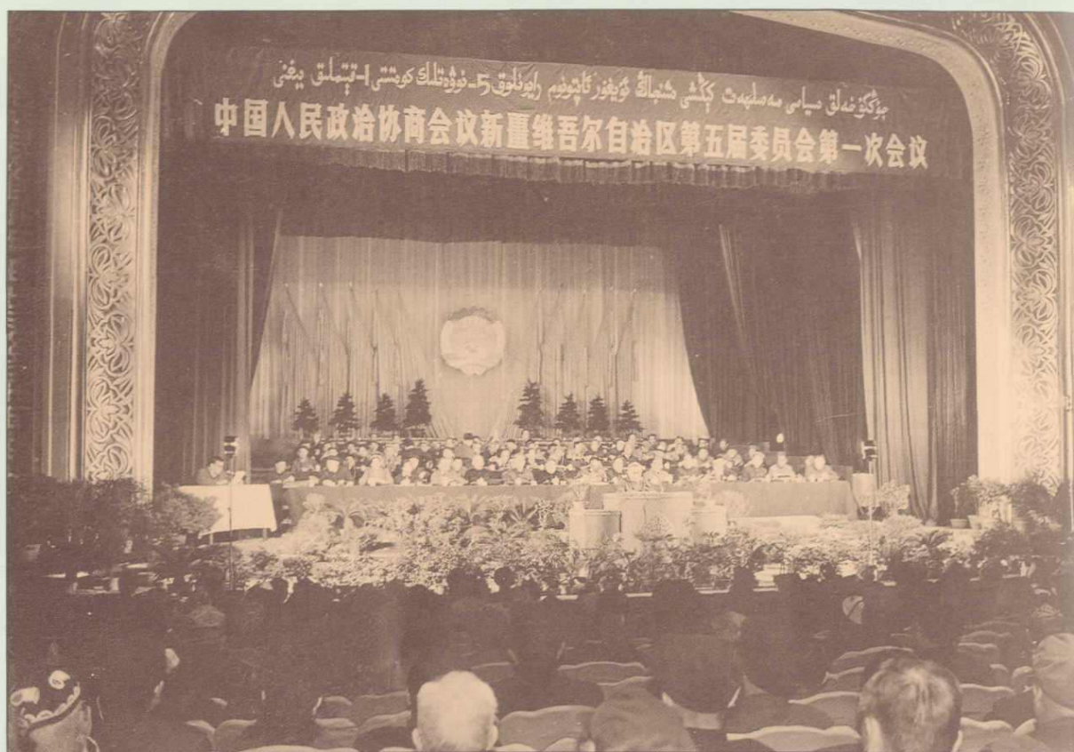
▲新疆自治区政协五届一次会议会场