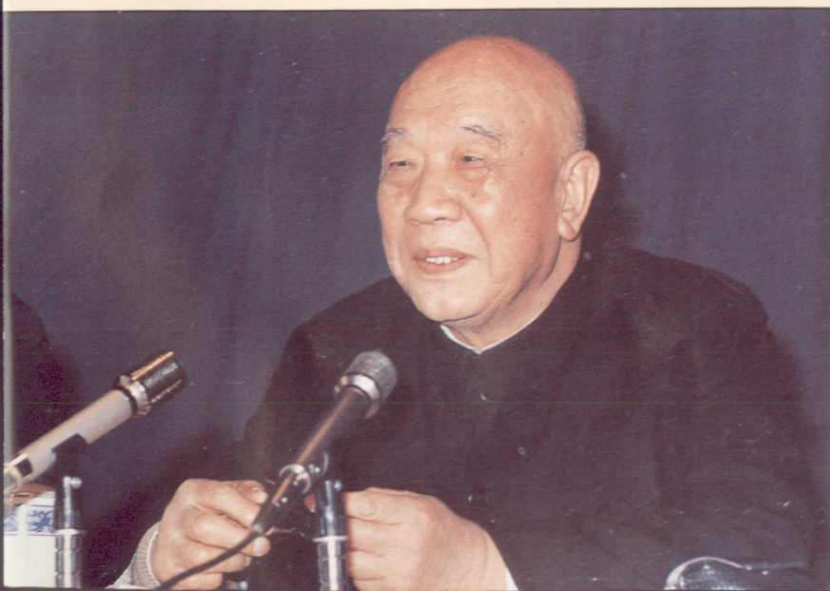
◀全国政协副主席王恩茂在新疆自治区政协会议上讲话