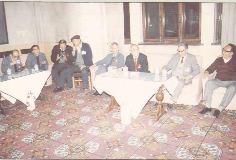
◀ 新疆自治区政协党派 组委员讨论政府工作报告， 坦诚建言