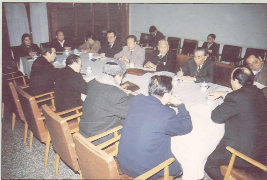
▶ 新疆自治区政协七届 二次主席会议讨论部署工作