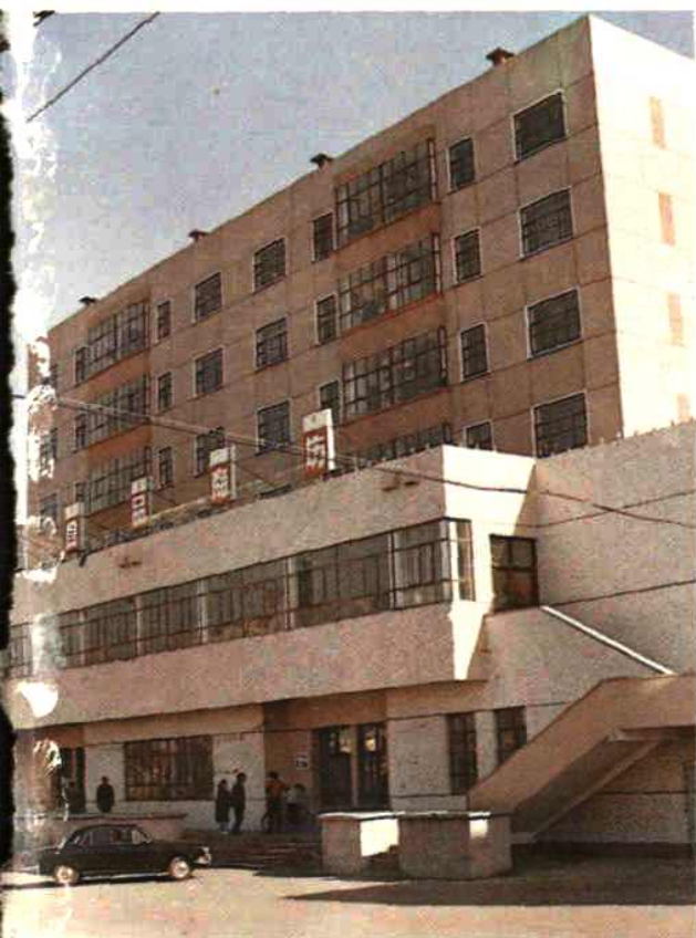
伊敏大街食品商场