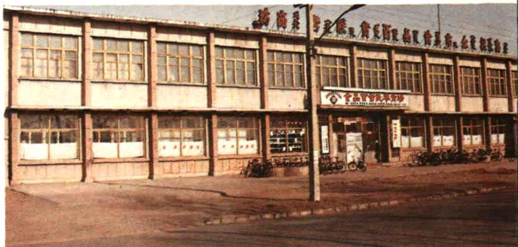
食品联营商场和公司办公处