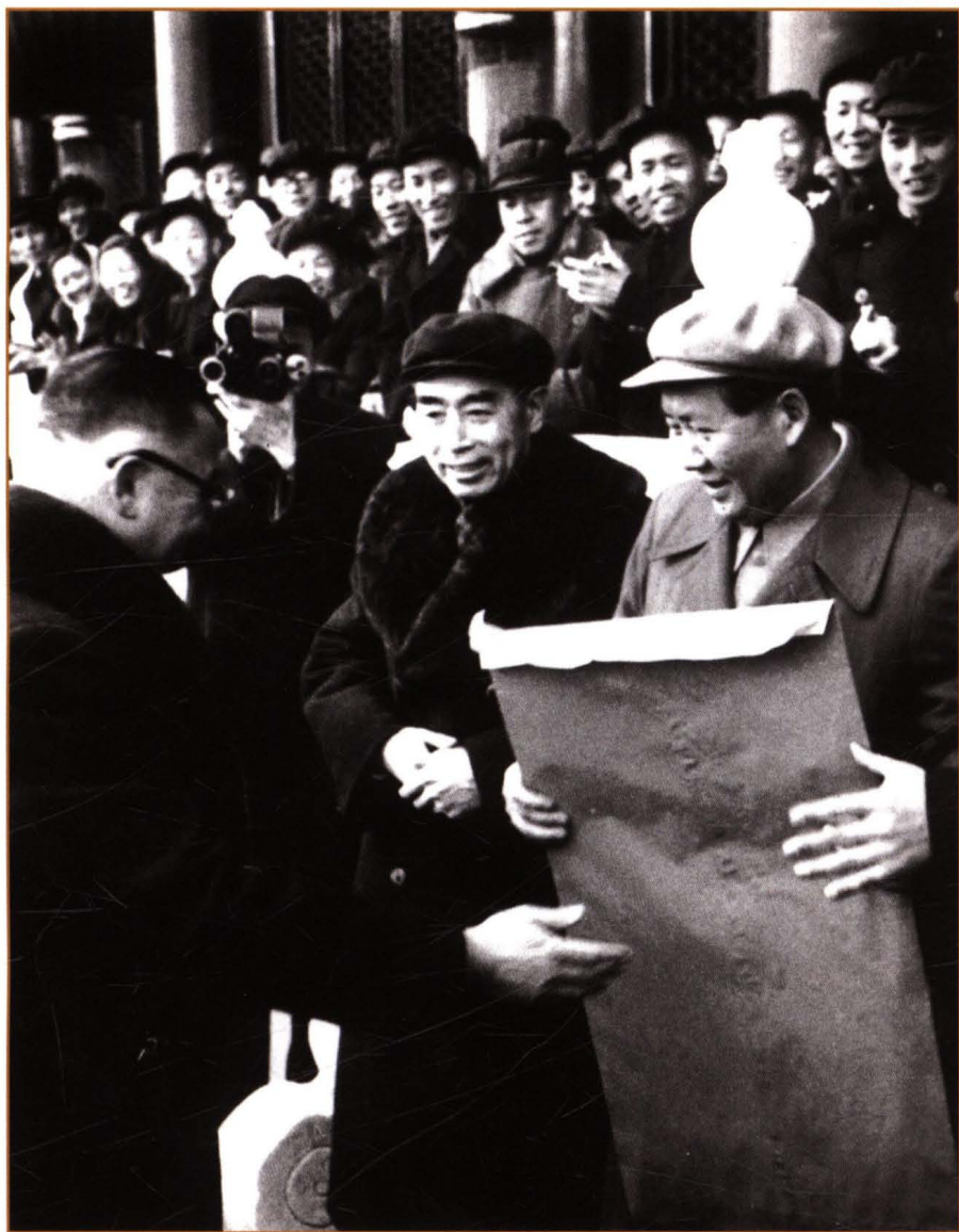
1956年1月15日，首都各界20余万人在天安门广场举行庆祝社会主义改造胜利联欢大会。图为毛泽东主席接受北京市工商联主任委员乐松生（左一）代表北京市工商界敬献的报喜信