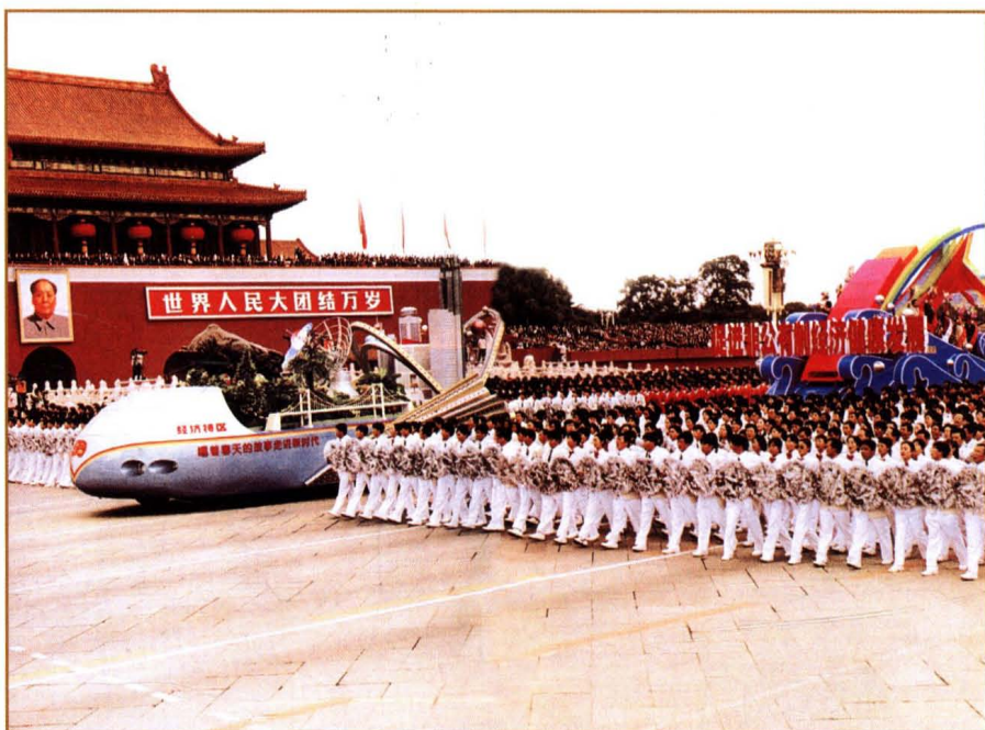
1999年10月1日，在新中国成立50周年国庆大典上，由北京市工商联承办的反映我国非公有制经济健康发展的彩车通过天安门广场，接受党和国家领导人的检阅