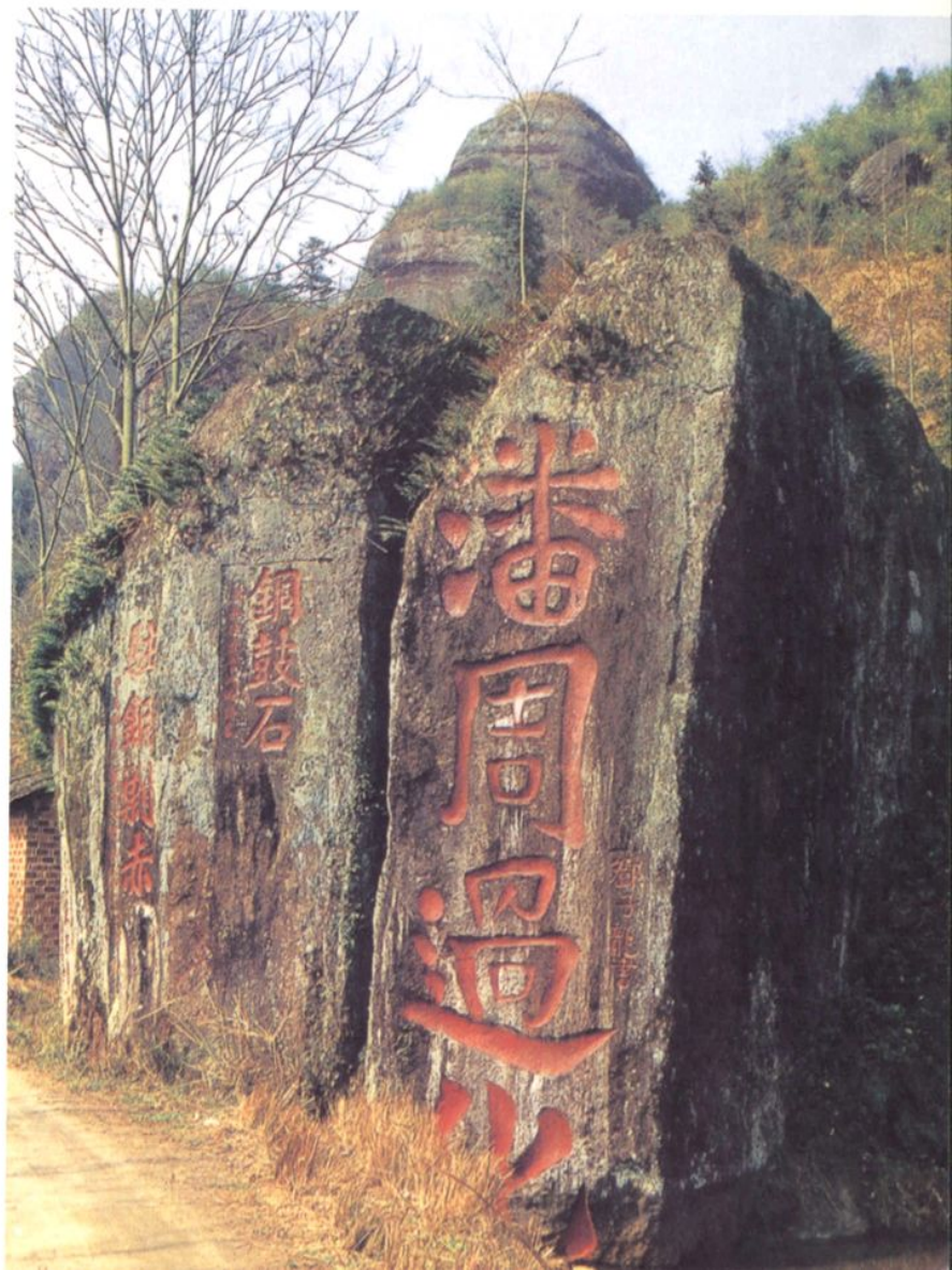
铜鼓石磨崖石刻群