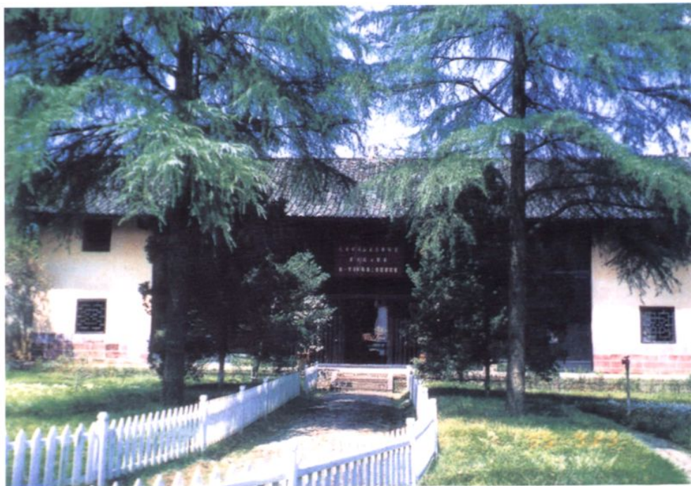
毛泽东同志亲自领导的秋收起义部队第一军第一师第三团团部旧址