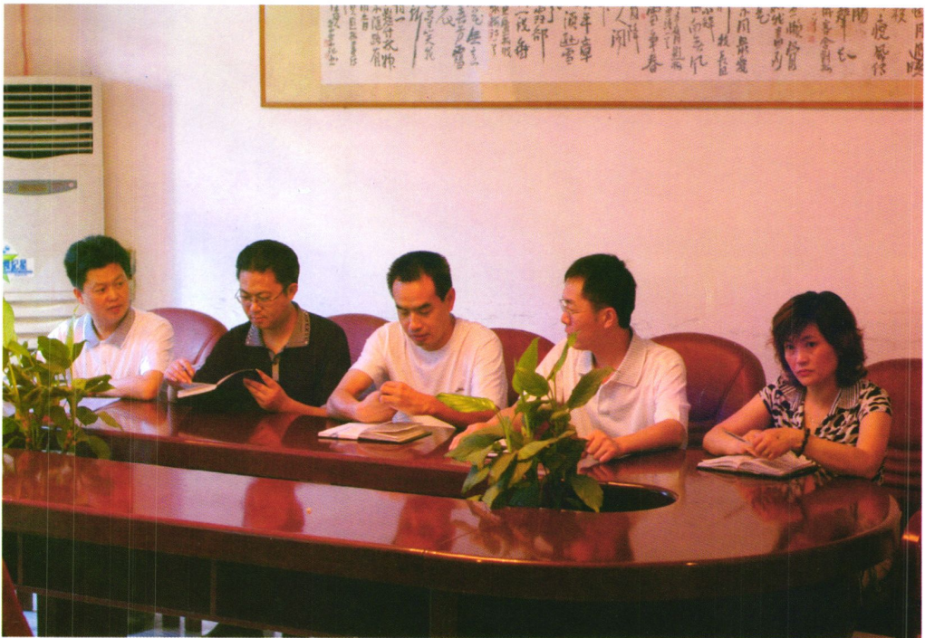
团结奋进领导班子