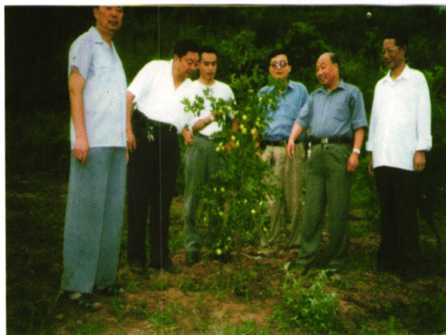
县领导调研经济林发展