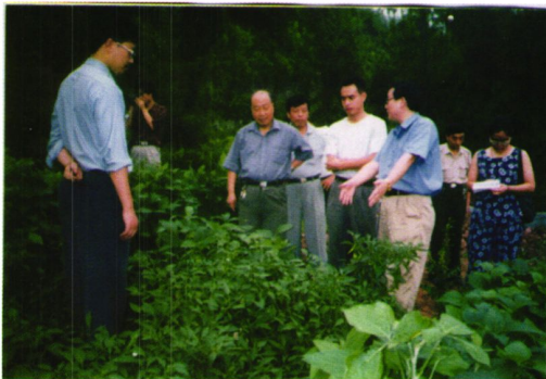
县、局领导调研林业立体开发