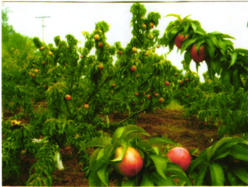
姹紫嫣红（美国油桃）