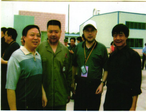
省林业厅长杨冬生（右二）视察林产品企业