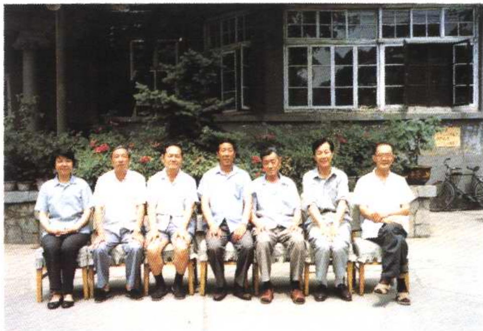
市农林局领导与《天津农林志》主要编纂人员合影