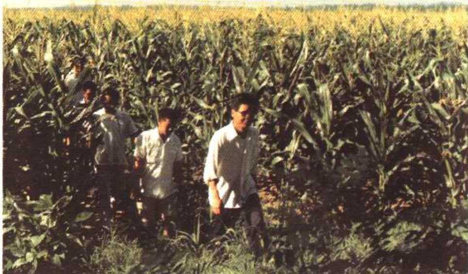
专家考察玉米生产