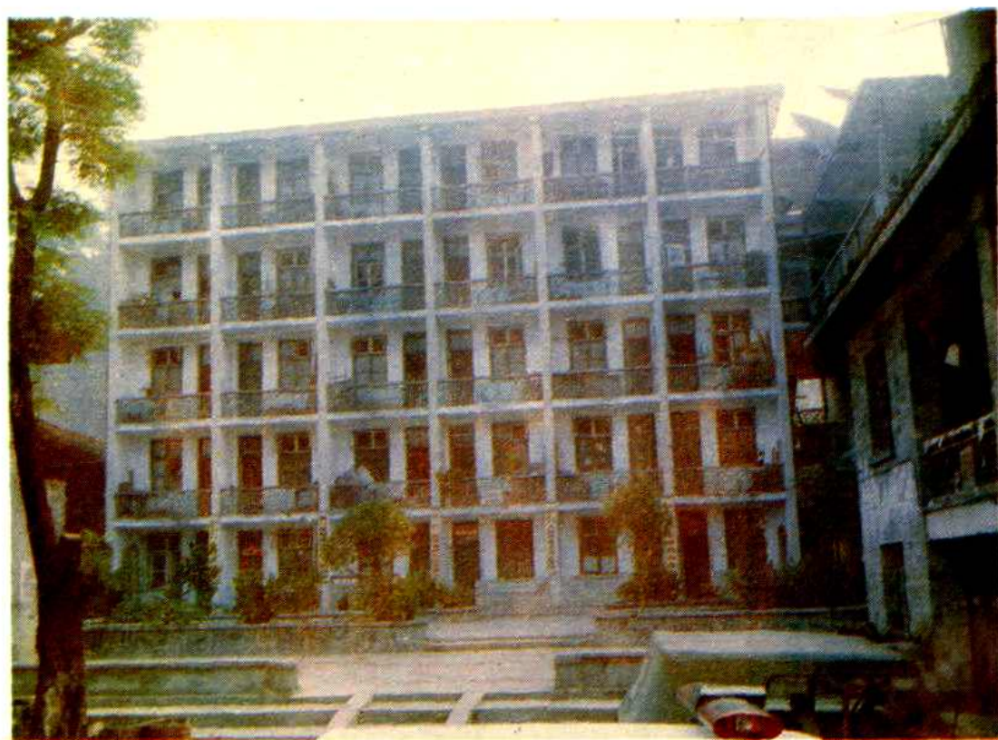
那溪瑶族乡宿舍、办公大楼