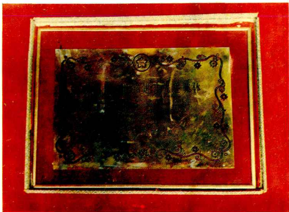
1988年国务院授予莽溪瑶族乡的铜质奖屏