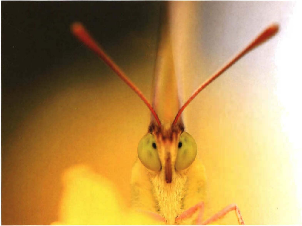
大自然美的精灵——蝴蝶