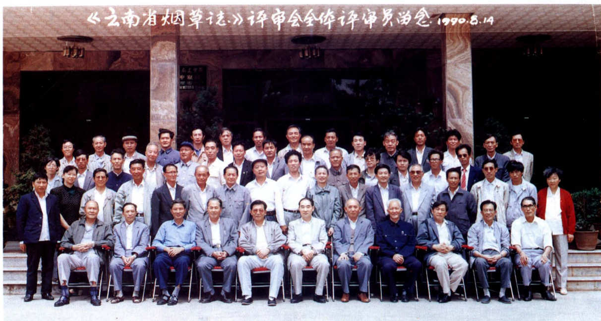
《云南省烟草志》参加评审人员合影