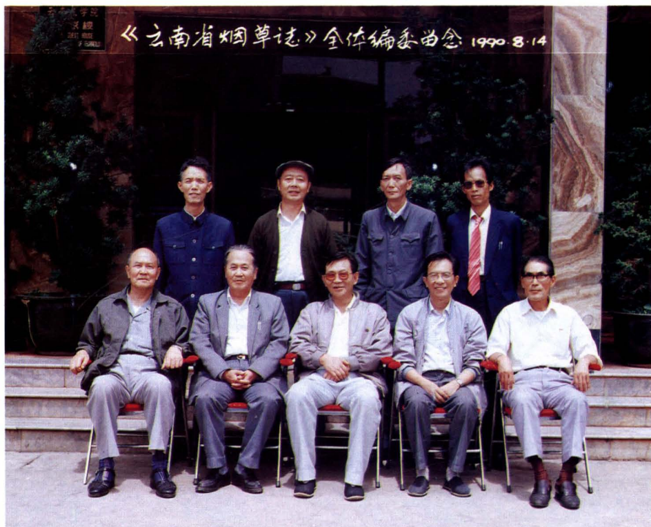
《云南省烟草志》编纂领导小组全体成员合影