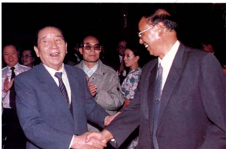
上 国务院副总理朱镕基视察玉溪卷烟厂