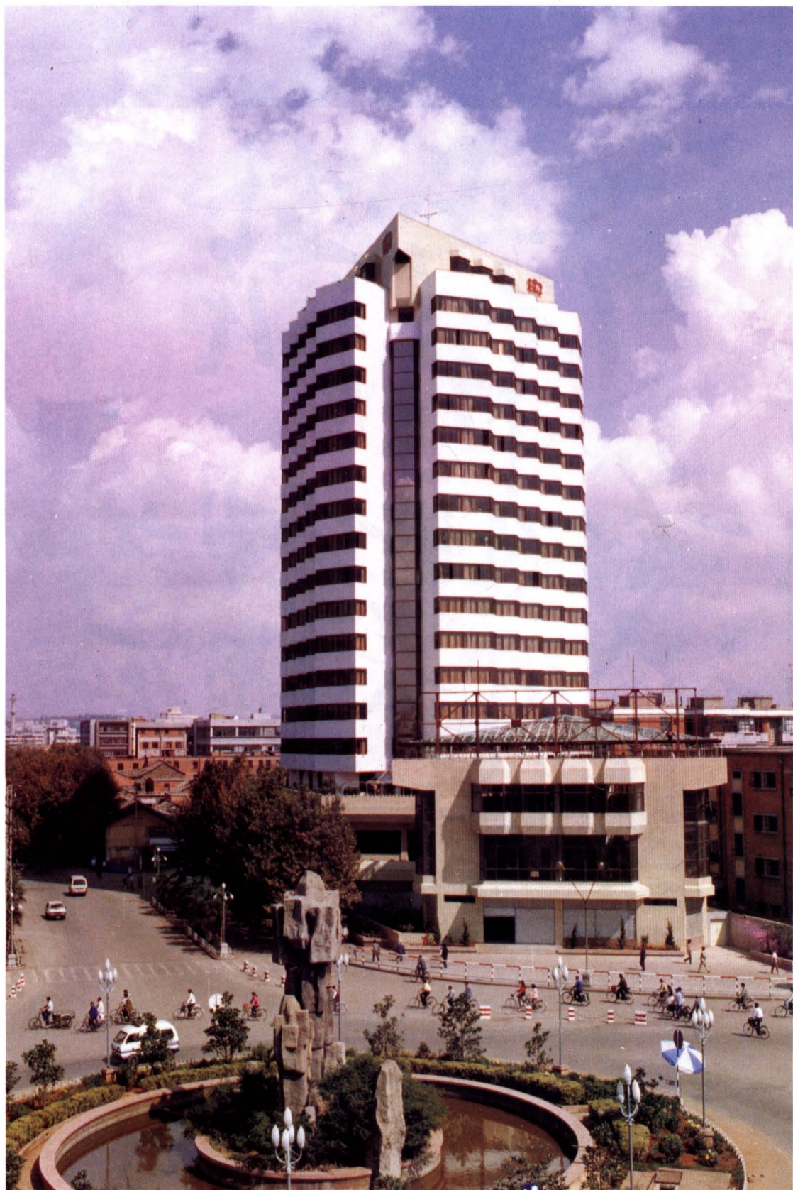
云南省烟草公司办公大楼，地址在昆明市北京路塘子巷口