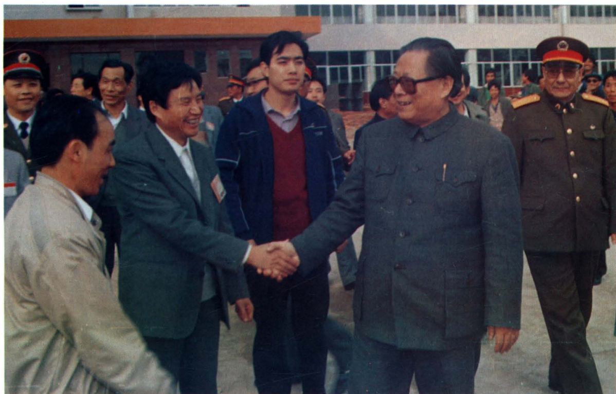
上 中共中央总书记江泽民在中共云南省委书记普朝柱的陪同下视察昆明卷烟厂 下 江泽民总书记同昆明卷烟厂领导陈传柏、张水长等亲切握手