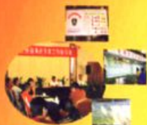
市物价局“价格服务进农家”工作