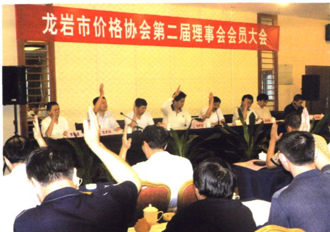
龙岩市价格协会第二届理事会换届选举大会在龙岩召开