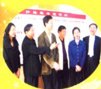
省局调研组深入我市农村，调研“价格服务进农家”开展情况