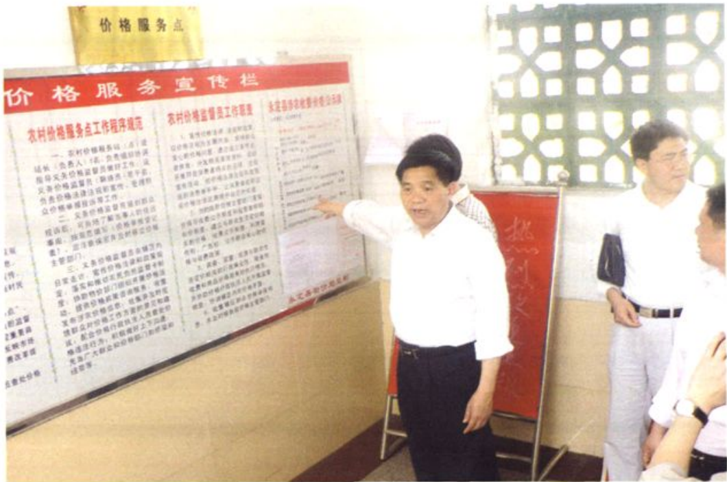
市物价局领导检查价格服务进农家工作