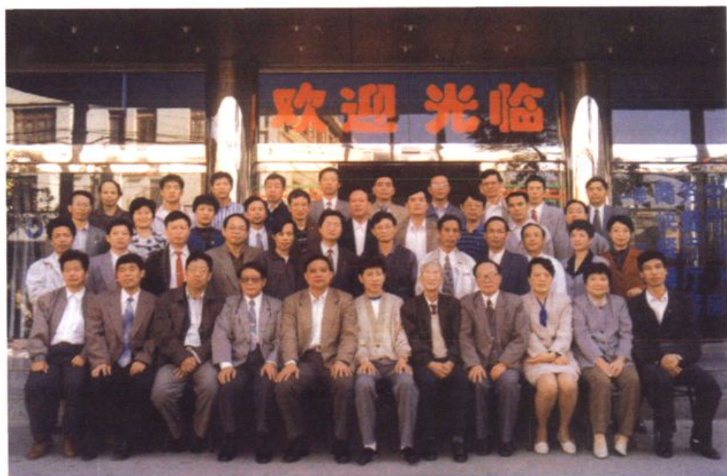
福建省物价工作如何为促进两个根本性转变服务理论研讨会暨学会工作座谈会于1997年11月在龙岩市绿州大酒店举行，图为全体代表合影留念