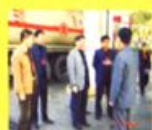
市物价局调研组在市物价局会议室召开座谈会