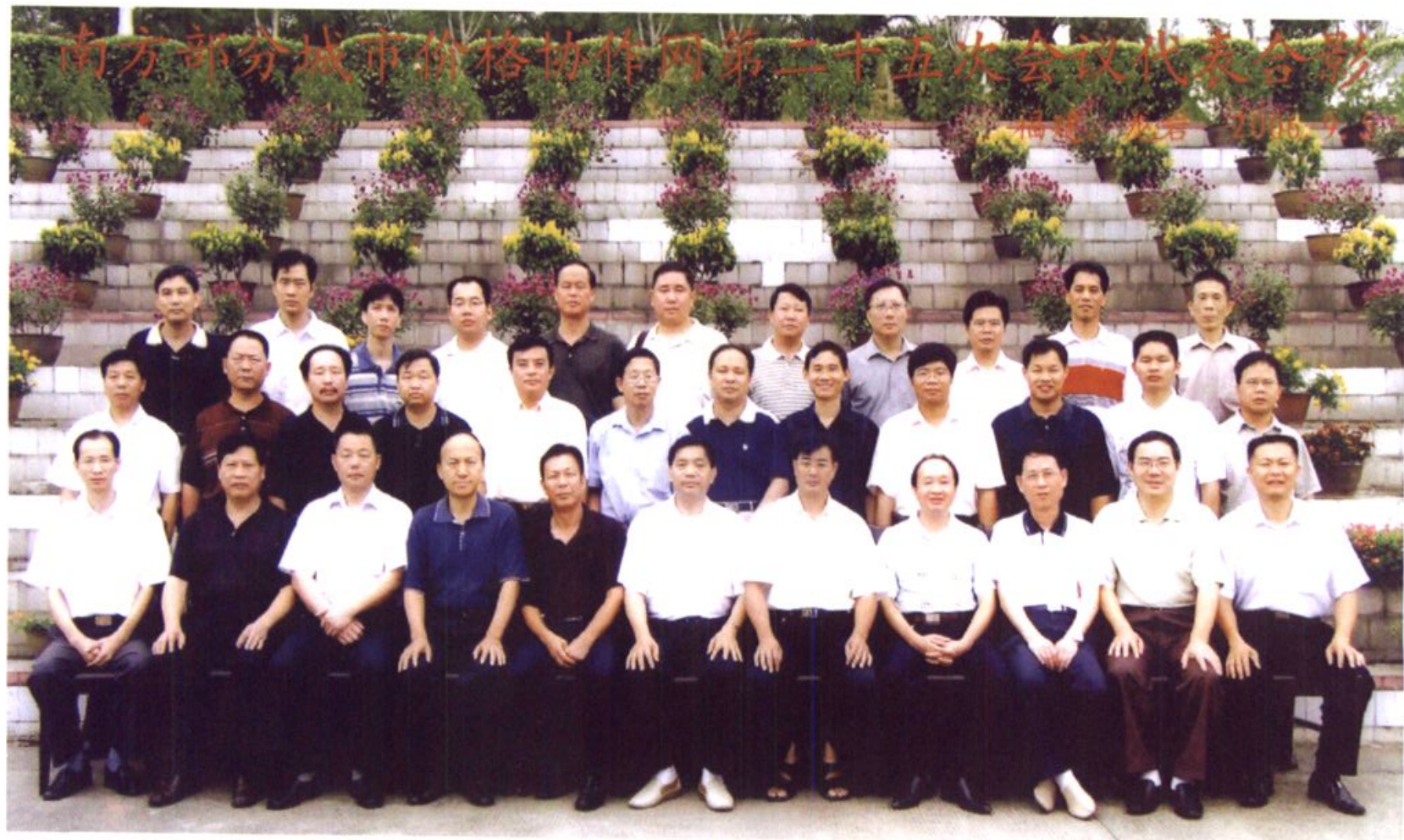
南方部分城市价格协作网第二十五次会议于2006年9月在龙岩市戎辉楼举行，图为全体代表合影留念