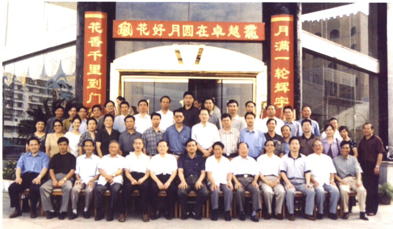
参加加入WTO对福建省市场价格的影响与对策研讨人员与全体代表合影留念