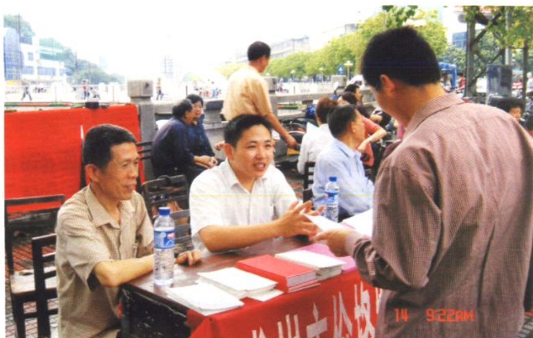
市价格协会组织开展价格法律、法规的宣传咨询活动