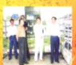
市物价局调研组在市物价局会议室召开座谈会