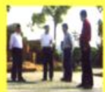
市物价局调研组在市物价局会议室召开座谈会