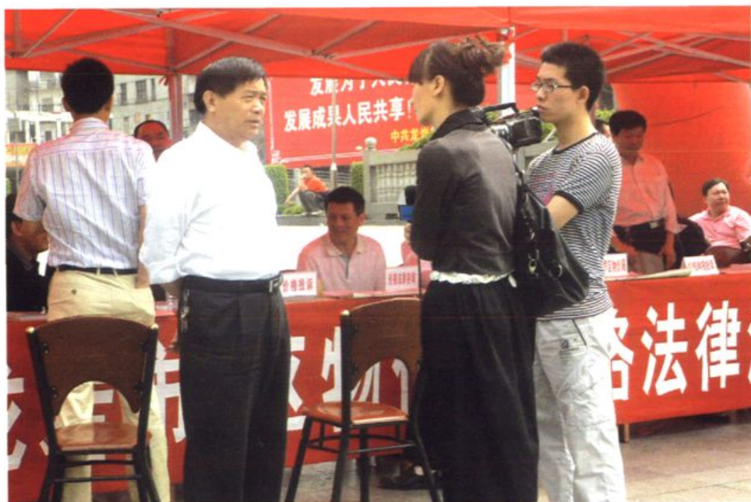
市物价局领导接受电视台记者专题采访