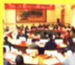
市物价局调研组在市物价局会议室召开座谈会