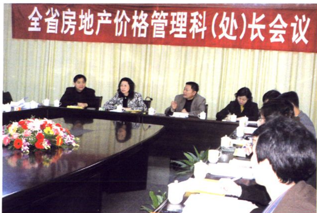
全省房地产价格管理科(处)长会议在龙岩市召开