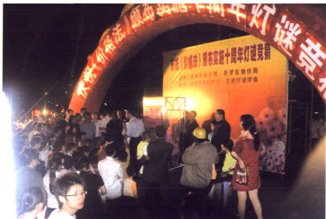
市价格协与市灯谜学会在龙岩街心广场举办庆祝《价格法》颁布实施十周年灯谜竞猜晚会