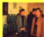
市“红调基金”工作组到连城物价局进行调研