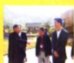
市物价局调研组在市物价局会议室召开座谈会