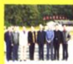
市物价局调研组在市物价局会议室召开座谈会