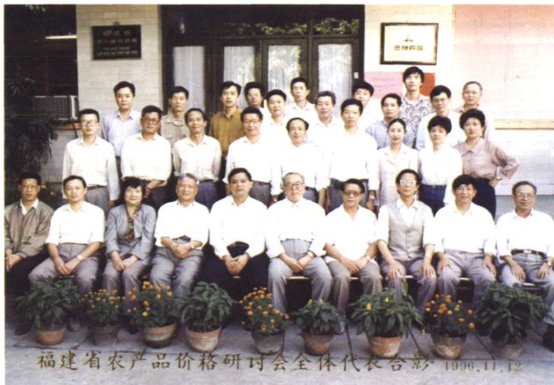
1996年福建省农产品价格研讨会全体代表合影留念