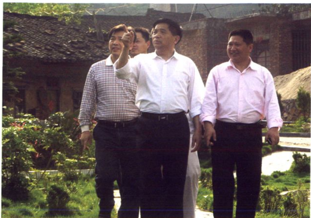
市物价局领导深入农村指导价格服务进农家工作