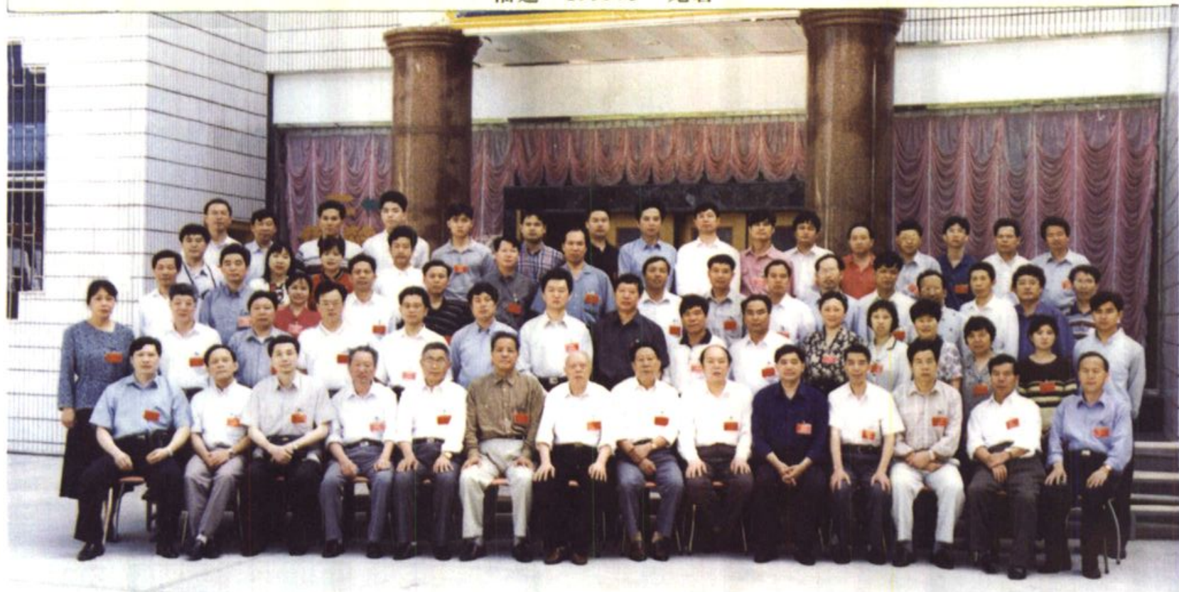
南方部分城市价格协作网第十四次会议于1999年5月在龙岩市邮电度假村举行， 图为全体代表合影留念