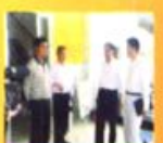
市物价局调研组在市物价局会议室召开座谈会