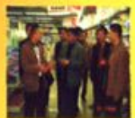
市物价局调研组在市物价局会议室召开座谈会