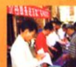
市物价局调研组在市物价局会议室召开座谈会