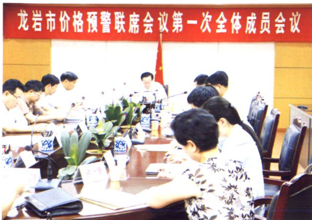
市政府首次主持召开龙岩市价格预警联席会议