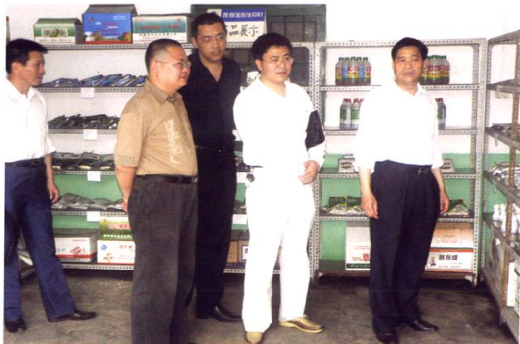
市、区两级物价部门联合开展农资价格检查