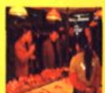
市物价局调研组在市物价局会议室召开座谈会