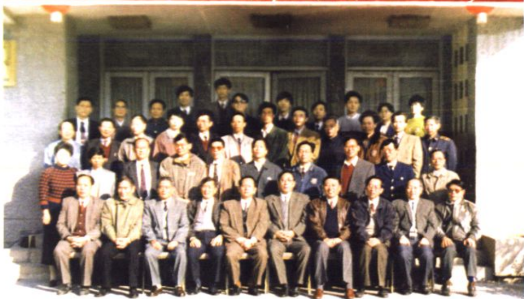
1995年福建省加强宏观调控抑制通货膨胀研讨会全体代表合影留念