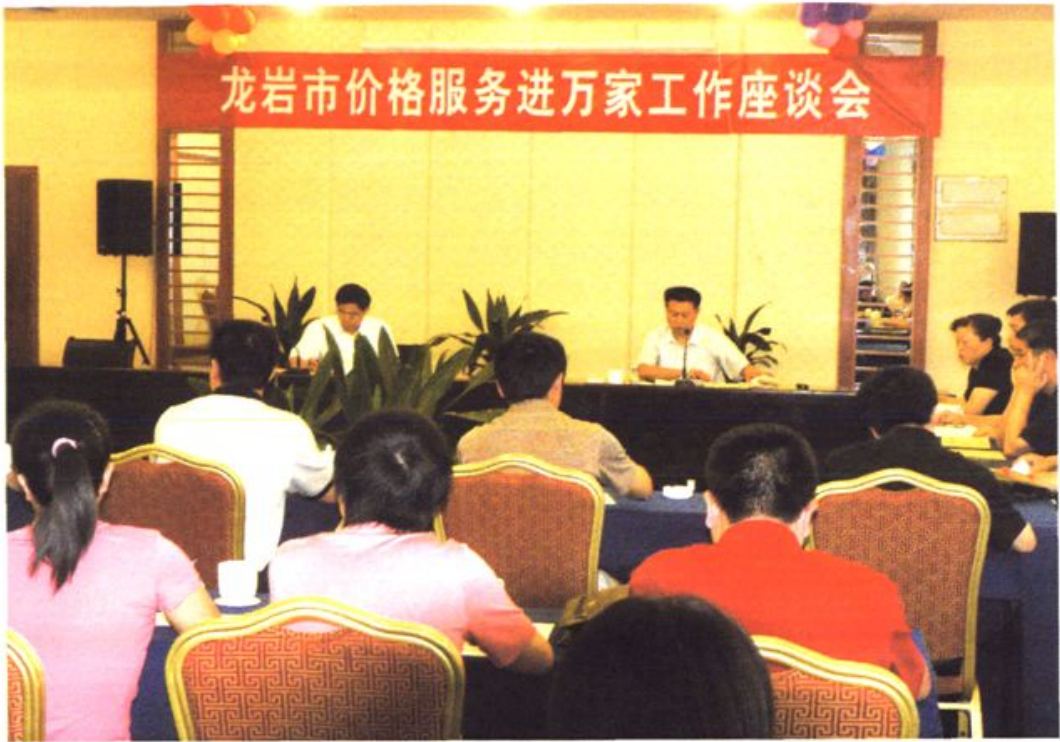
市物价局召开价格服务进万家工作座谈会