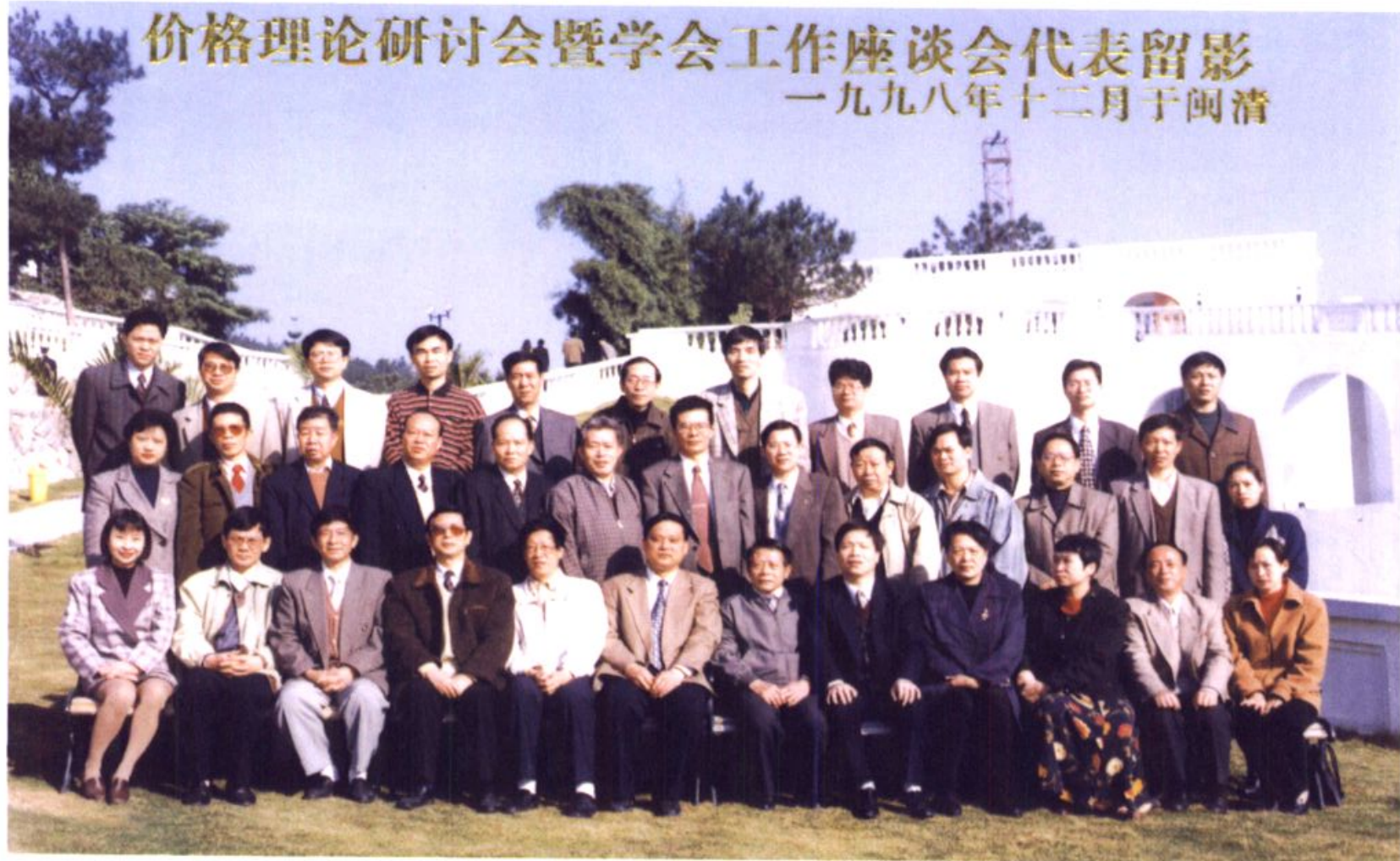
福建省1998年价格理论研讨会全体代表合影留念