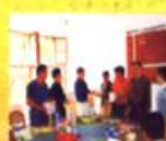
市物价局调研组在市物价局会议室召开座谈会