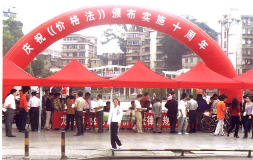
市、区物价局在龙岩街心广场组织人员开展价格法律、法规宣传和咨询活动