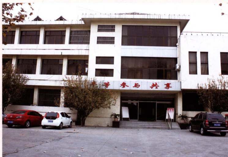
博兴县残疾人综合服务中心