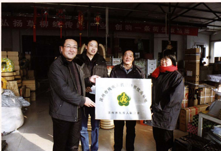
县残联为残疾人 就业扶贫基地授牌