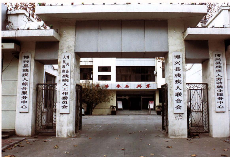
博兴县残疾人联合会大门