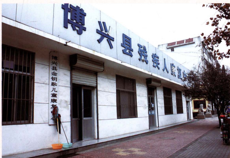
博兴县残疾人康复中心