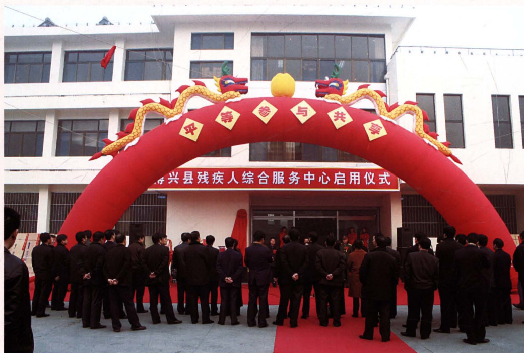
2006年9月，县残疾人综合服务中心启用