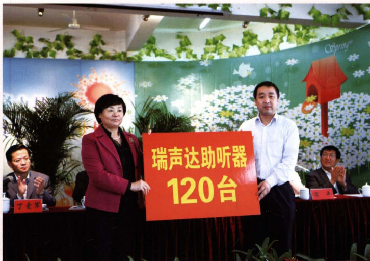
滨州市残联向博兴特校捐赠助听器