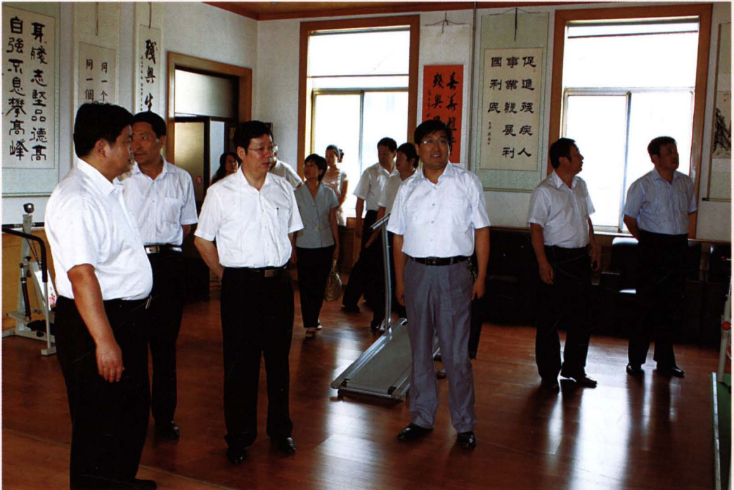
2009年8月，滨州市副市长张兆宏（左三）在县残疾人康复指导中心指导工作