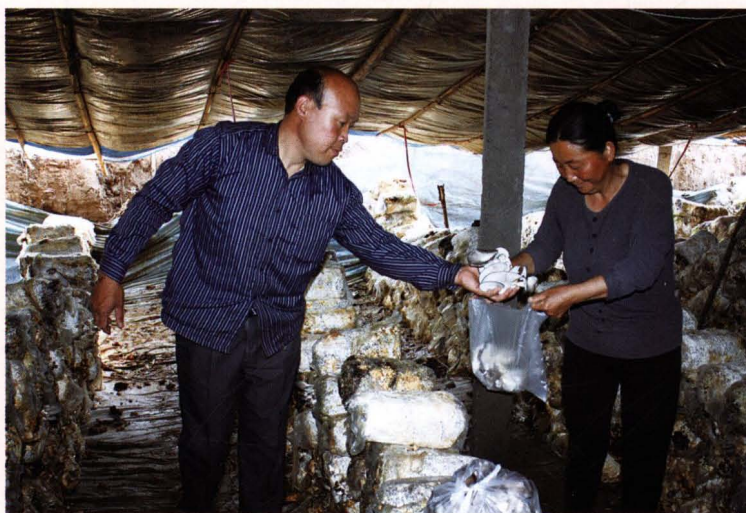
残疾人自主创业 蘑菇养殖大棚