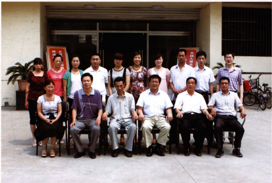
2010年7月，县残联全体干部职工合影