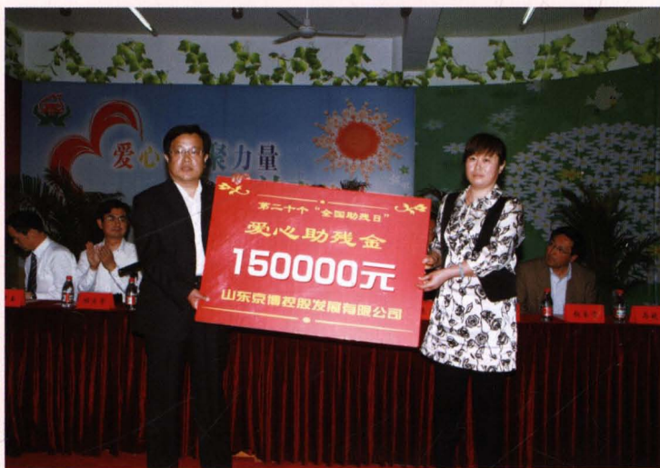
山东京博控股向县特校捐赠助残金