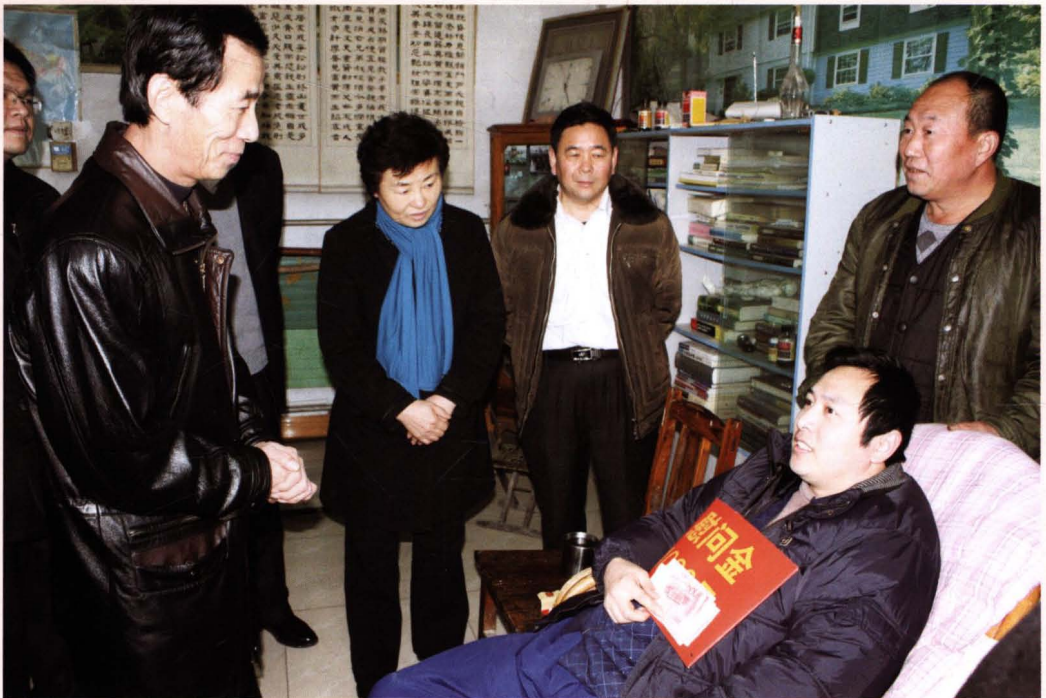
2010年1月，省残联副理事长乔贵良（左一）慰问贫困残疾人