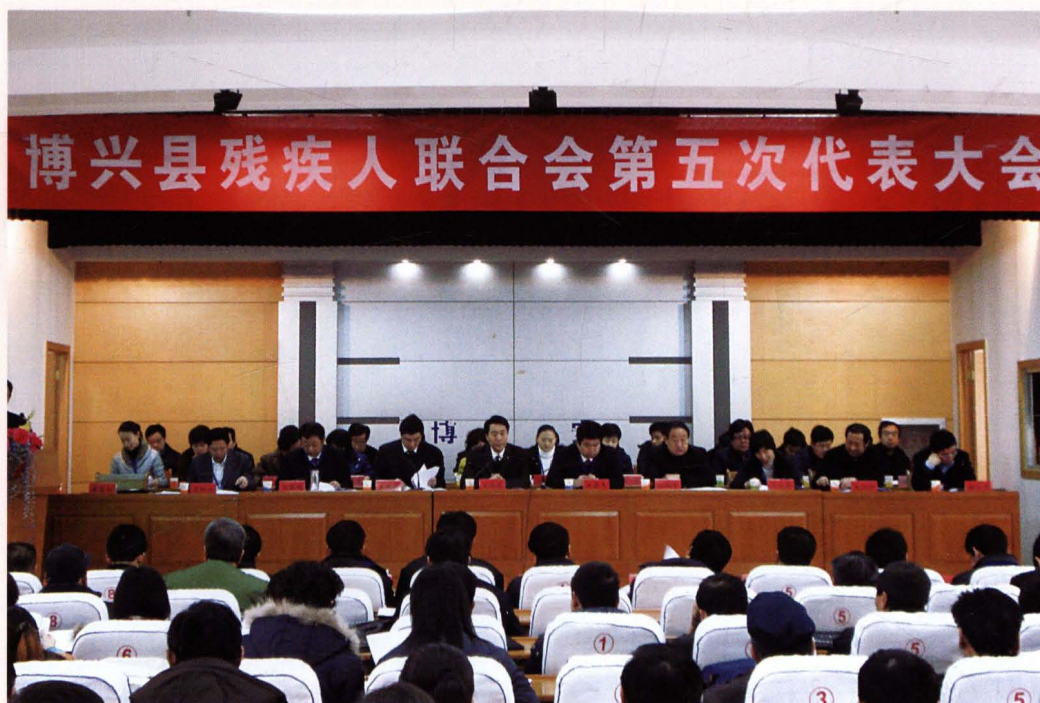
2008年1月，第五次代表大会会场