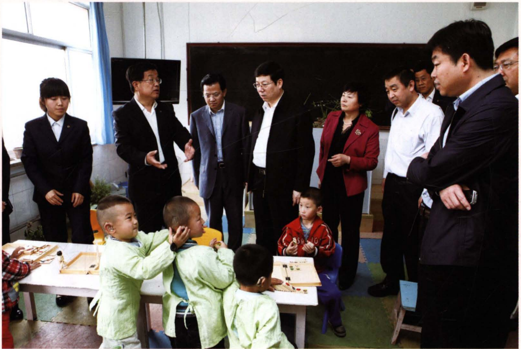
2012年5月，滨州市副市长张兆宏（左四）在博兴县特校指导工作