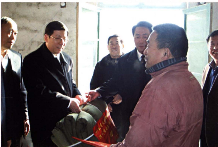
2007年，滨州市副市长张兆宏（左二）走访慰问残疾人