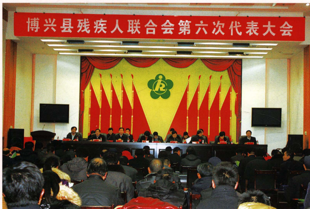
2010年12月，第六次代表大会会场