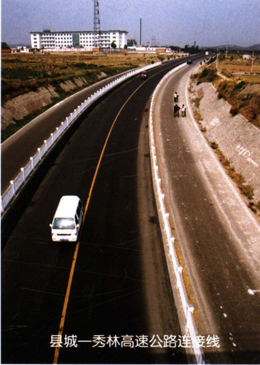
县城—秀林高速公路连接线