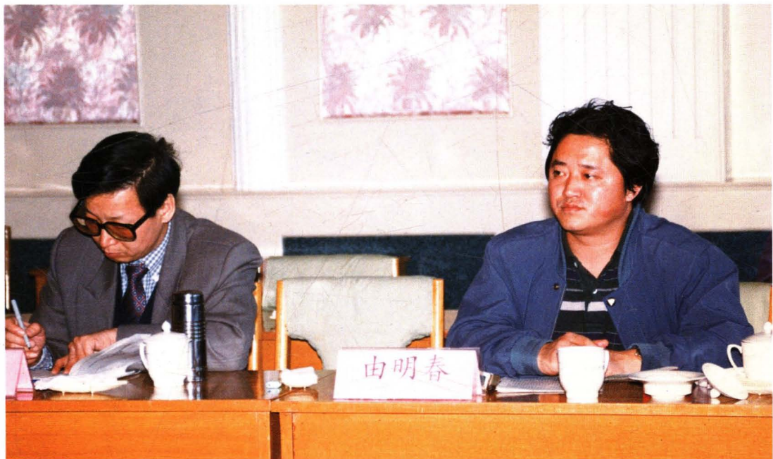
△河北省财政厅厅长齐守印(左)到井陘视察财政工作