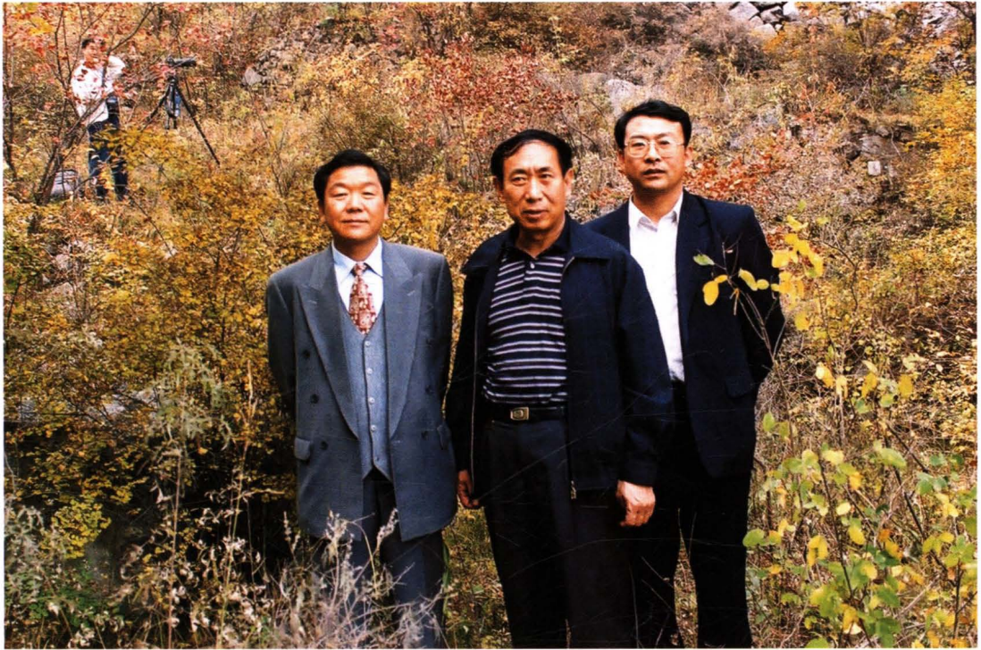
△河北省人大常委会副主任王加林(中)到井陘视察财政工作