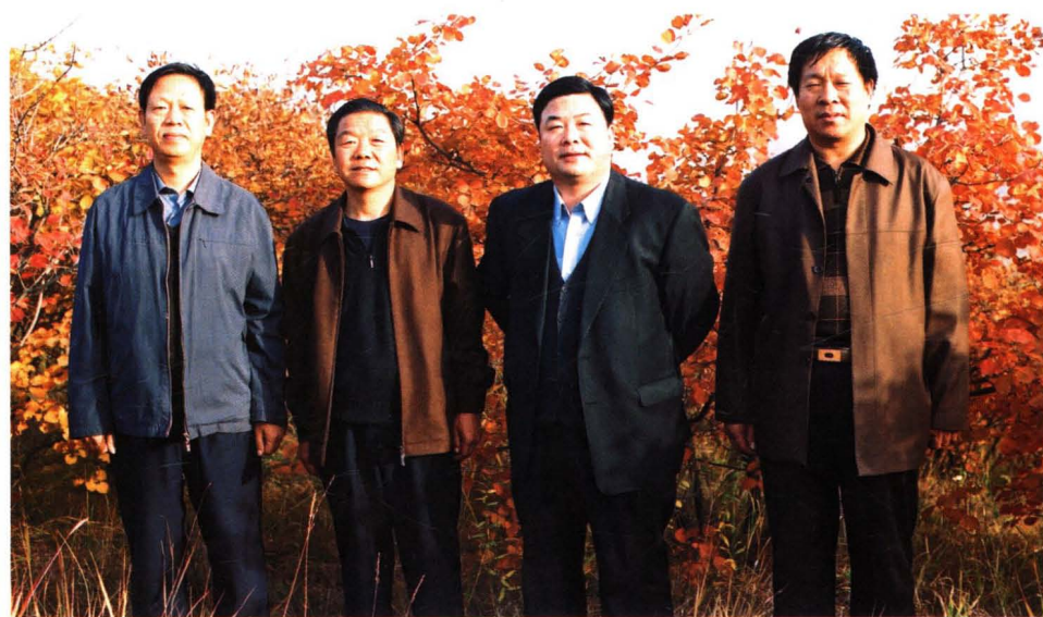
△井陘县委书记庞彦须(右二)率财政、水利、林业部门调研税费改革工作