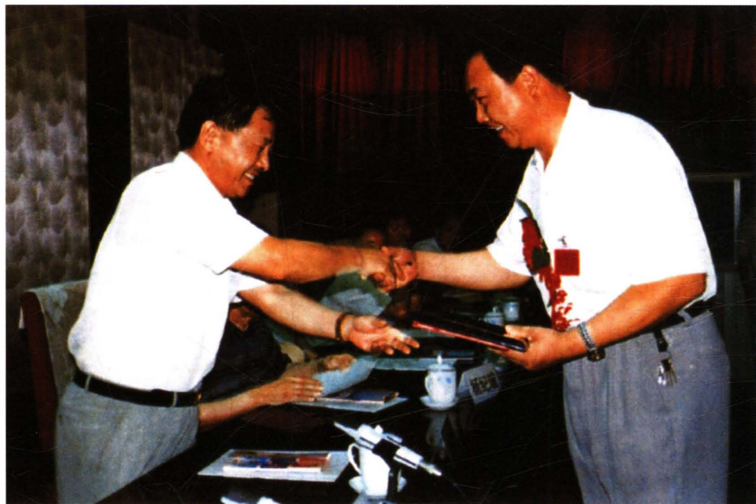
△ 财政部副部长张佑才(左)向井陉县财政局颁发“十佳办学单位”荣誉证书