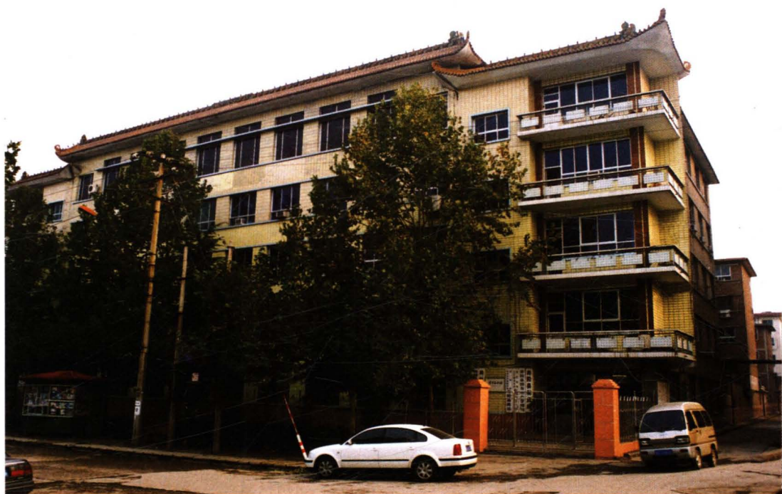
△ 井陘县财政局办公大楼