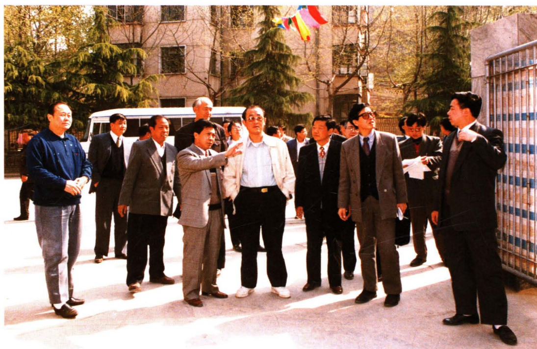
△ 财政部副部长高强(前左四)到井陉视察“九六·八”洪灾恢复重建工作