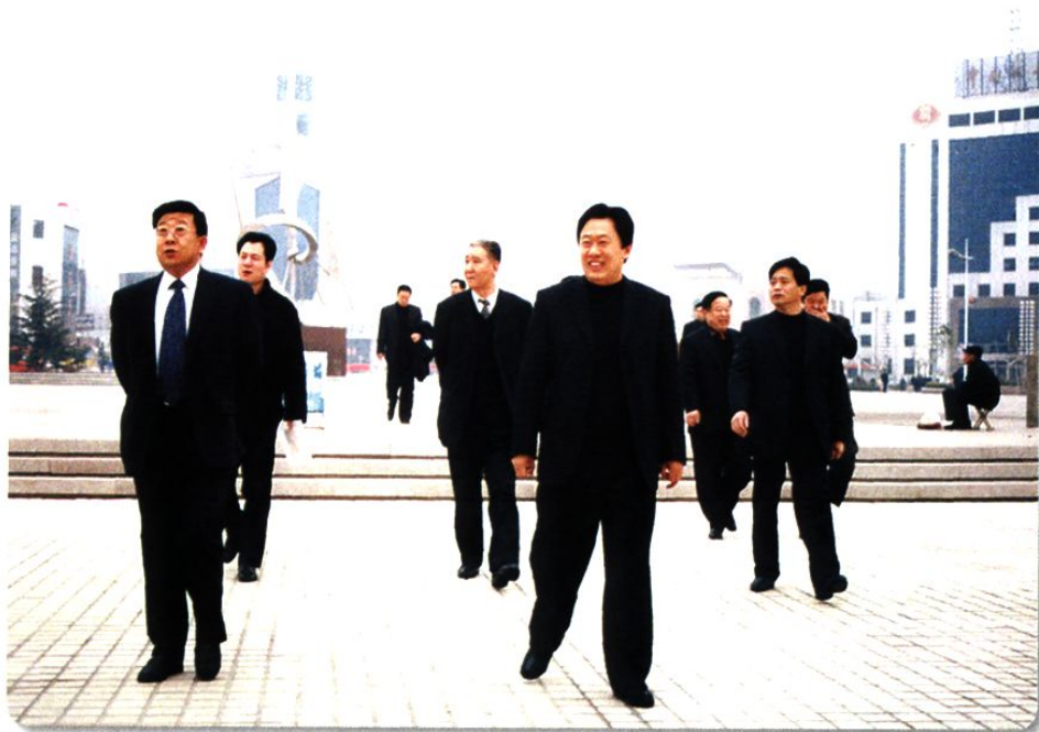
2004年2月，副省长赵克志（左一）在月湖广场视察城市建设