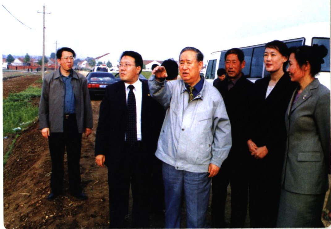
2003年，第九届全国人大常委会副委员长姜春云视察莱西市建设情况