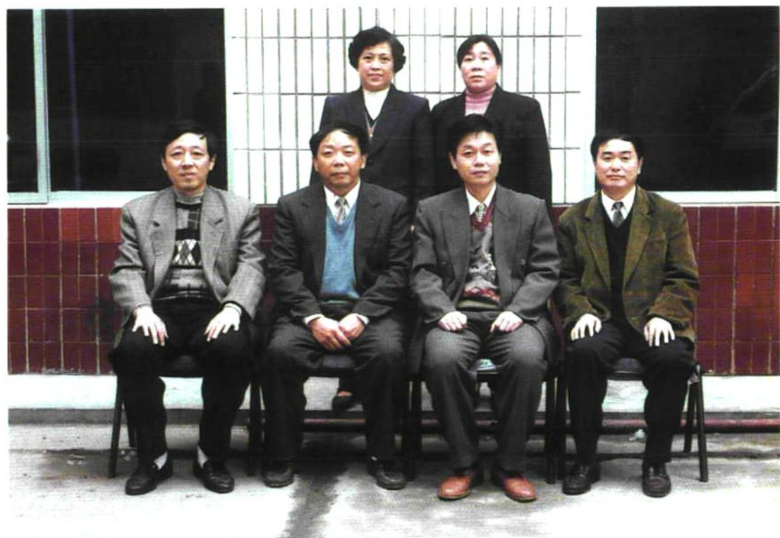
● 办事处党工委委员