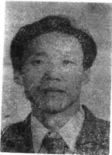
中共伊盟盟委统战部副部长