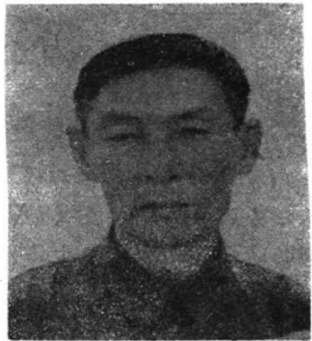
中共伊盟盟委统战部部长