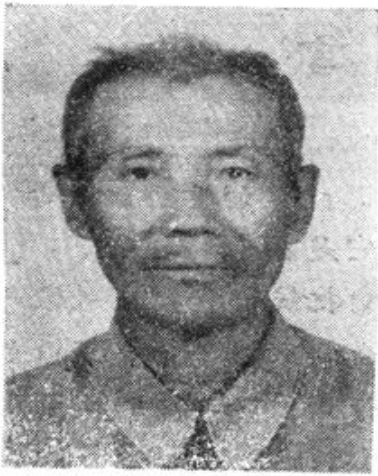
中共伊盟盟委统战部副部长、顾问