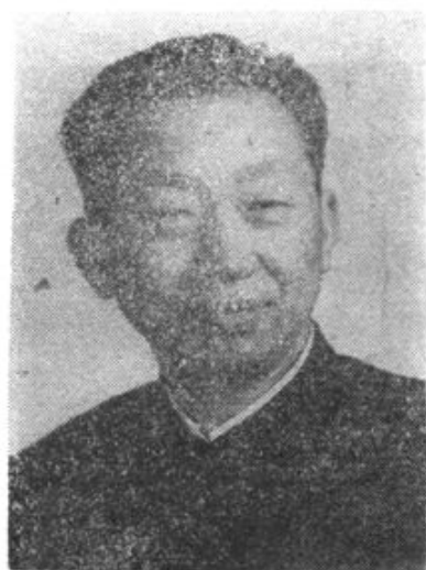
中共伊盟盟委统战部副部长