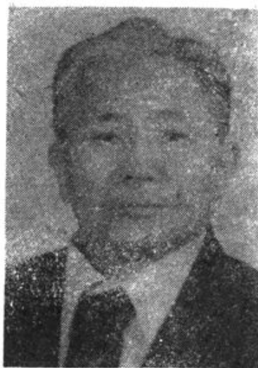
中共伊盟盟委统战部副部长 中共伊盟盟委统战部副部长、部长