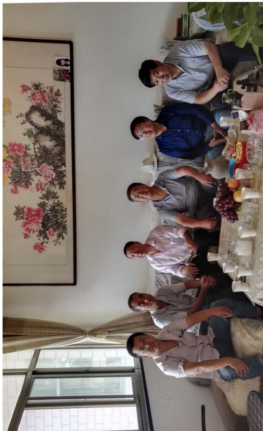
漆子扬教授与编委成