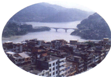
1989年建成的水口新镇