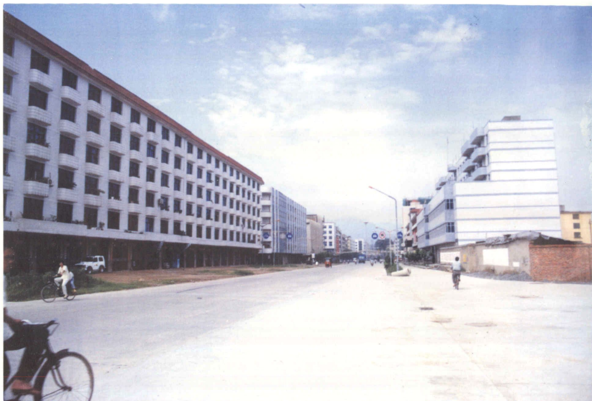
1988年5月成立的县级城东开发区规划面积33.53公顷