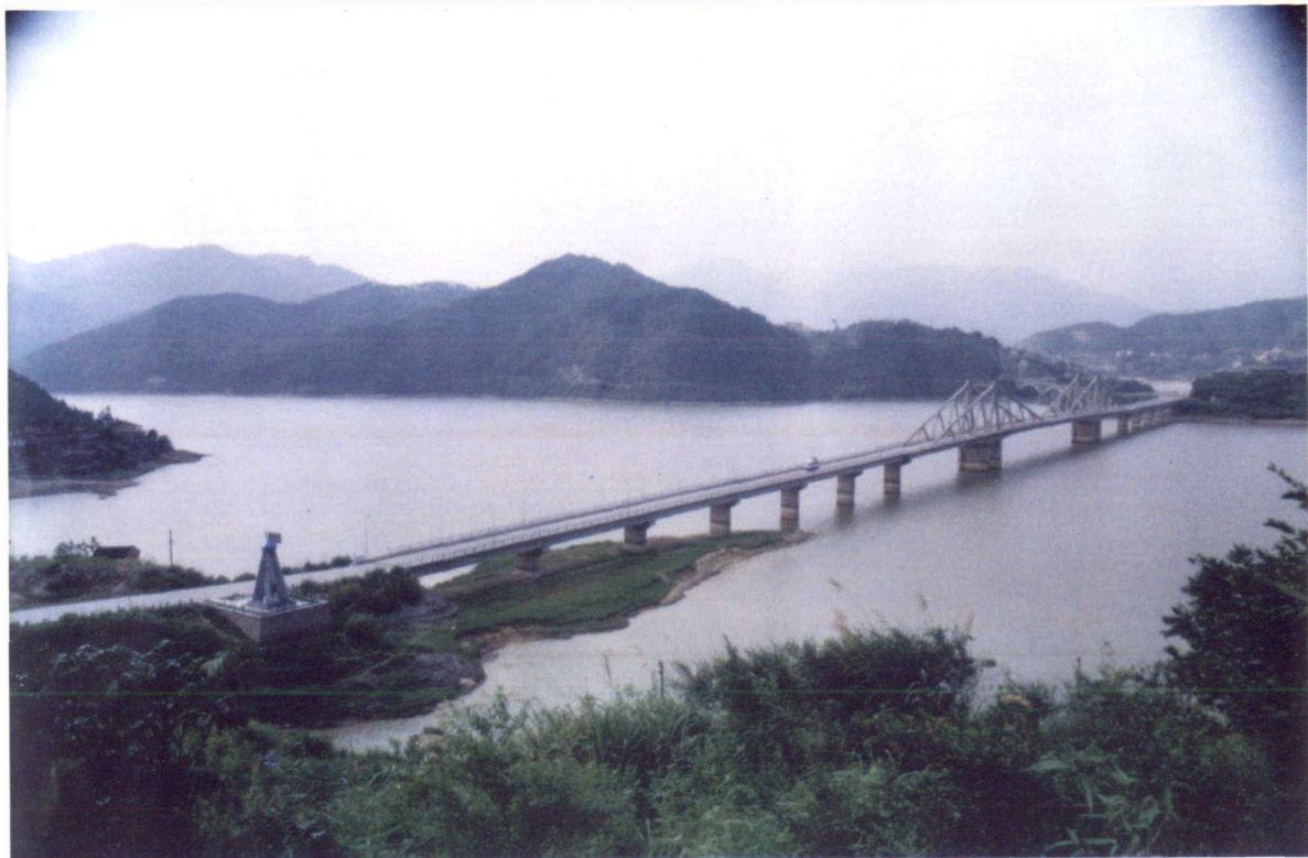
连接国道通往省城和新开发区的交通枢纽——水口大桥