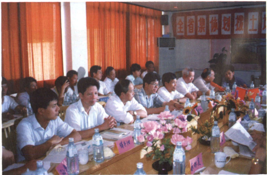
全省集体划拨土地进入市场专题研讨会在古田召开