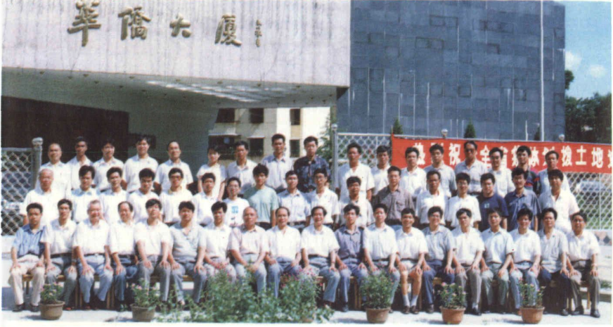
福建省集体划拨土地进入市场专题研讨会留影 95.8.10 于古田