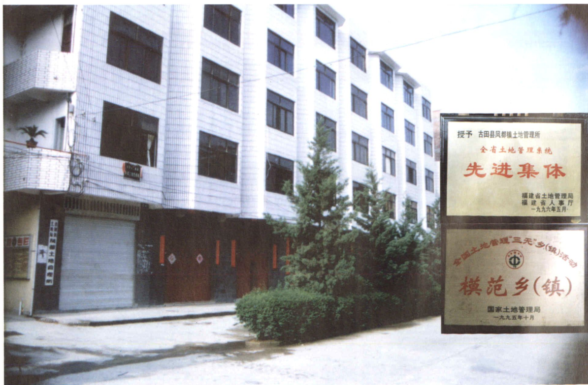
荣获国家局荣誉称号的凤都土地管理所