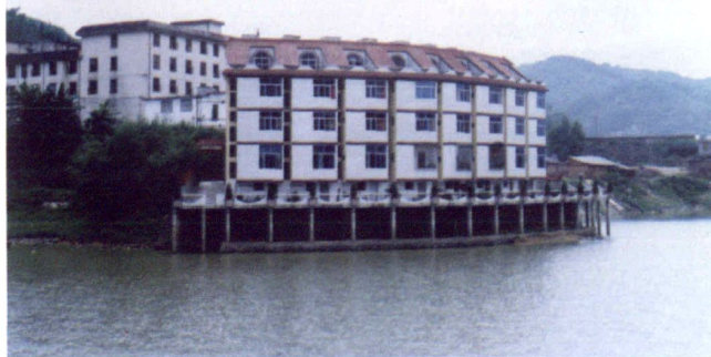
依山傍水合理利用土地