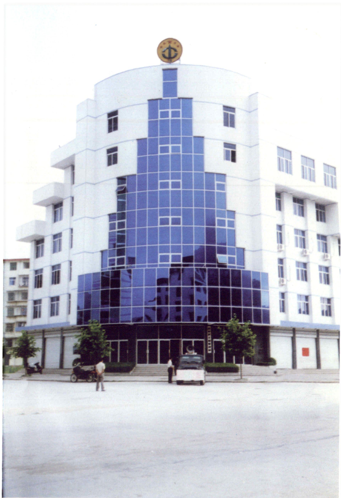
新建县土地局办公大楼