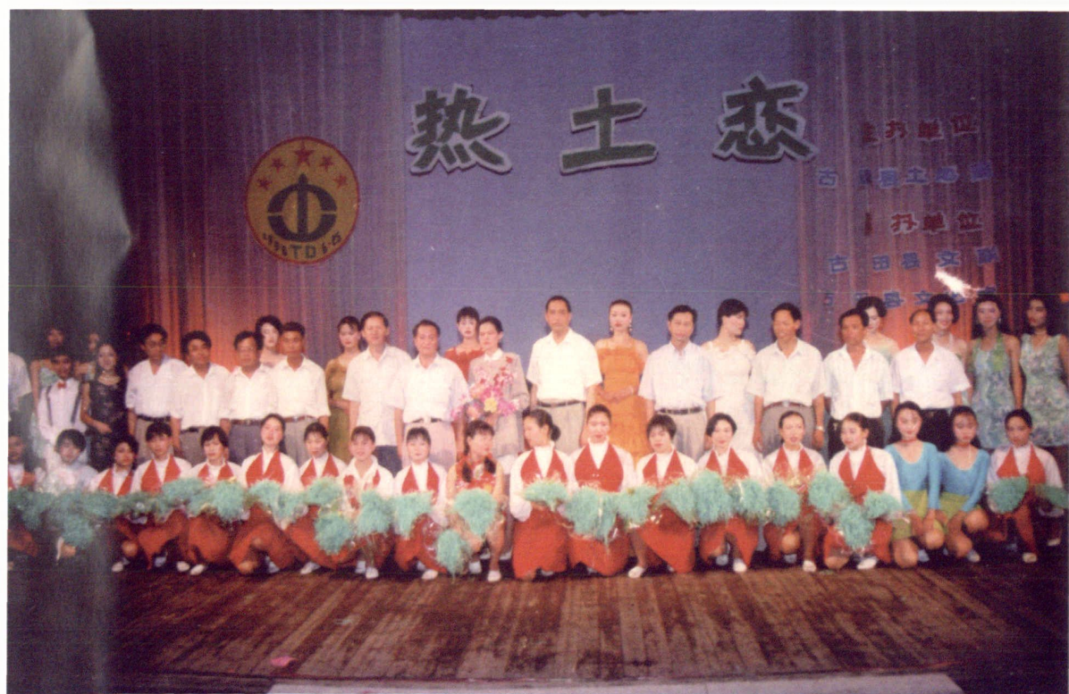
纪念“6.25”土地日大型文艺晚会