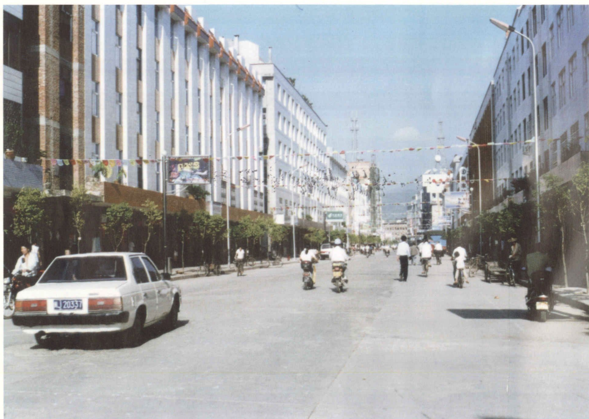
地改促城改、旧城换新貌