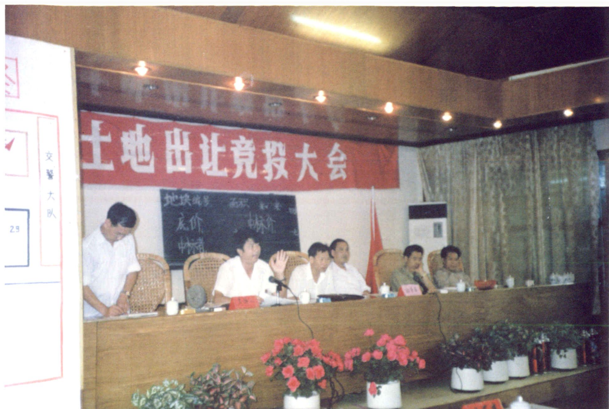
1988年全省县级最早出让土地试点竞投大会会场