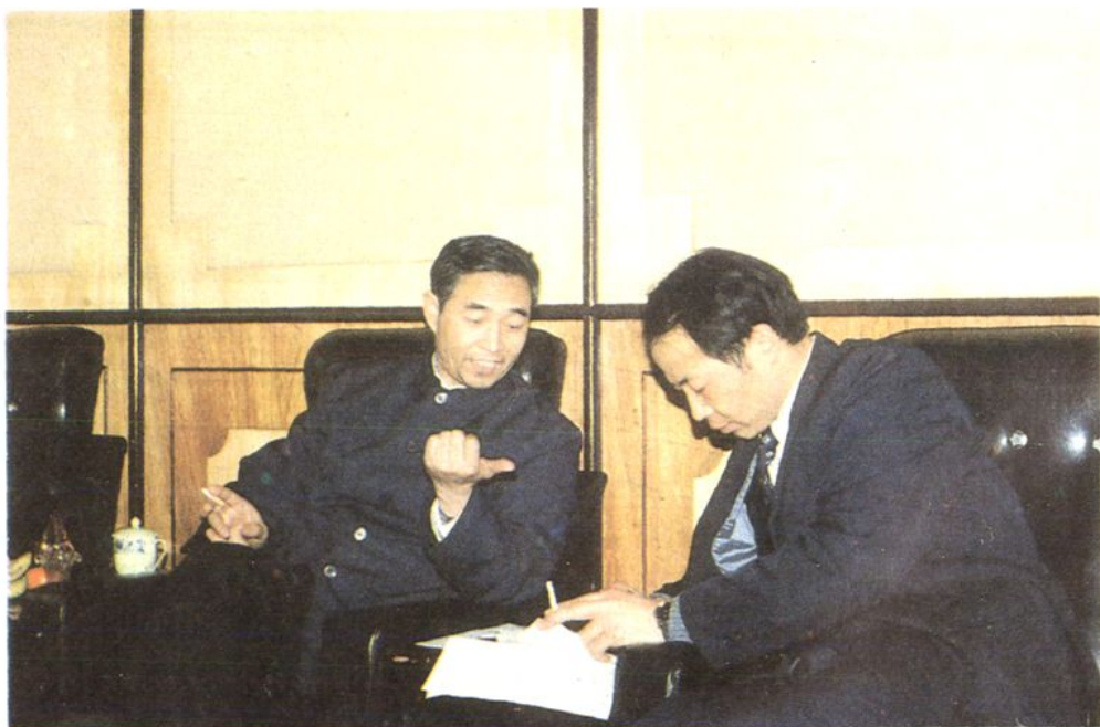
石家庄市档案局领导来井陘县人民银行验收档案升级工作(一九九〇·十二·廿六)