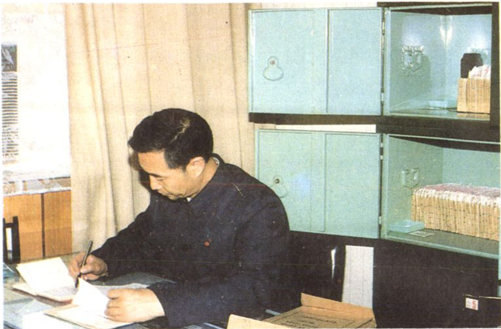
石家庄市档案局领导来井陘县人民银行验收档案升级工作(一九九〇·十二·二十六)