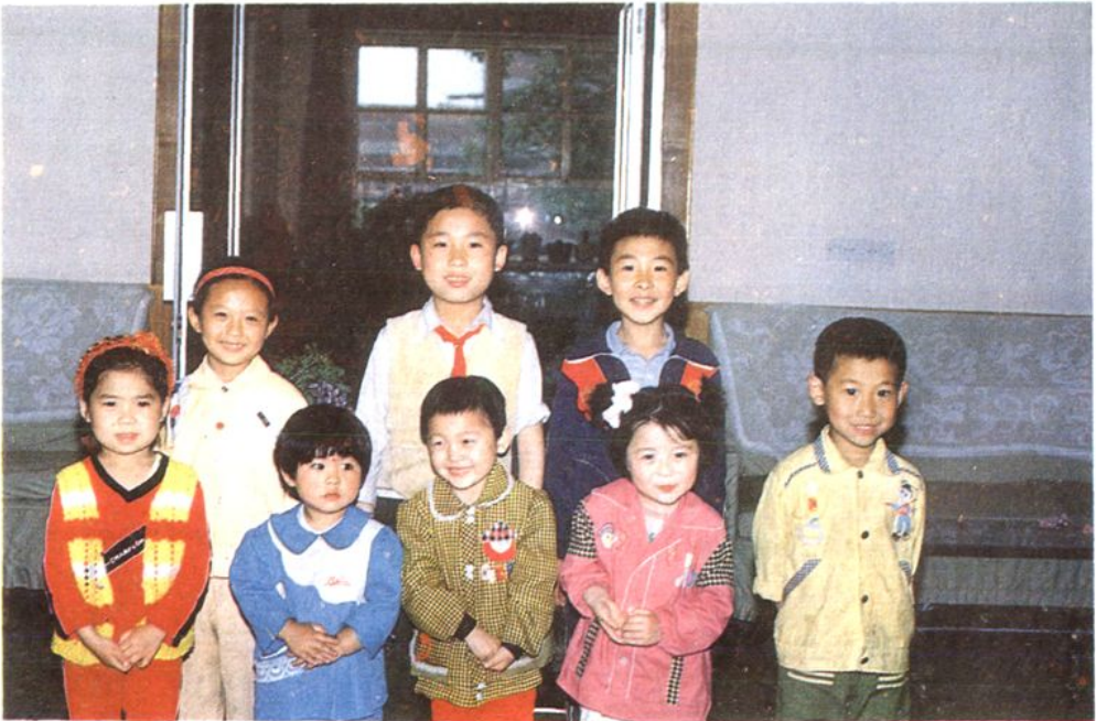
一九九〇年六一儿童节