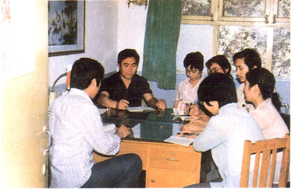
行 务 会 议