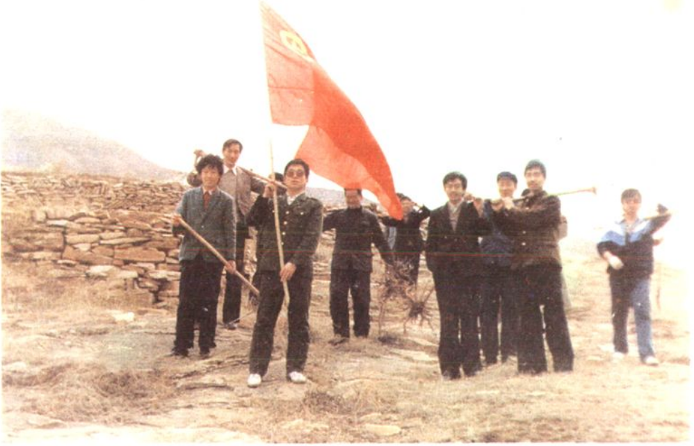
人行团支部组织团员青年赴湖家滩植树