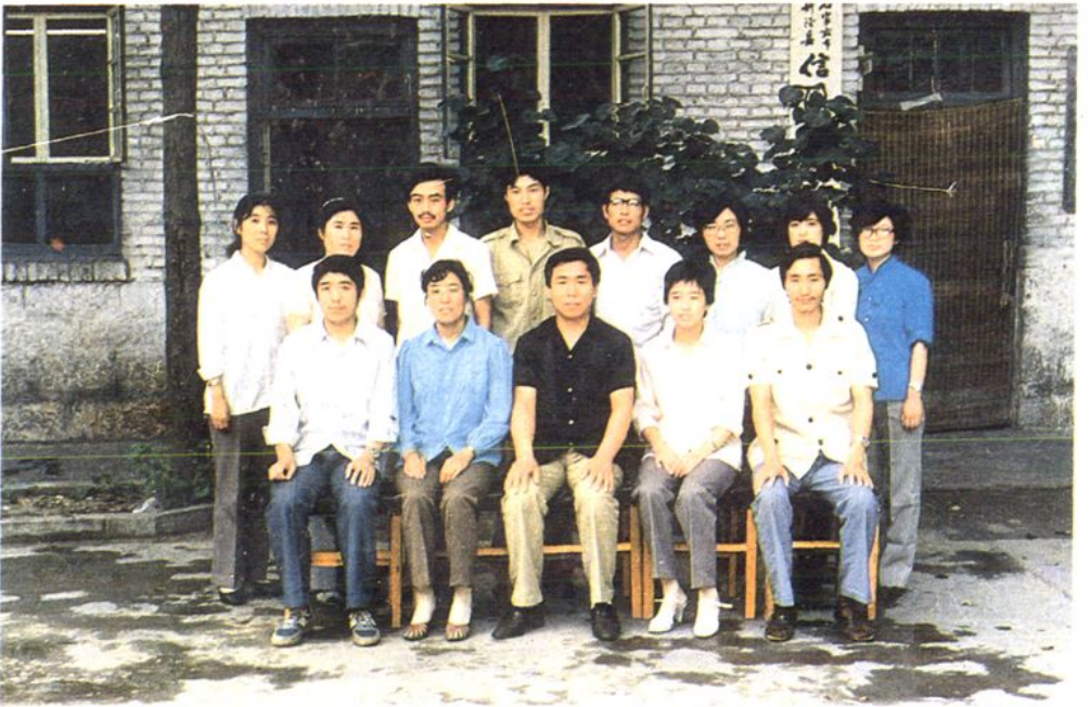
一九八六年恢复井陘县人民银行的全体人员