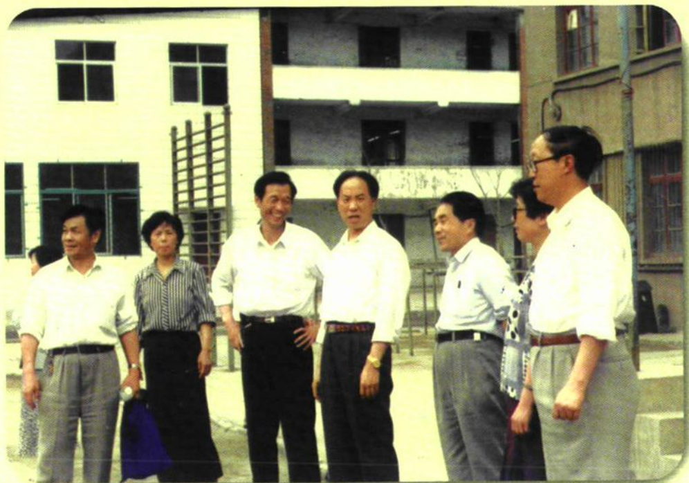
前任副市长刘振中、市教委主任任中央来校指导专业技能竞赛