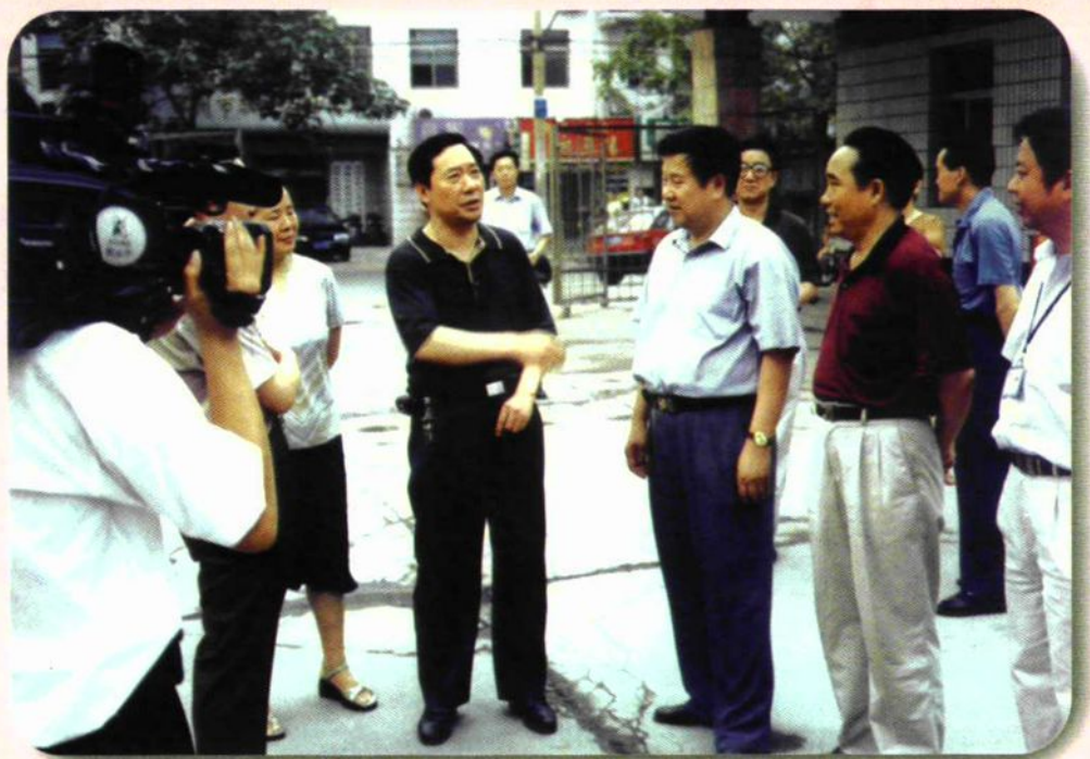
现任郑州市教育局司福亭局长来校检查工作