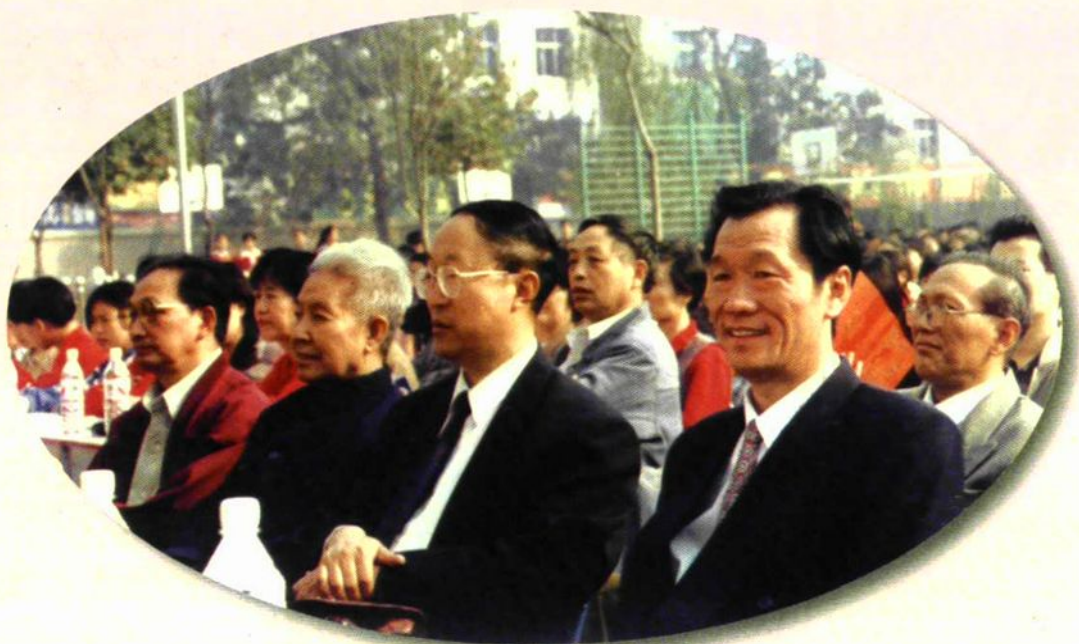
部分新老领导在校第五届艺术节上