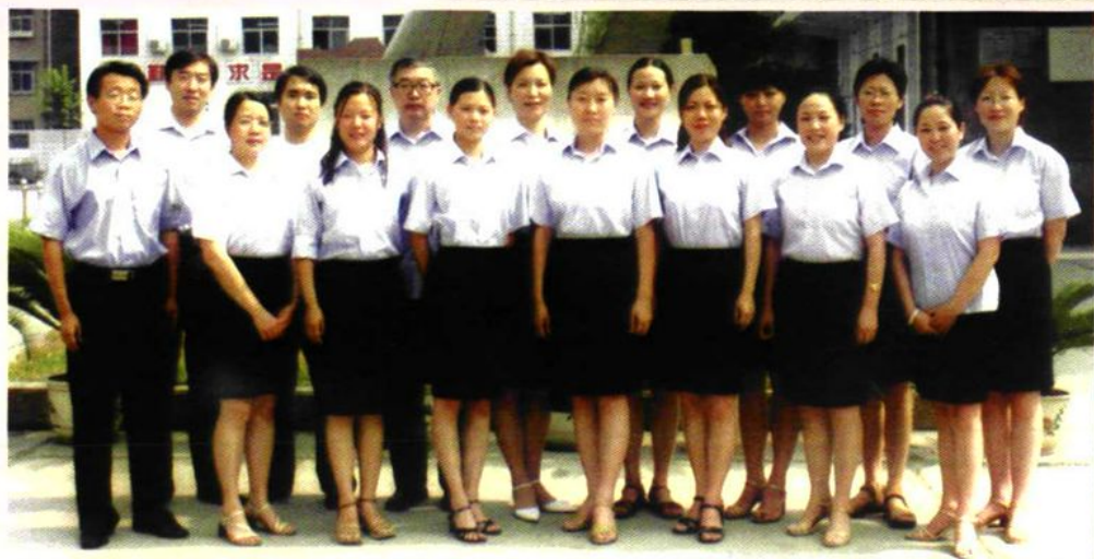
职业部零六届年级组