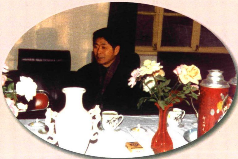
前任教育部副部长刘忠德视察学校