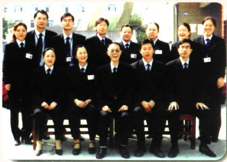
职业部零四届年级组