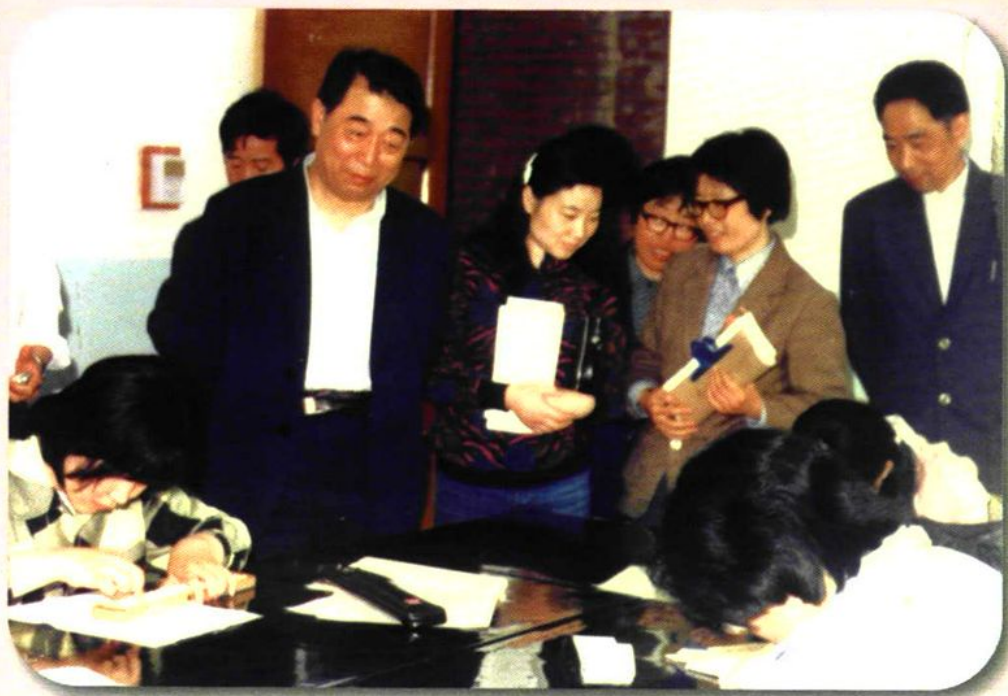
前任教育部副司长观看学生珠算表演