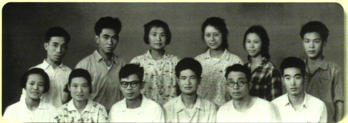
建校初期全体教师（1965年）