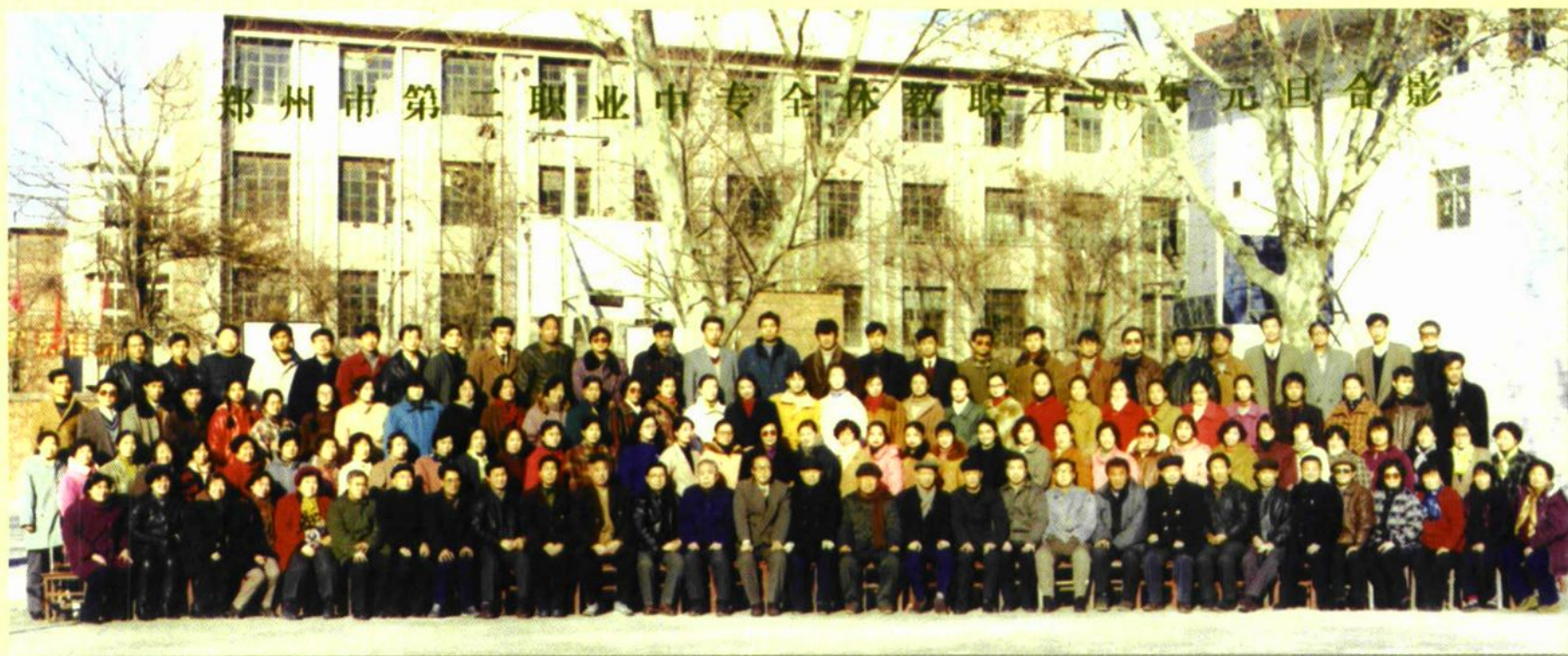
全体教职工合影（1996年元旦）