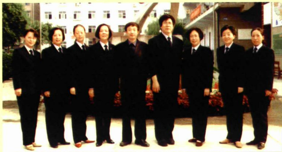
初中部数学教研组