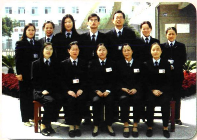
职业部零五届年级组