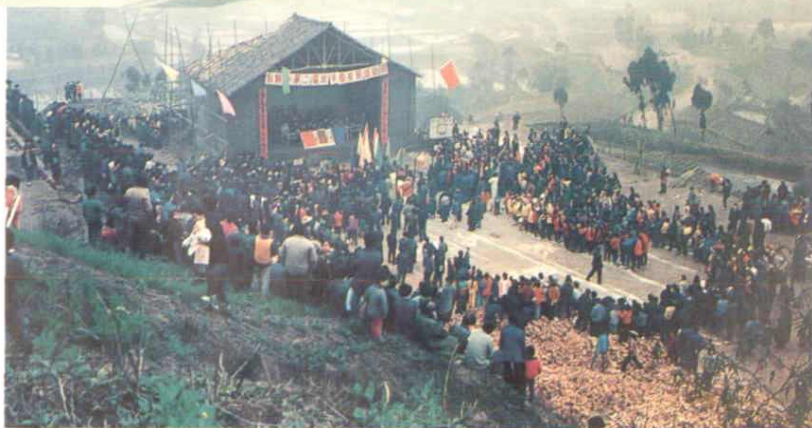
乡镇文化活动盛况