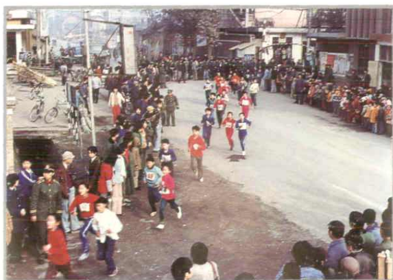
全民健身长跑活动