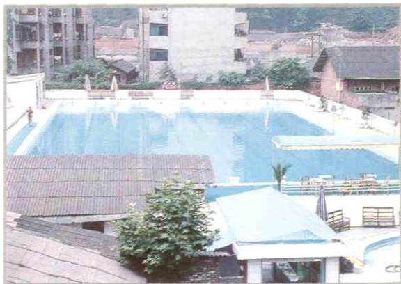
体育场游泳池