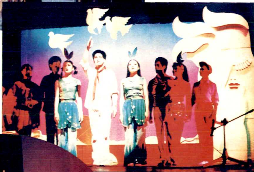
清溪花鼓