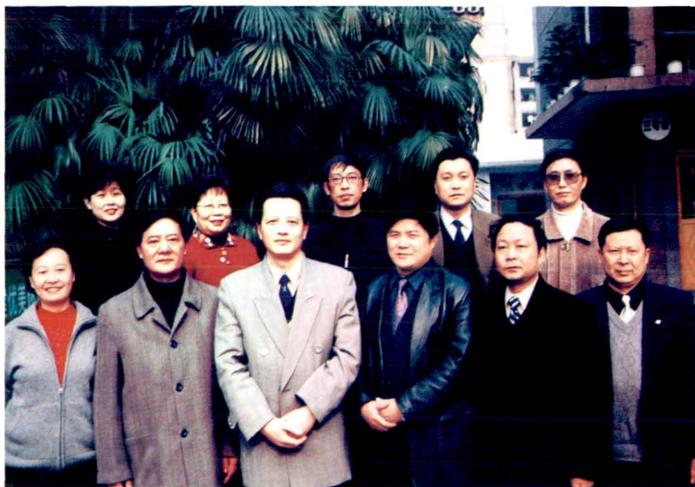
局机关全体工作人员