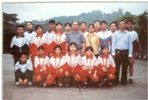
举重世界冠军邓国银与犍为青少年举重运动员在一起