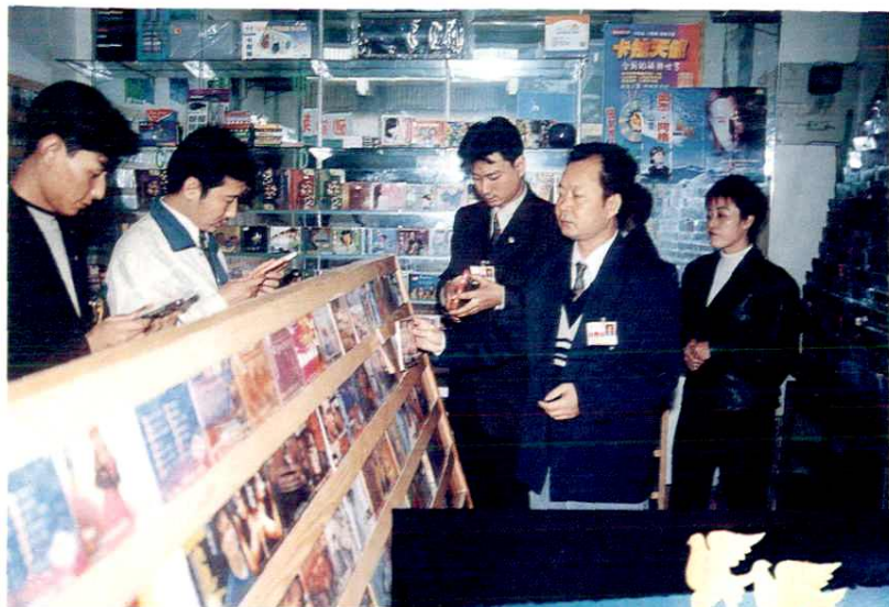
稽查人员对音像 市场进行检查