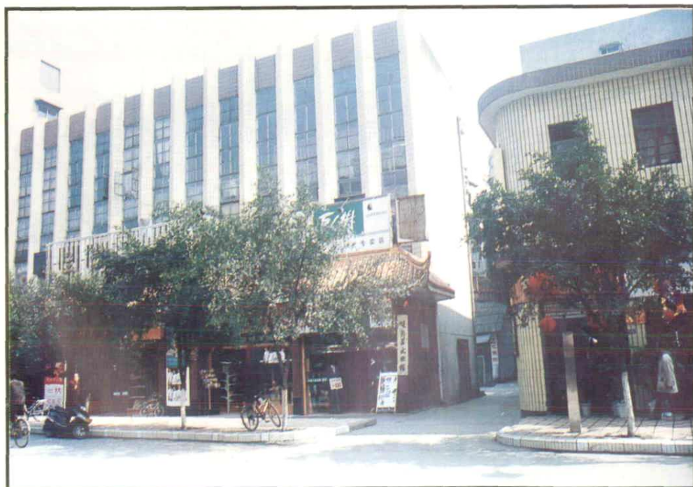
县文化馆活动大楼外景