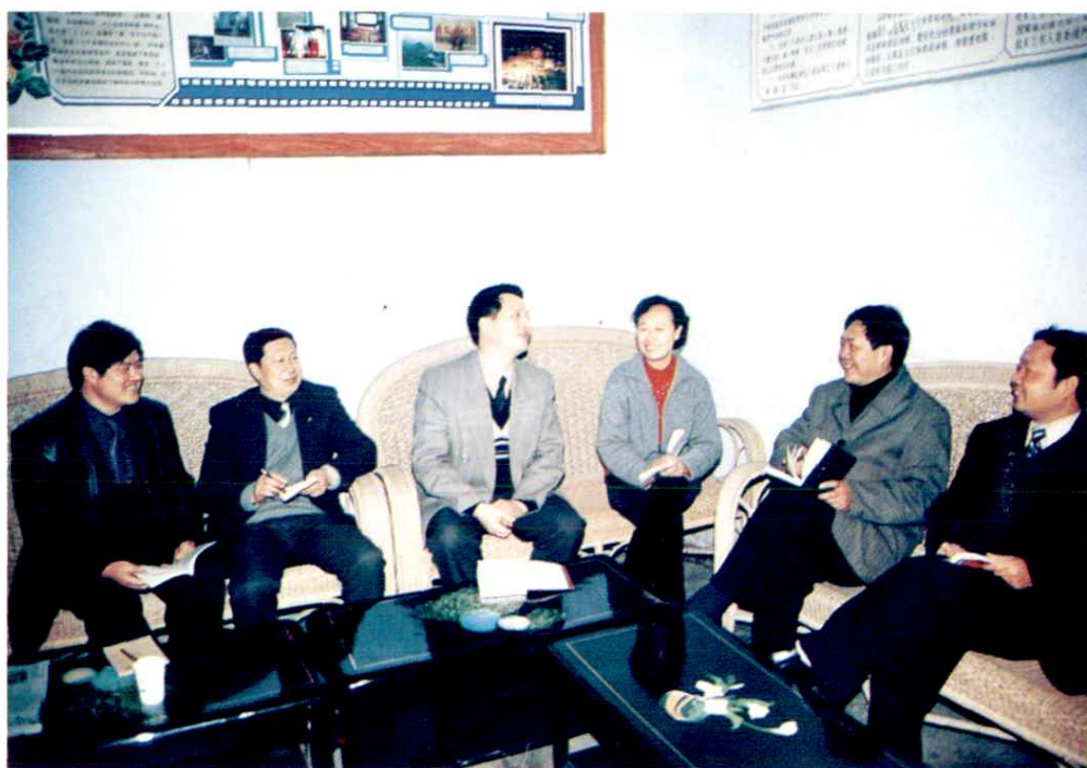
局领导班子共商发展大计