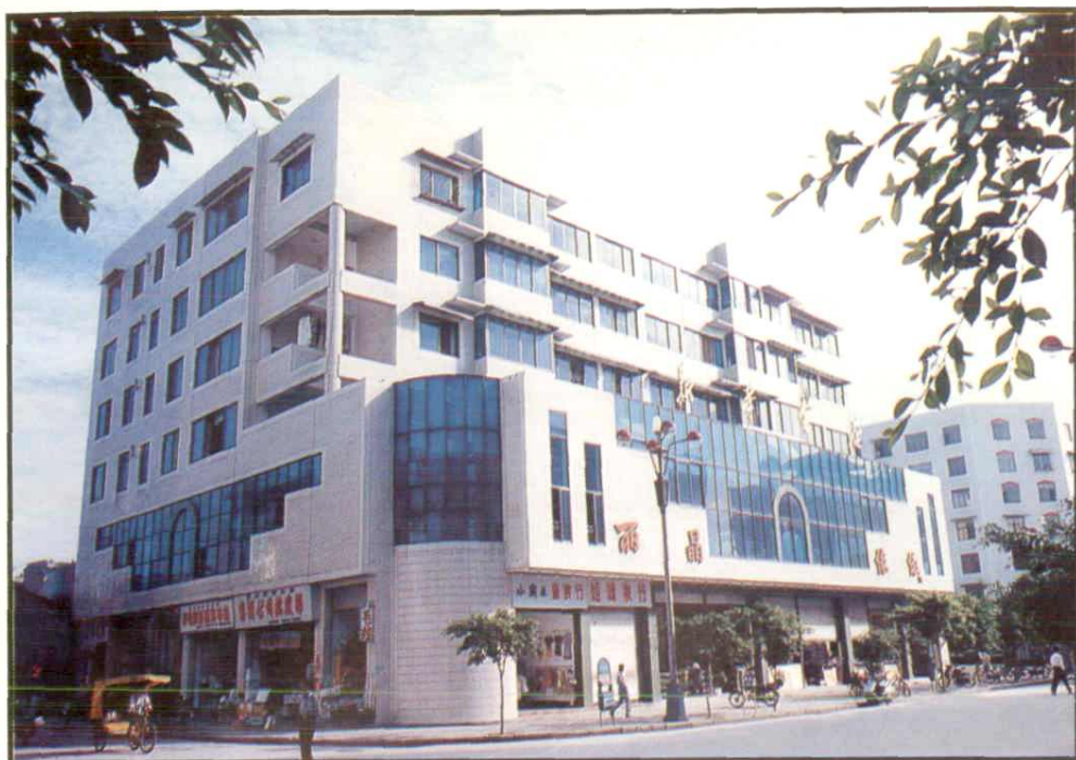
县新华书店综合大楼