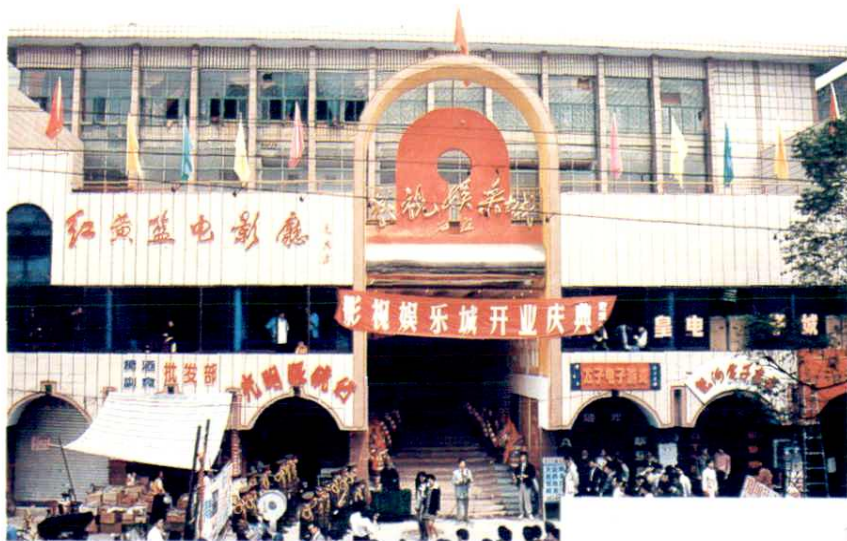
县电影公司大楼外景