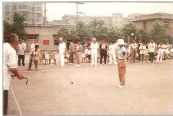
县老体协门球比赛活动