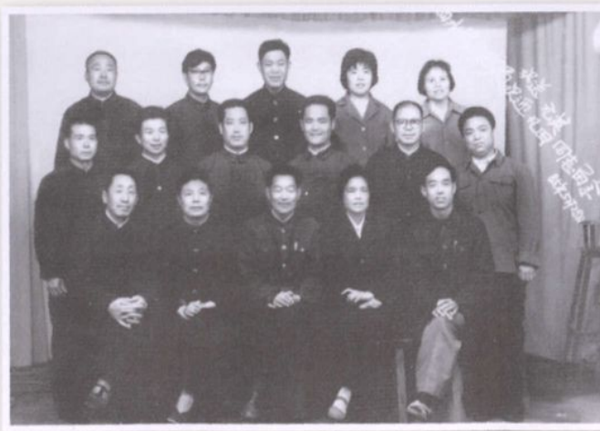
▲ 1985年民政局全体人员合影