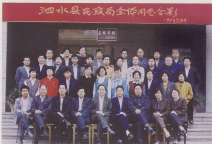
◀ 1993年民政局全体人员合影