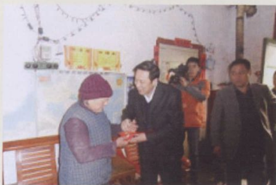
▲2010年2月，中共泗水县委书记王宝海慰问困难群众。