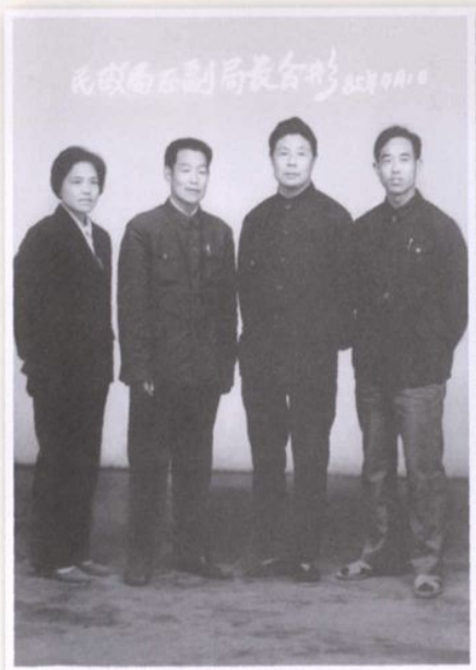
▲ 1985年民政局正副局长合影