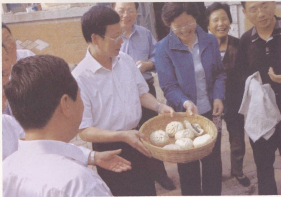
▲ 2006年10月18日，中共山东省委书记张高丽到泗水县群众家中了解生活问题。