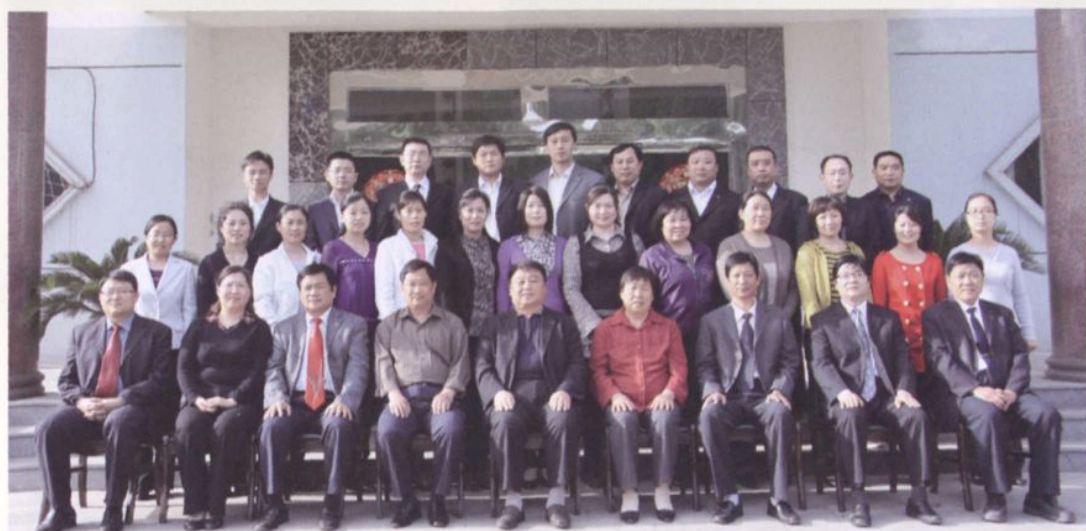
▲ 2006年民政局机关全体人员合影