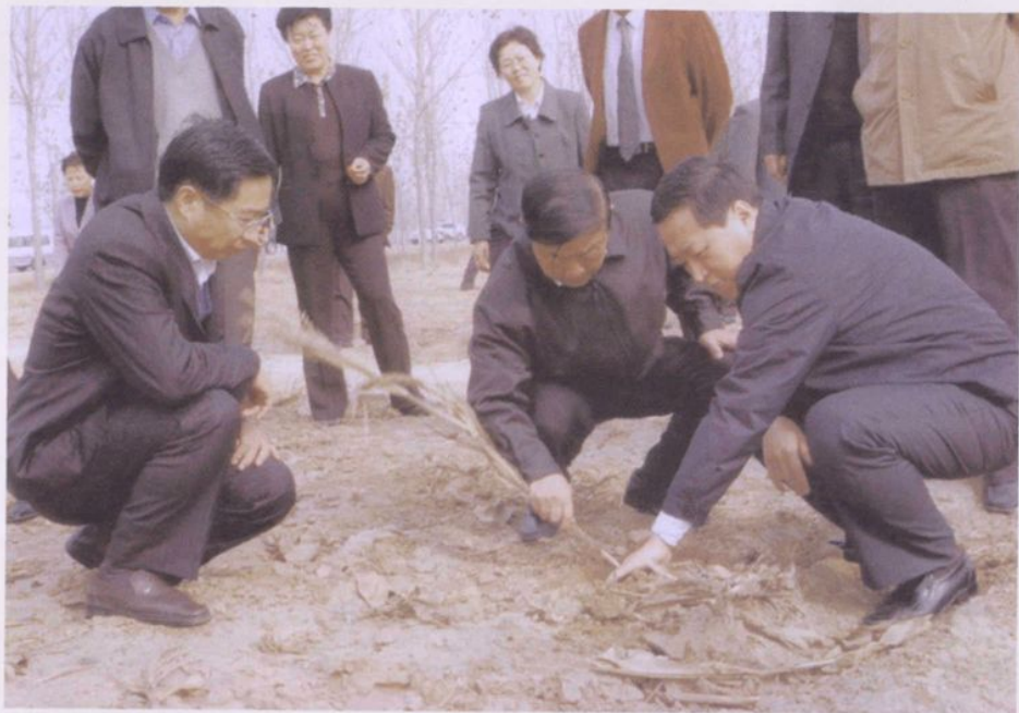
▲2006年11月20日，中共山东省委副书记、省长韩寓群深入泗水县田间地块了解旱情，仔细察看麦苗长势。