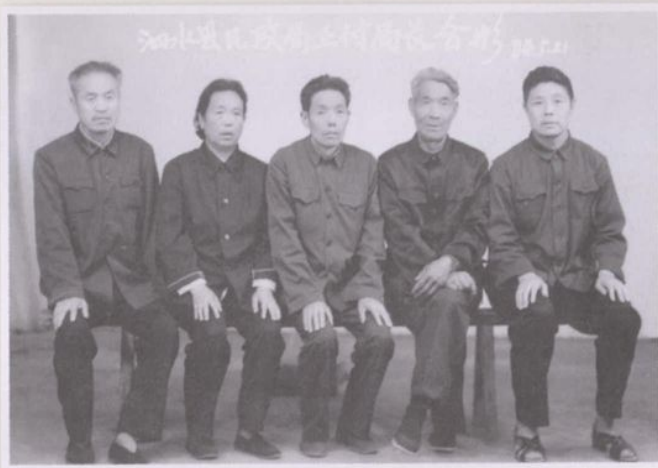
泗水縣民政局長任局長合影 1984