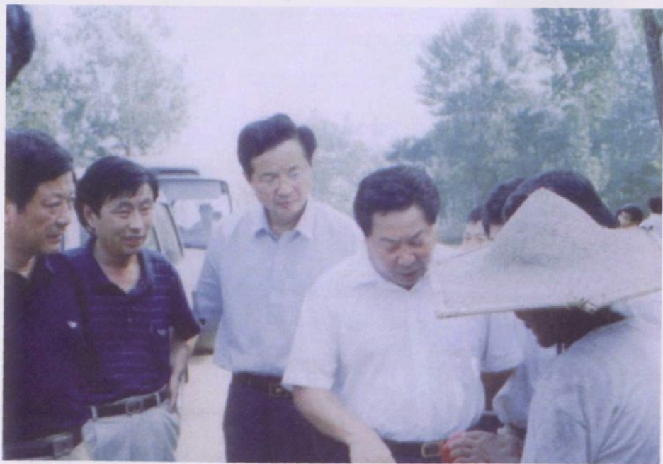
▲2002年8月29日，中共济宁市委副书记、市长周齐到泗水调研群众饮水及抗旱工作。