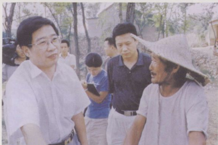
◀原县委书记田志锋到农村了解群众饮水及生产生活情况。