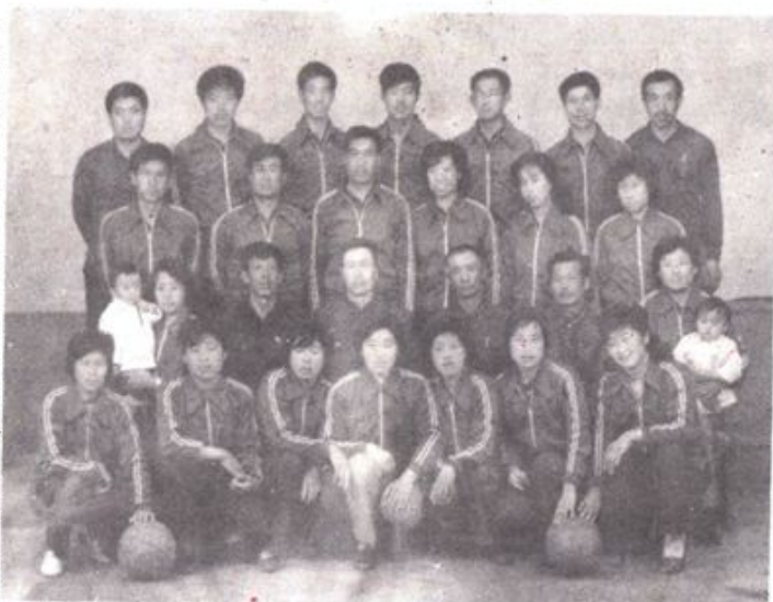
▷ 一九八二年场男女篮球队参加九三管局篮球赛图为全体运动员合影