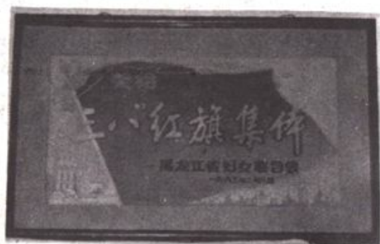
△ 九队场院女排荣获省“三八”红旗集体光荣称号