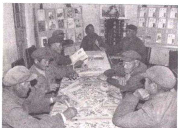
▽ 独身退休职工的幸福晚年