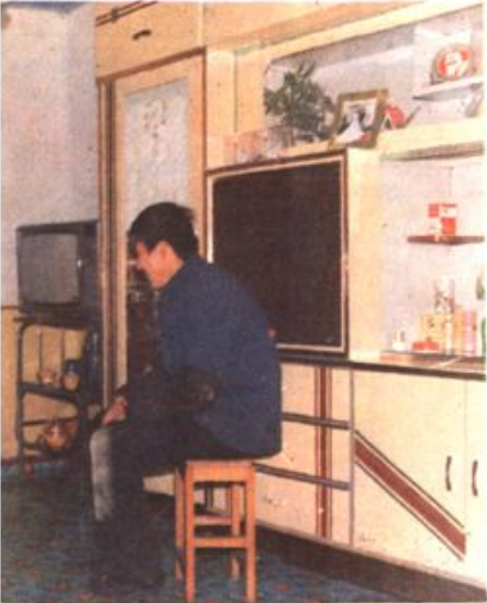
▷一个生产队的职工住宅区