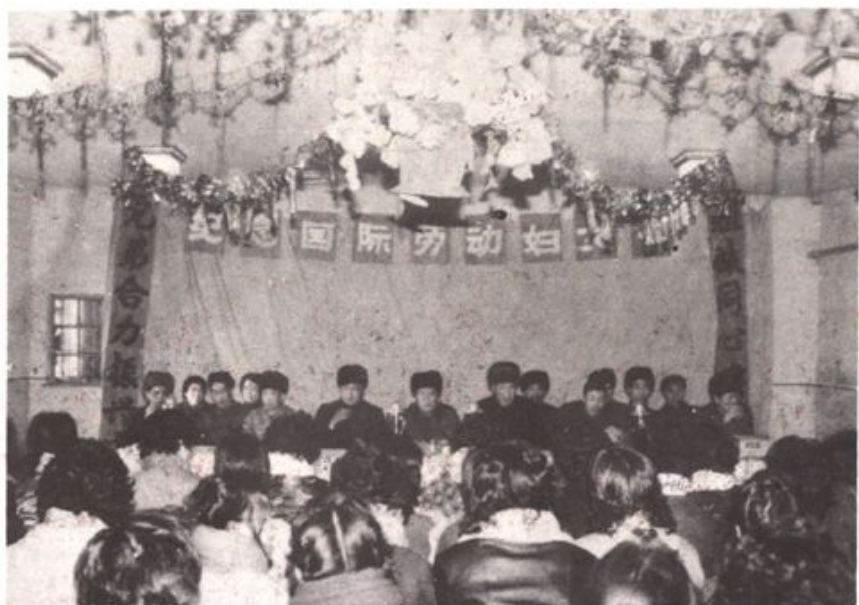
△场领导为妇女们祝贺节日