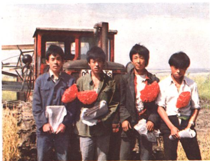
▷ 麦收劳动竞 赛中优胜车 组戴光荣花