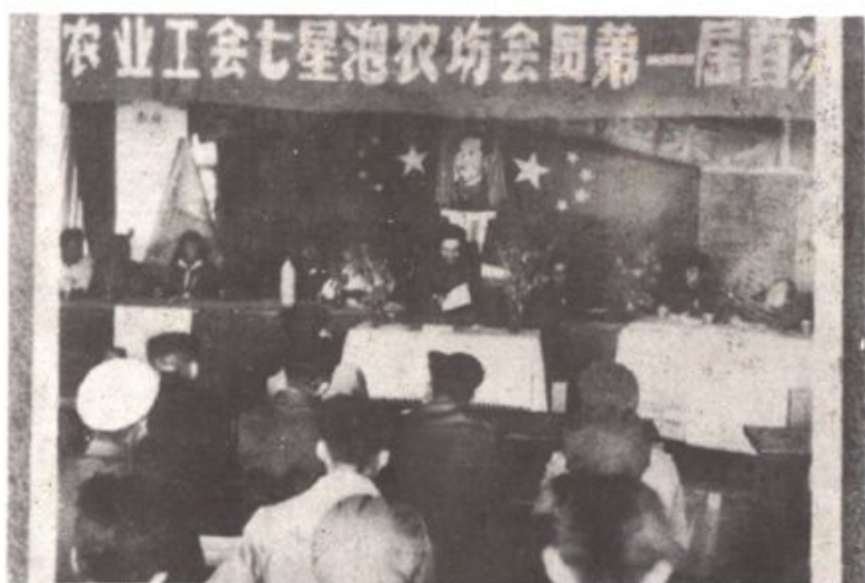
△七星泡农场首届会员代表大会（1959年）