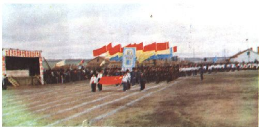
△七星泡农场第七届田径运动会开幕式