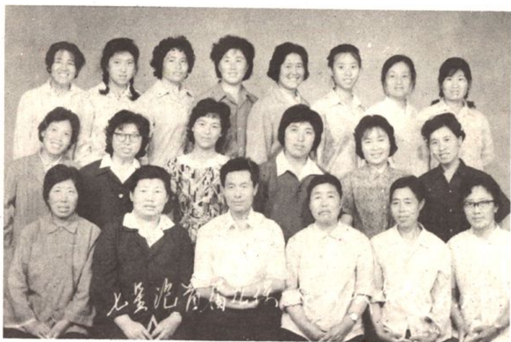
七星泡农场首届儿童保教会议合影（1981年7月14日）