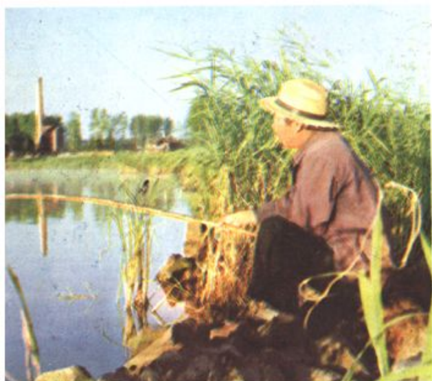
△退休老干部在垂钓