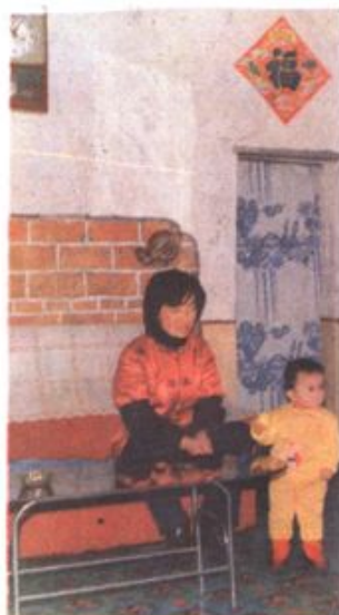
△ 充满欢乐的职工家