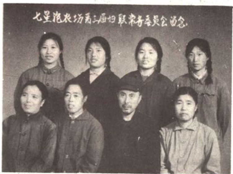
七星泡农场第三届妇联常务委员会委员合影（1973年9月22日）