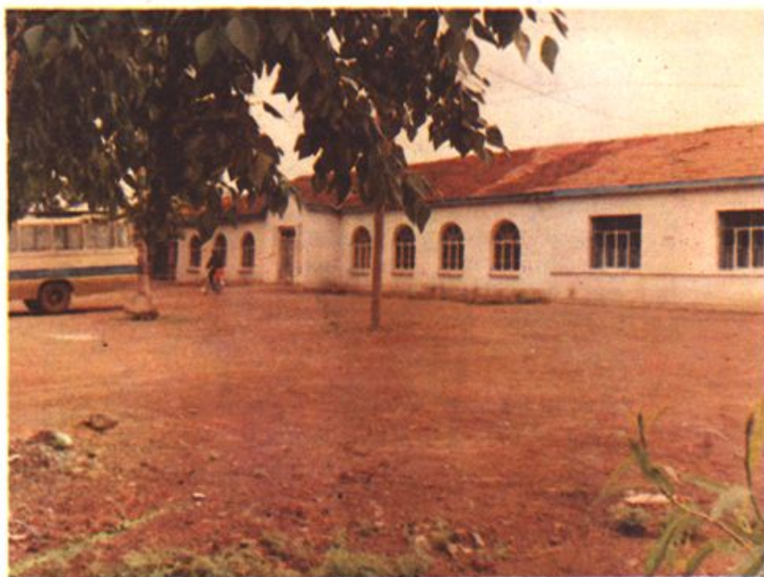
△七星泡农场工会办公室