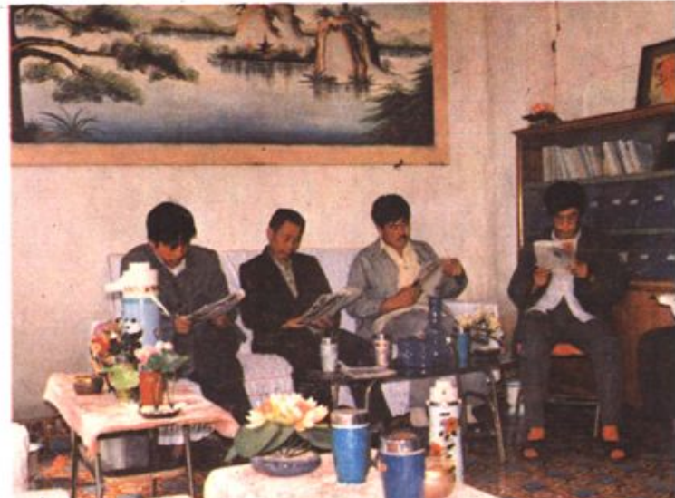
△基层工会开展读书活动