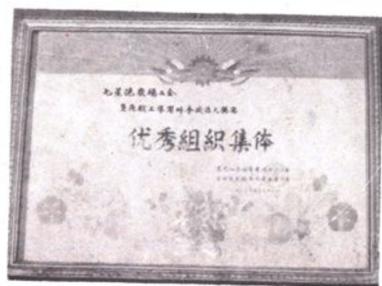
△ 场工会荣获省农场总局工会组织的垦区职工学时事政治大奖赛优秀组织集体奖