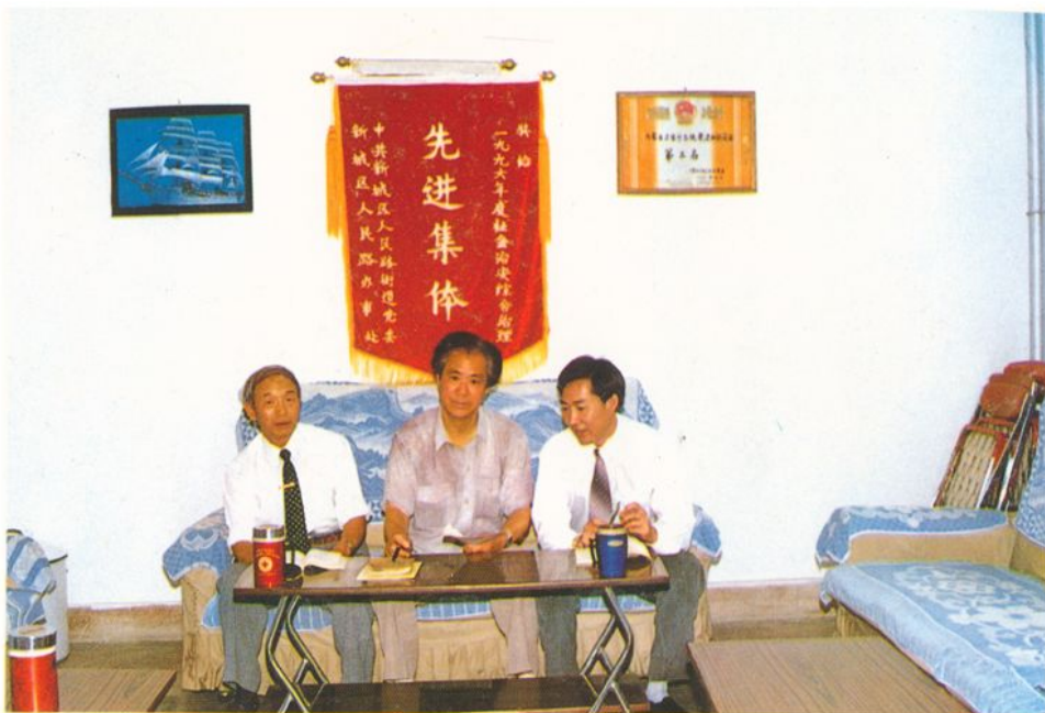
现届领导班子在研究工作