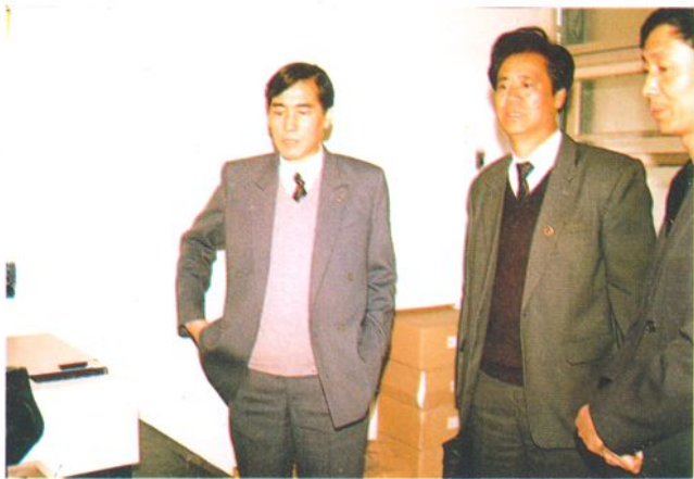
中国药品生物制品检定所周海钧所长来我所指导工作