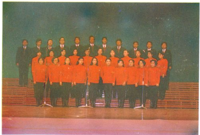
我所合唱队参加卫生厅系统 “纪念毛泽东诞辰 100 周年”文艺汇演