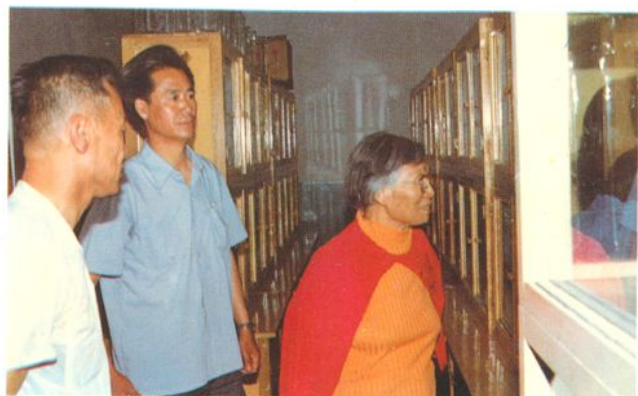
美国专家来所参观讲学