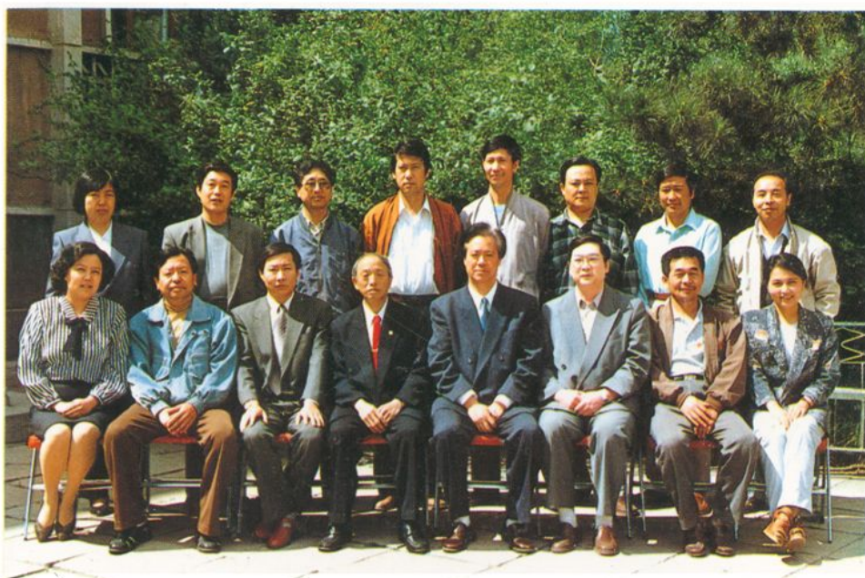
所领导与现任各科主任合影