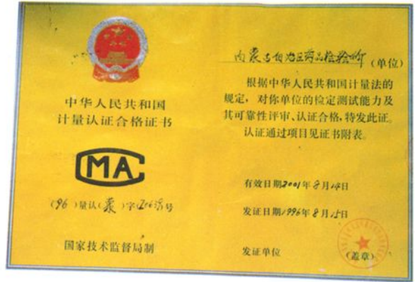
内蒙古自治区政府技术监督局颁发的计量认证合格证