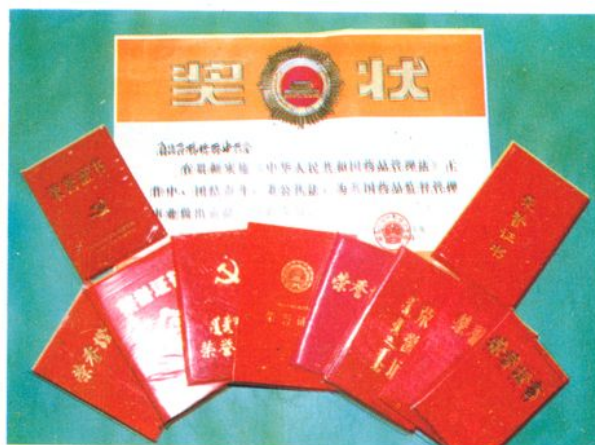
先进工作者获奖部分荣誉证书