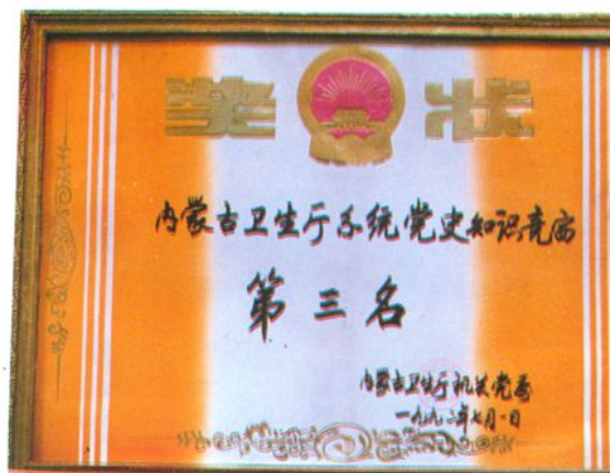
卫生厅系统党史知识竞赛获奖状