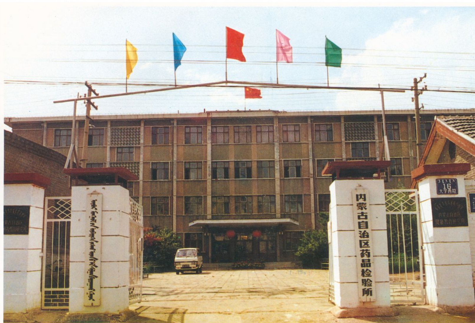
内蒙古自治区药品检验所 实验楼