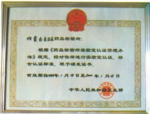
卫生部颁发的药检所实验室认证合格证