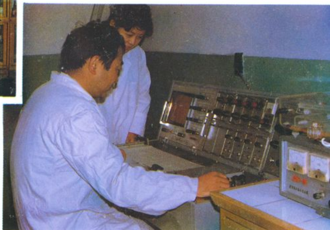
药理：操作多功能生化仪