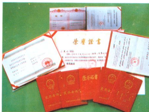
科技进步奖获奖部分证书