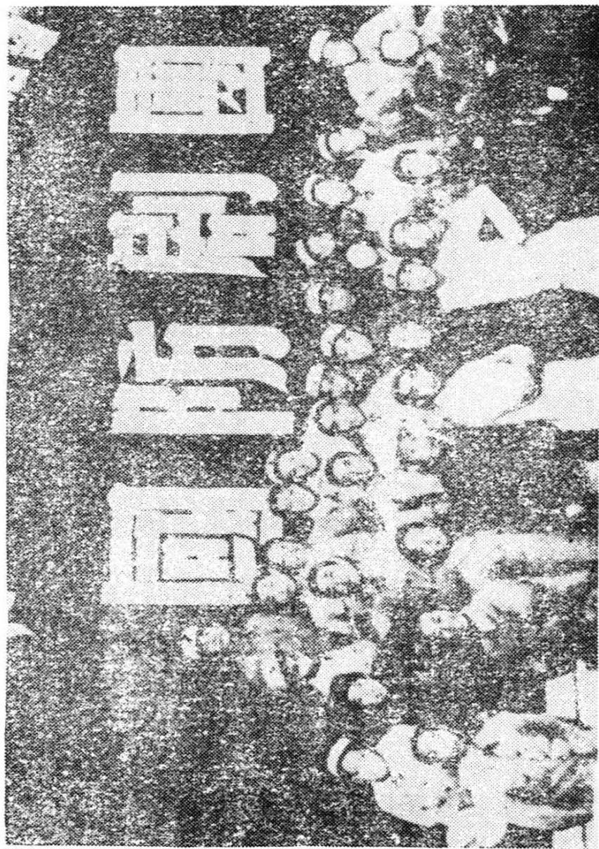
1945年烟台解放后，原胶东军区政治部国防剧团 在烟台演出期间，部分同志合影。