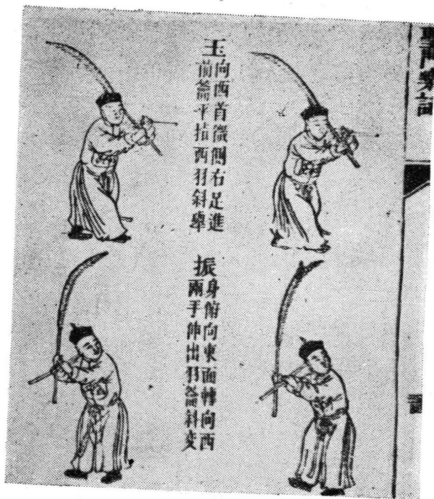
祭孔乐舞·歌舞（部分）