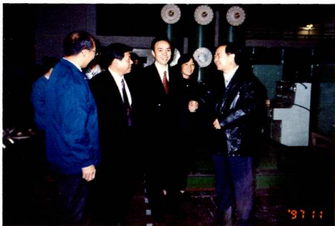
北京市委常委、宣传部长龙新民（左三）于1997年11月8日到北开调研。