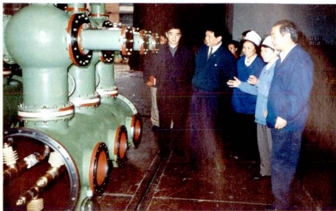
北京市市长刘琪（左二）、副市长刘海燕（左一）1998年4月到北开调研。