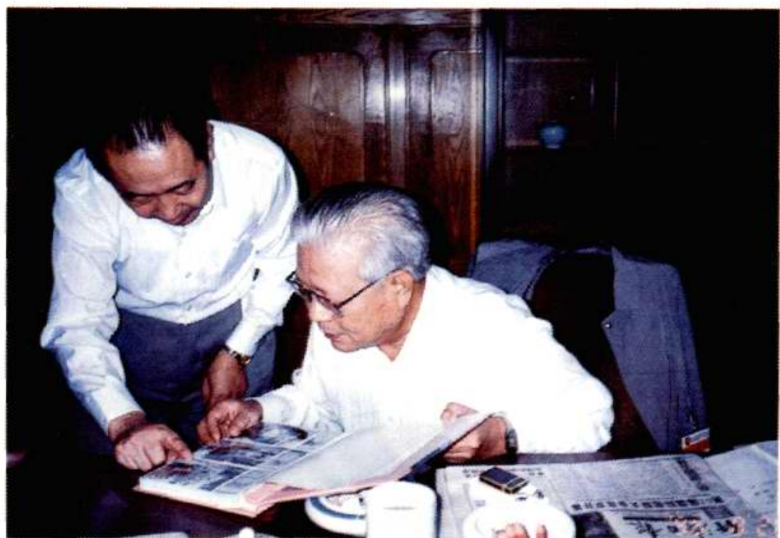
1996年8月28日，原人大常委会副委员长李锡铭（右）观看我厂厂长黄国诚送去的相册。