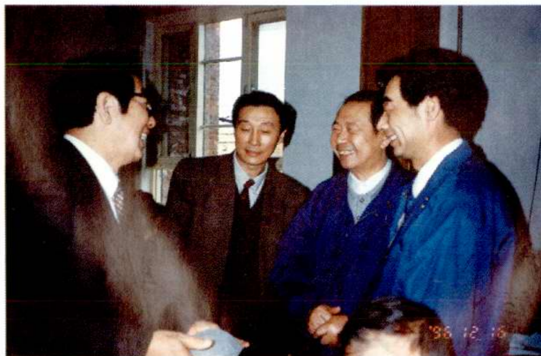
北京市人大常委会主任张健民（左一）1998年12月到北开调研。