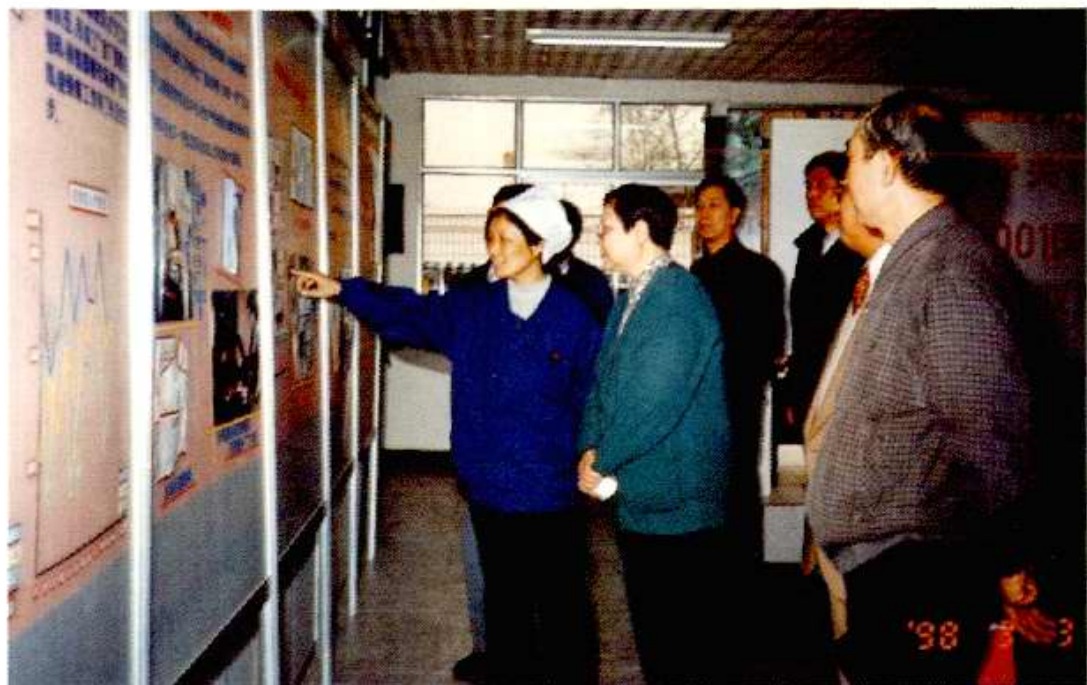
北京市委常委、纪委书记程世峨（左二）1998年3月到北开调研。