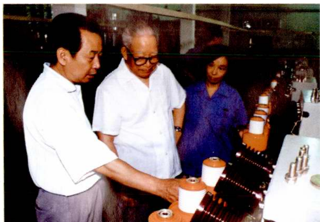
中国企协会会长袁宝华（中）于1996年8月15日到北开视察。图为袁宝华在车间。