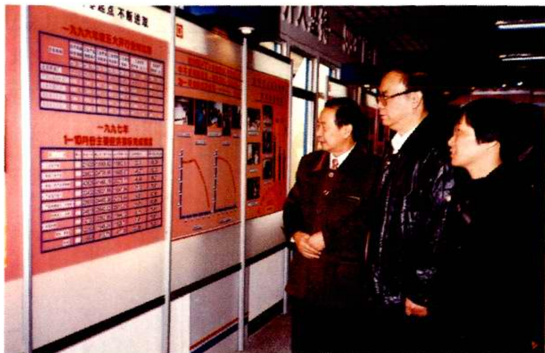
北京市委副书记李志坚（右二）1998年12月到北开调研。