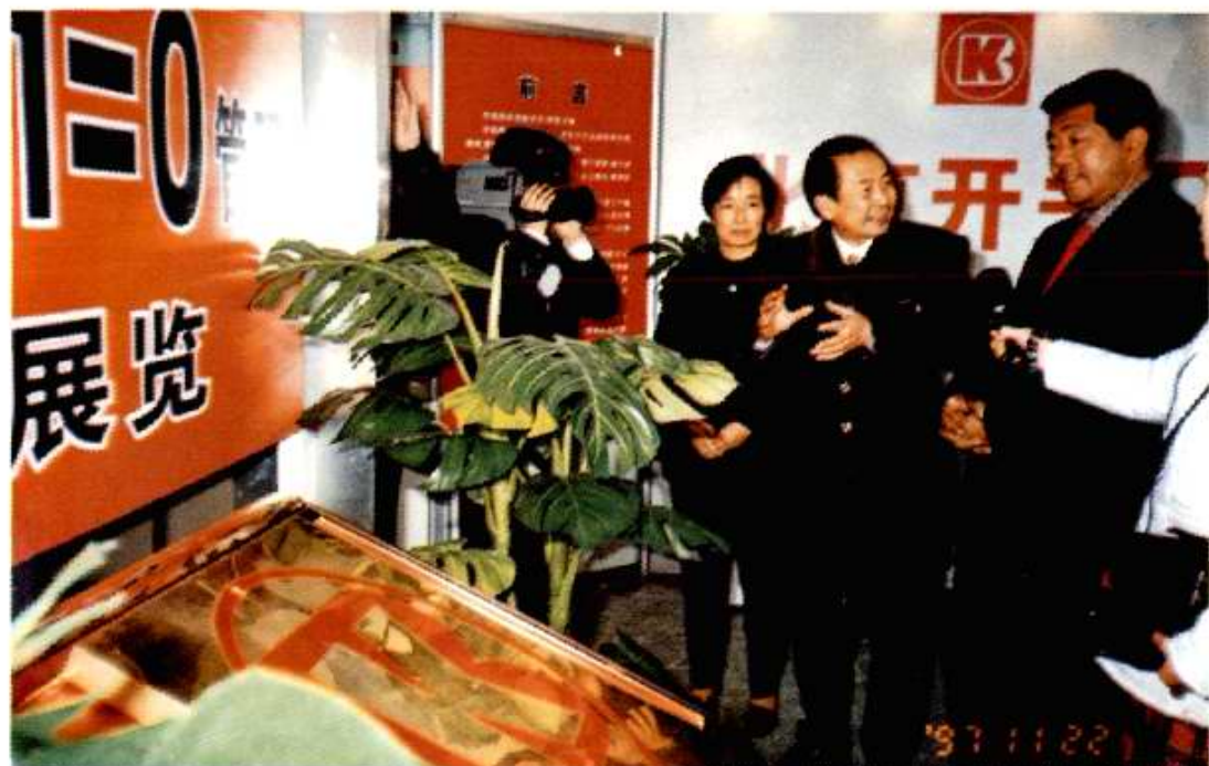
中共中央政治局委员、北京市委书记贾庆林于1997年11月22日到北开视察。图为贾庆林（右一）在我厂观看“实施99+‘1’=0管理成果展。”