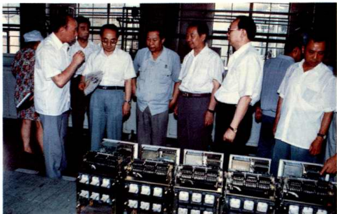
原机械工业部部长包叙定（前左二）1997年7月31日到北开调研。