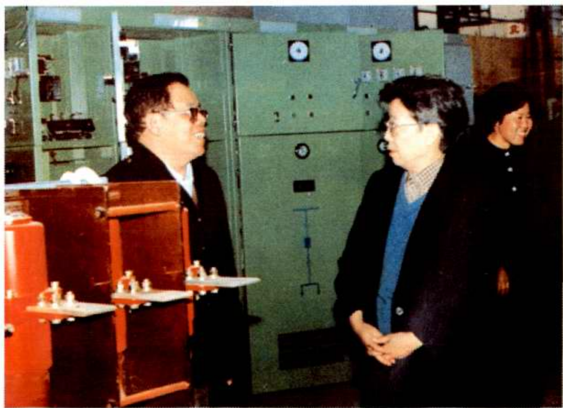
原北京市副市长、现国务委员吴仪（中）1989年到北开调研。