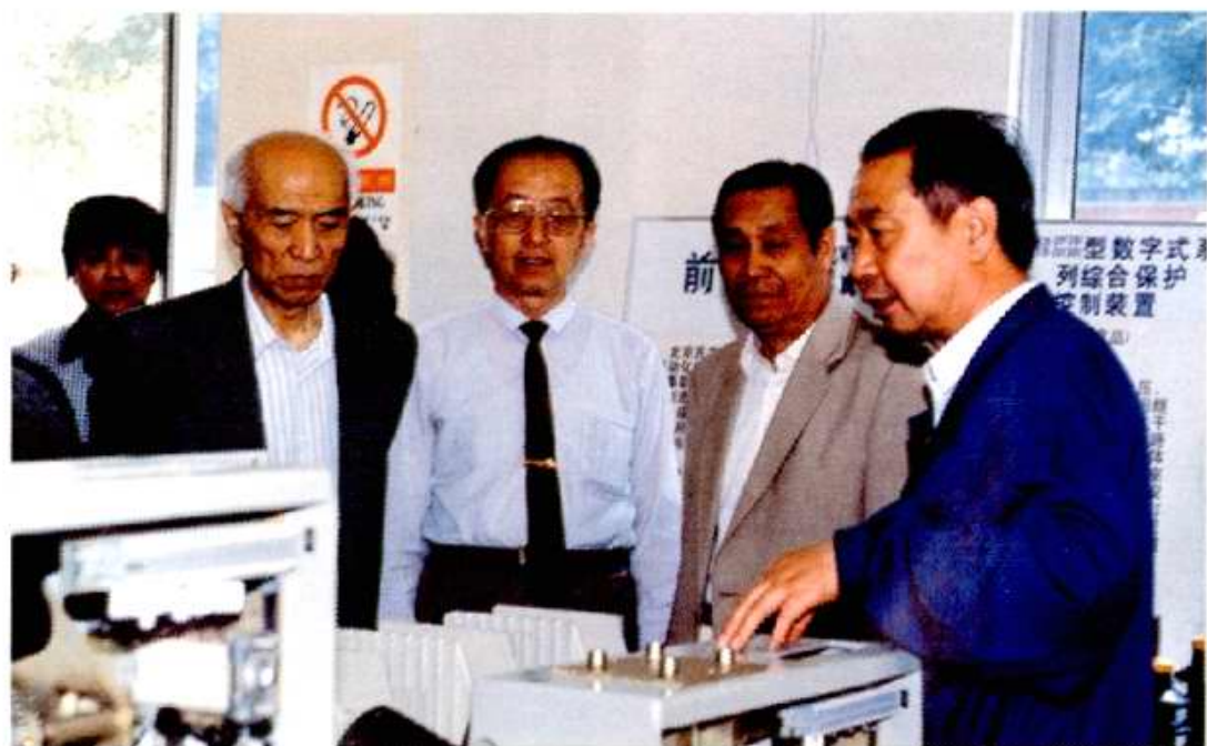
原北京市政协主席王大明(左二)于1996年5月17日到北开调研。