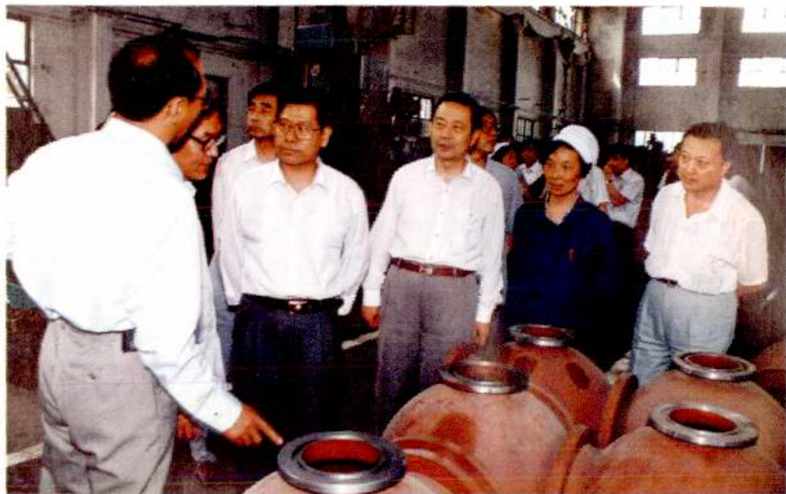
北京市委常委阳安江（左四）1996年6月到北开调研。