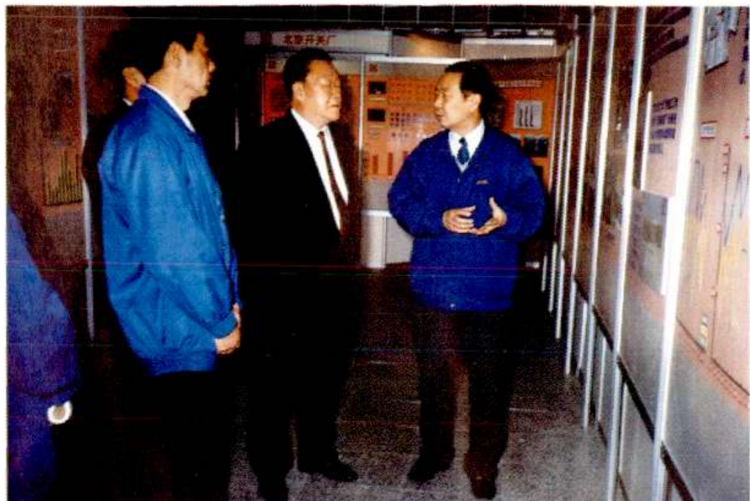
全国政协副主席万国权于1997年12月15日到北开视察。图为万国权（右二）在展厅参观。