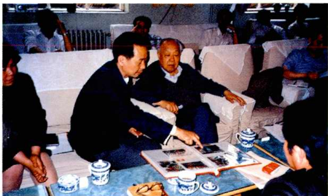
原国家计委主任、现国务院工业经济协会会长吕东(右二),于1988年4月到北开视察。