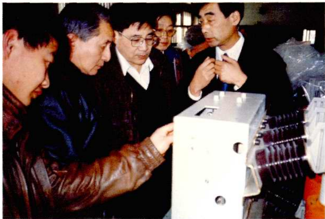
国家机械工业局副局长孙昌基（左三）1995年1月13日到北开调研。