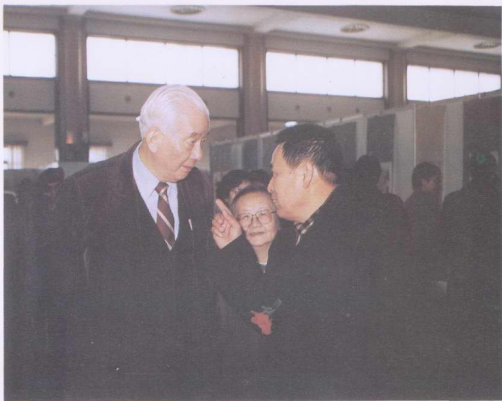
唐克同志与油田领导同志亲切交谈