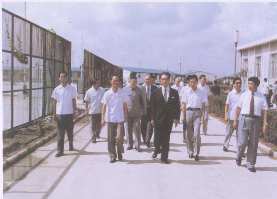
1983年8月,日本国众议院副议长岗田春夫先生访问渤海油田