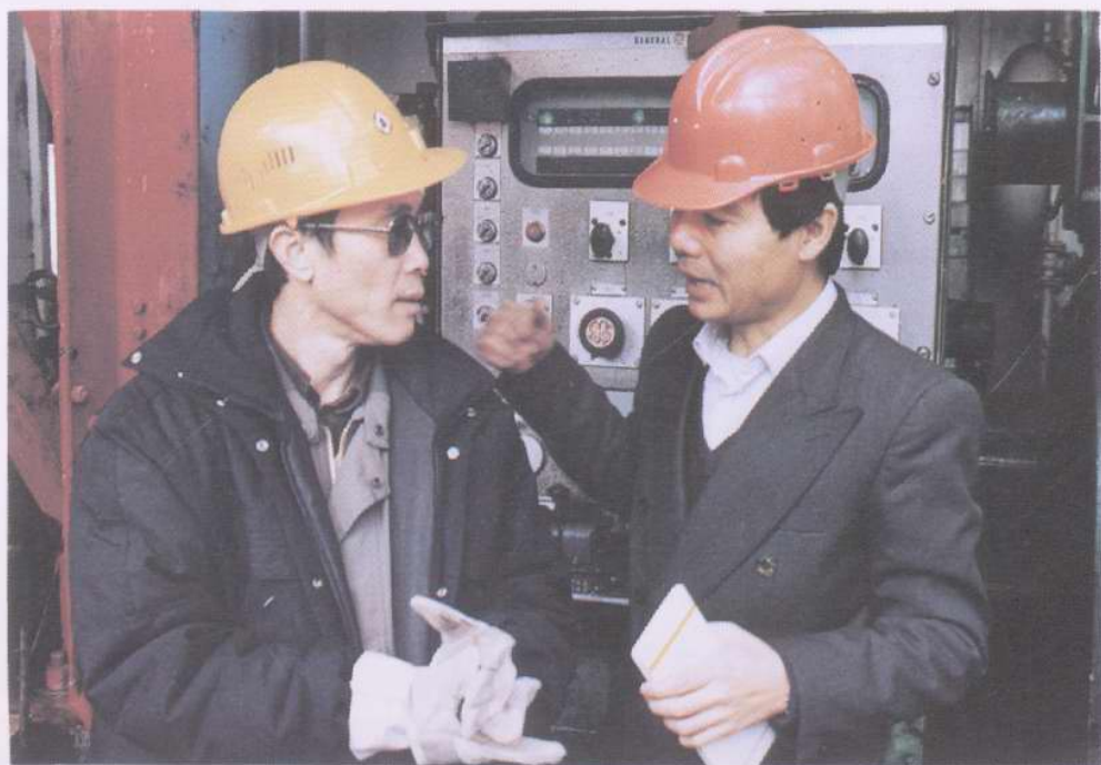
中国海洋石油总公司陈炳骞副总经理在渤海油田听取钻井工作汇报