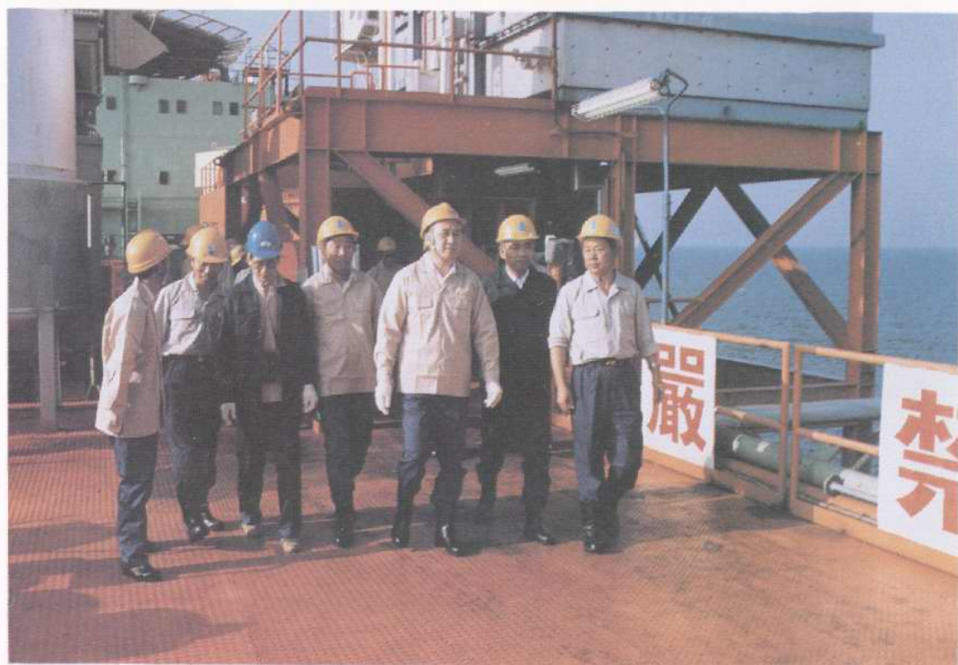
1990年7月,能源部部长黄毅诚同志视察渤海渤中34-2/4E油田