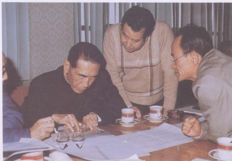
1985年4月,国务委员康世恩同志视察渤海油田,听取勘探开发工作汇报