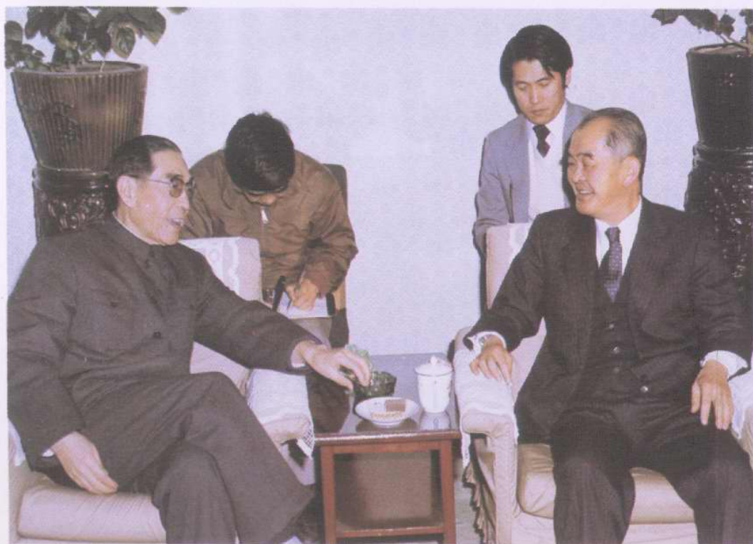
康世恩同志在渤海油田会见来访的日本客人