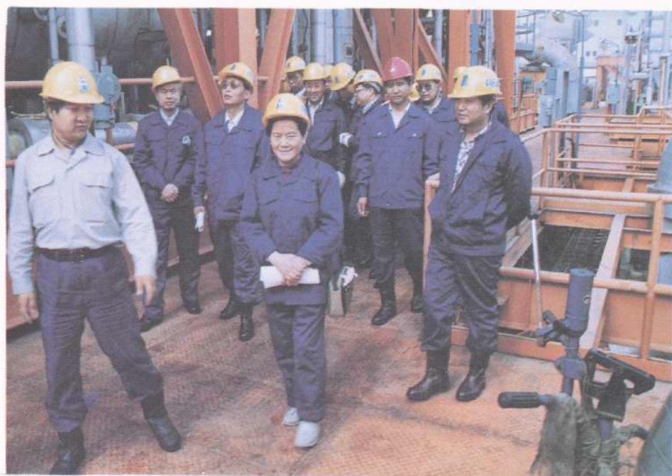
1991年6月,国家九部委领导人视察渤海渤中28-1油田