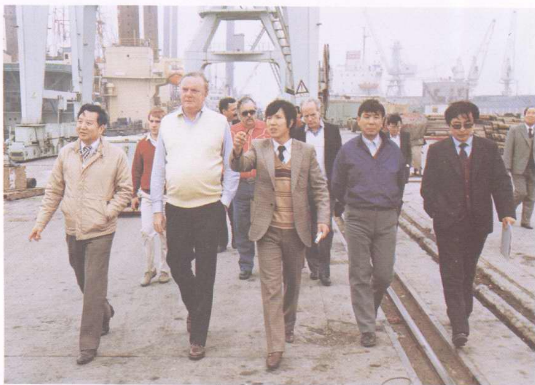
1989年4月,英国能源大臣莫雷森先生访问渤海油田