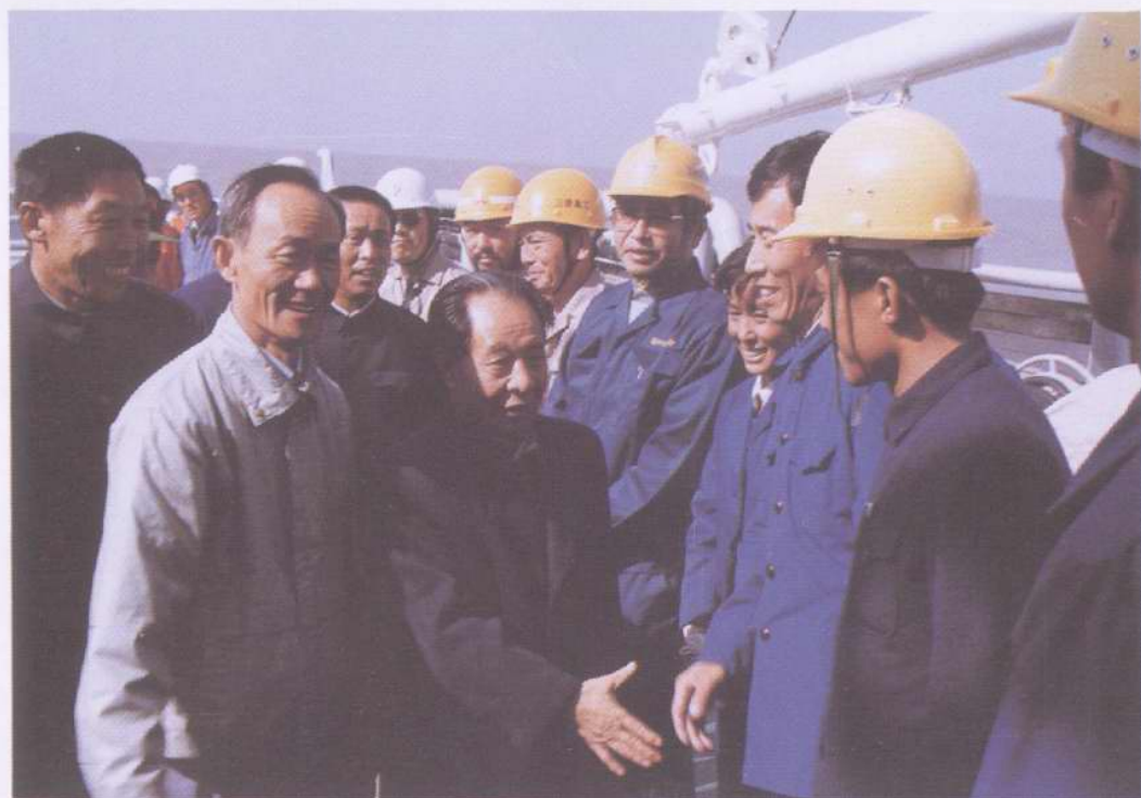
1984年10月,胡耀邦同志视察渤海油田