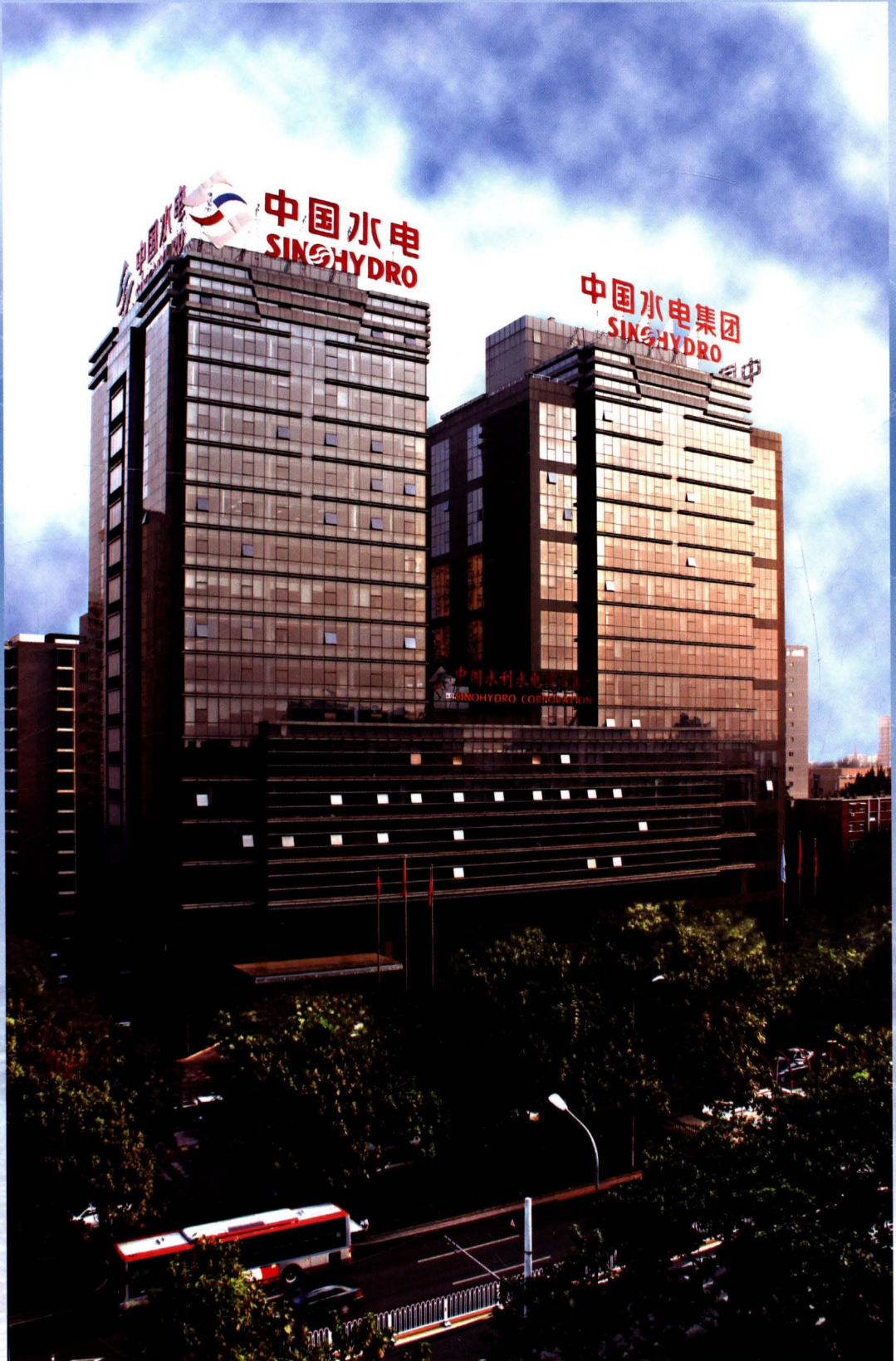
中国水利水电建设集团公司大楼