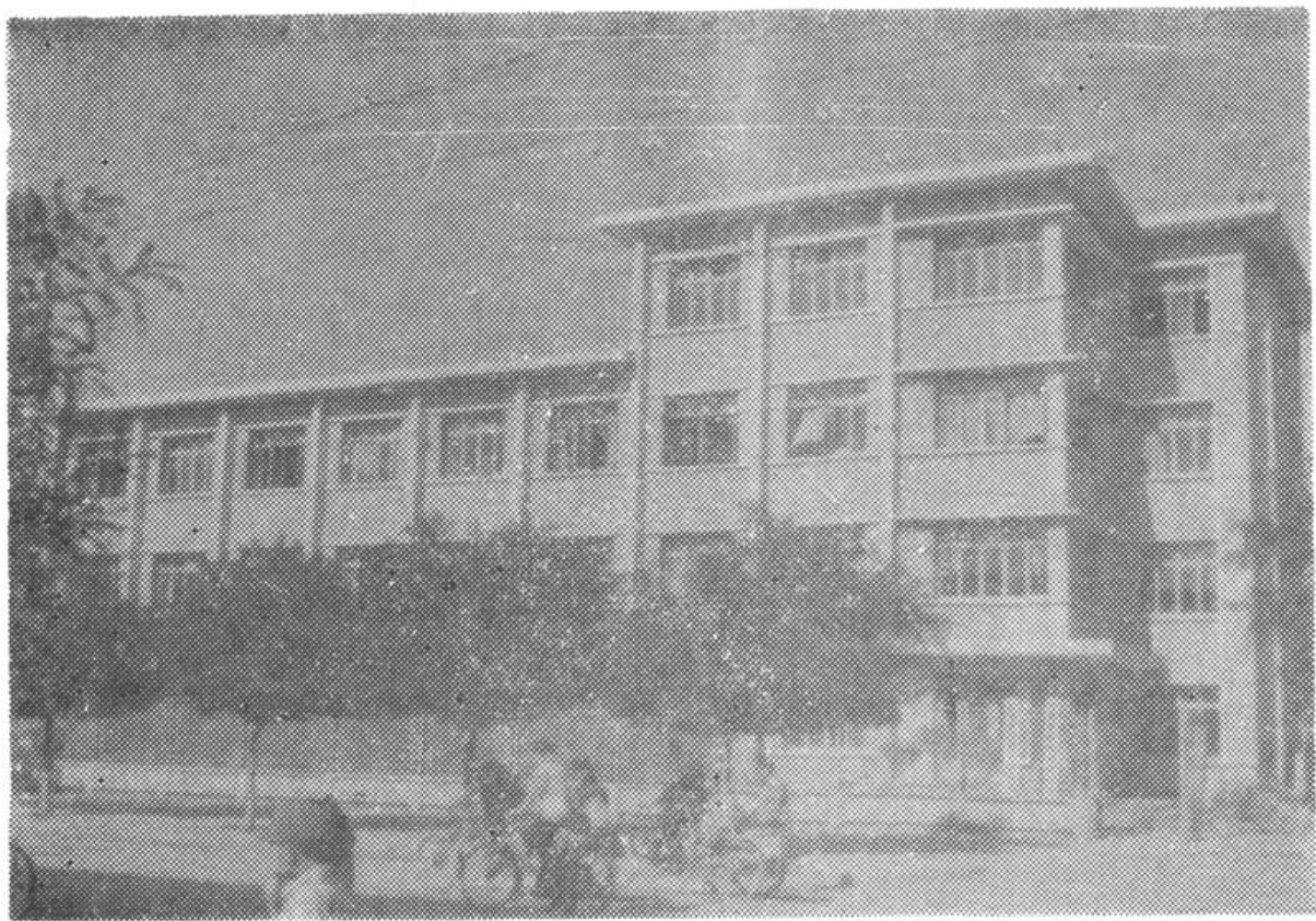
临夏市财政、税务局办公楼