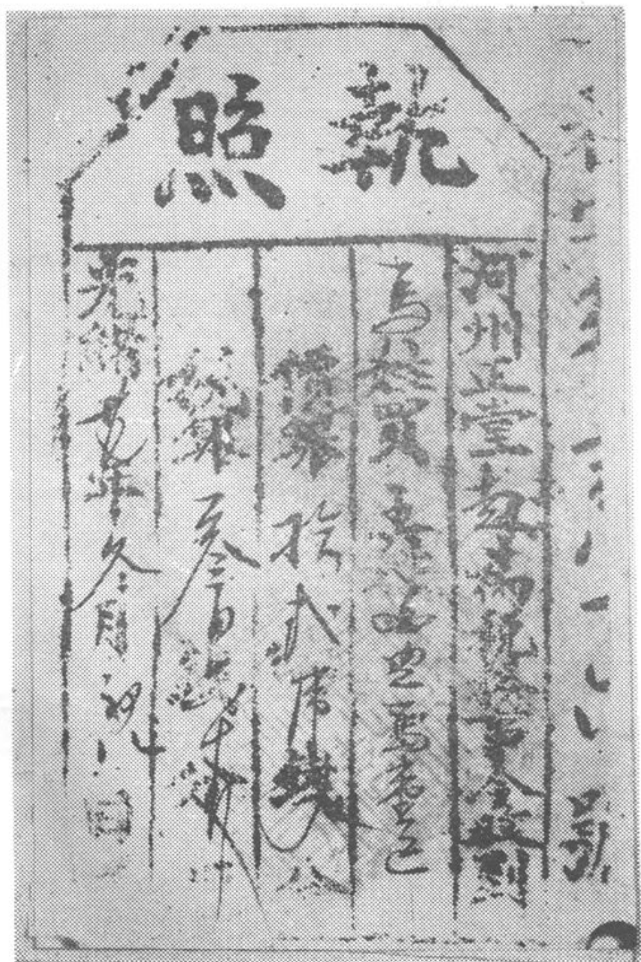
清代：河州牲畜交易税完税执照（图三）