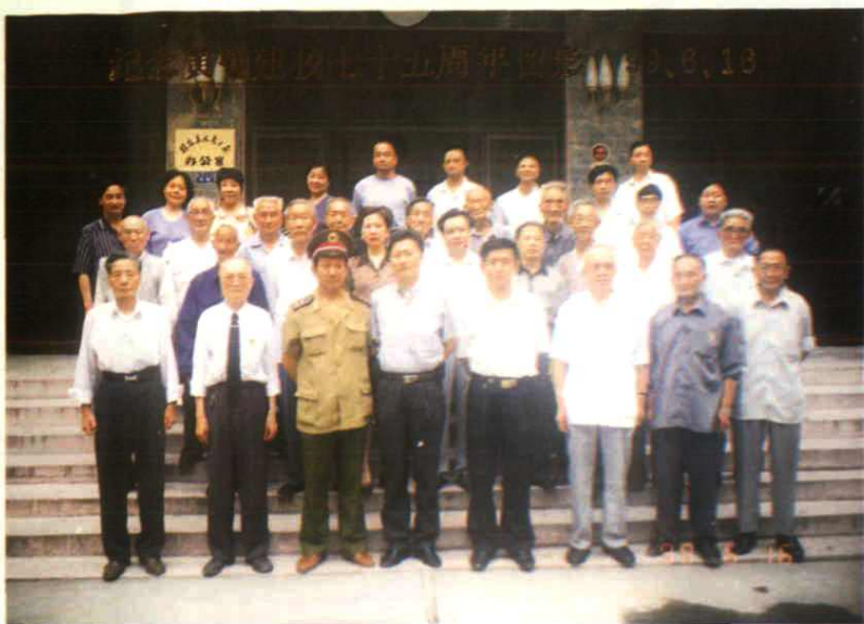
县委、县人大、县政协、县武装部、县统战部领导与犍为黄埔同学及其后代代表纪念黄埔建校七十五周年合影