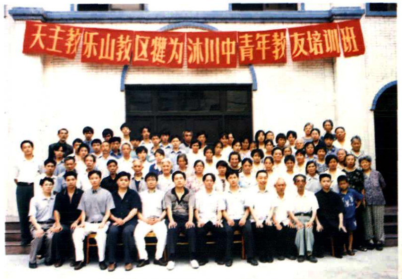
2000年7月健为沐川天主教中青年教友培训班全体成员合影