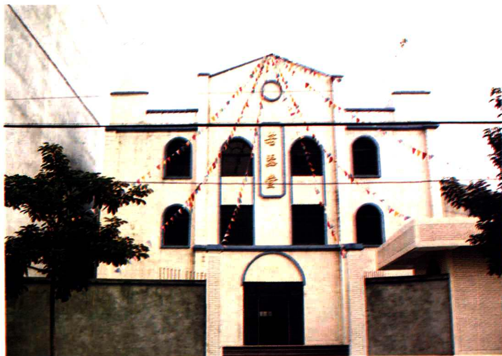
犍为玉津镇天主教堂