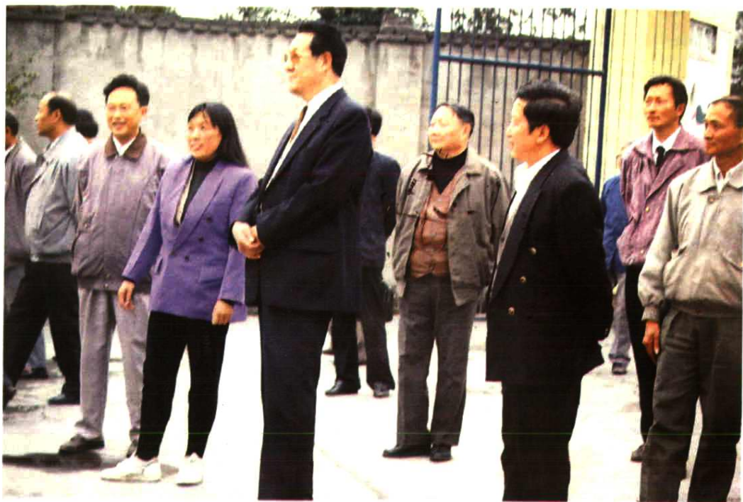
1994年全国人大民委副主任伍精华(左起第四)视察罗城民族幼儿园