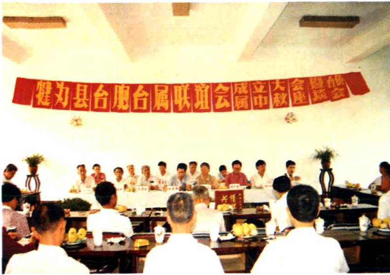
1992年健为县台胞台属联谊会会场景