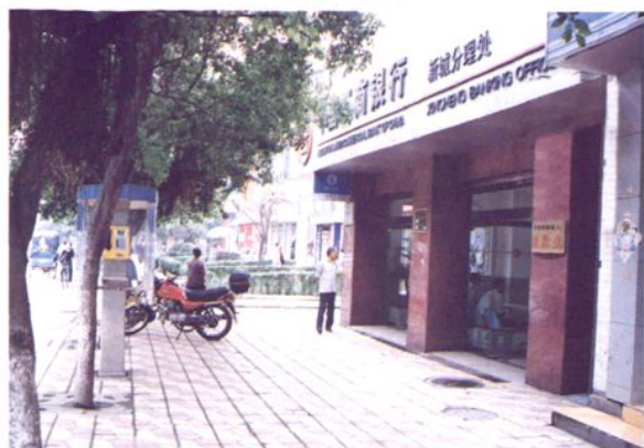
新城分理处 (原新城储蓄所)