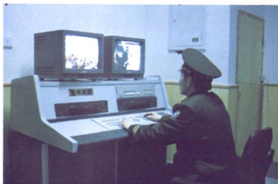
安全保卫监控系统