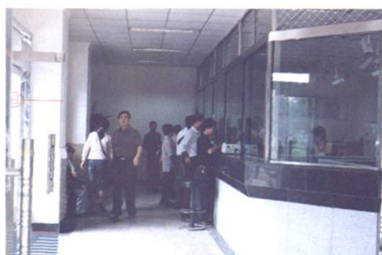
新城分理处业务大厅