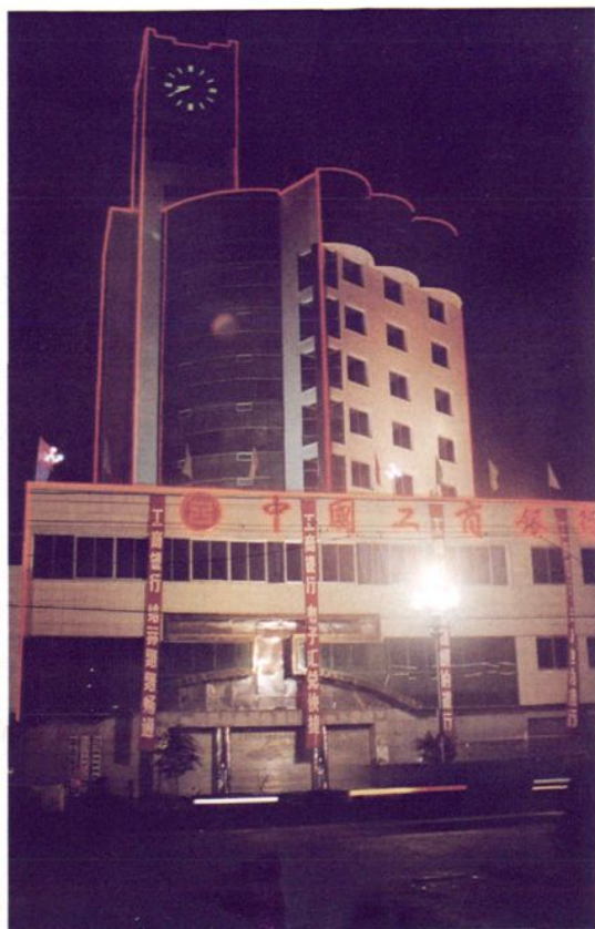
业务综合大楼夜景