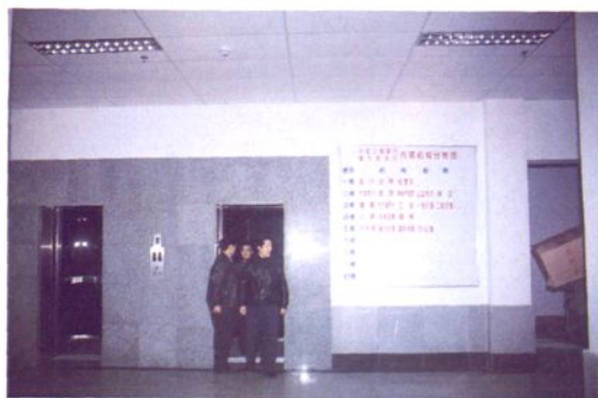
业务综合大楼双行电梯