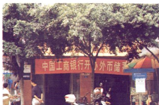
1996年4月起，开办外币储蓄，先行 办理美元、港元存兑业务