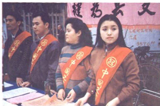
1995年起，向群众宣传人民银行法、 商业银行法、票据法等金融法规