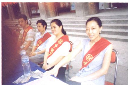
1989年12月起，向群众开展人民币防 假反假宣传