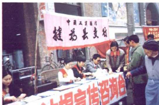
改进服务，设点方便群众兑换残损人民币