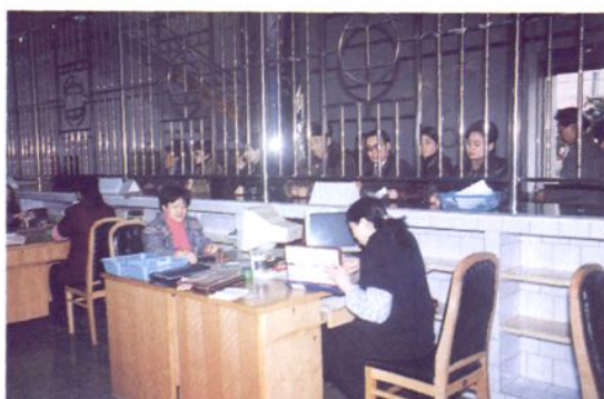
会计、出纳业务大厅