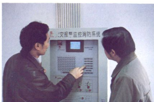
业务综合大楼火警监控消防系统