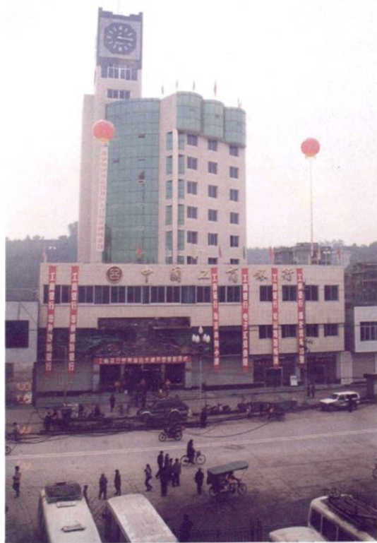
1998年2月新建竣工投入营业的业务综合大楼