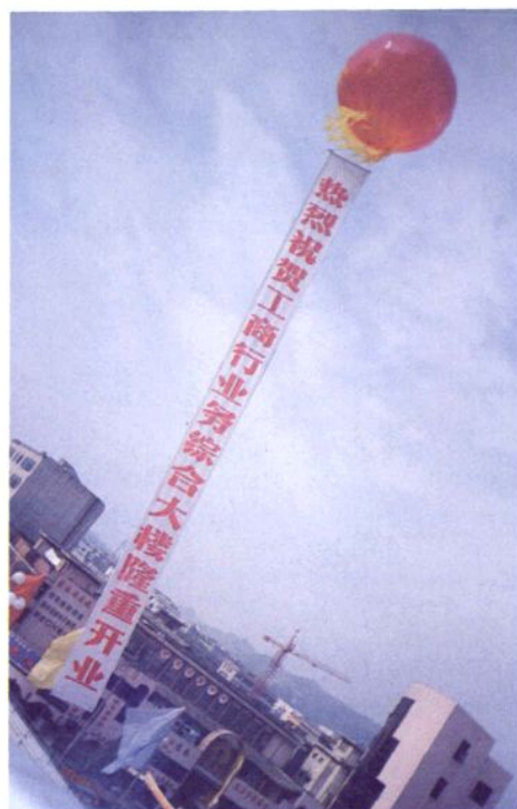
业务综合大楼隆重开业的浮标