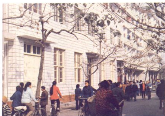
1989年贴外墙瓷砖后的旧营业办公楼