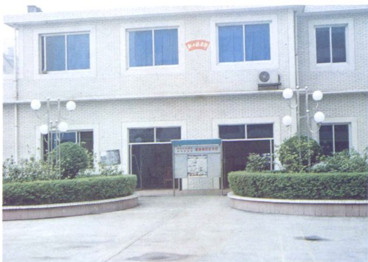
职工食堂及职工俱乐部