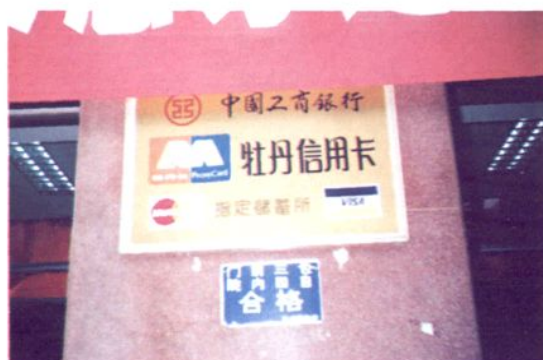
1993年10月起，开办牡丹信用卡业务