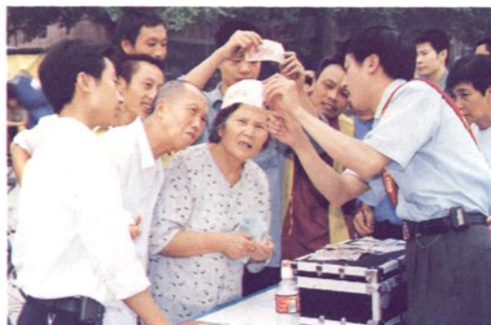
向群众讲解鉴别人民币真假钞票常识