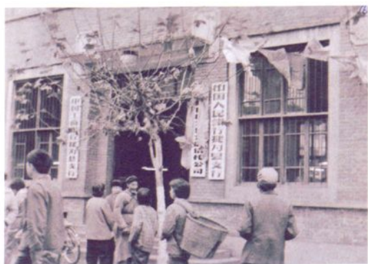
1984年支行成立时的营业办公楼