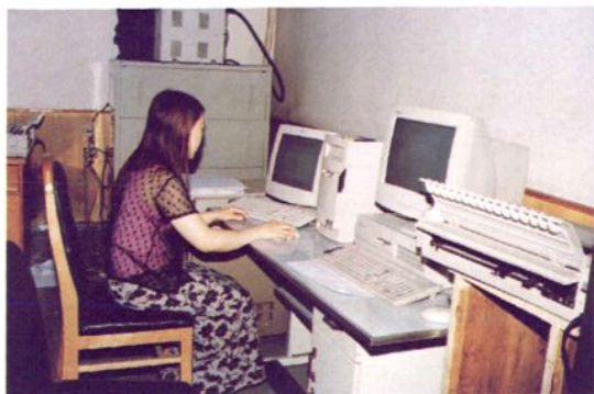
电子计算机联网 处理会计、出纳前台临柜业务