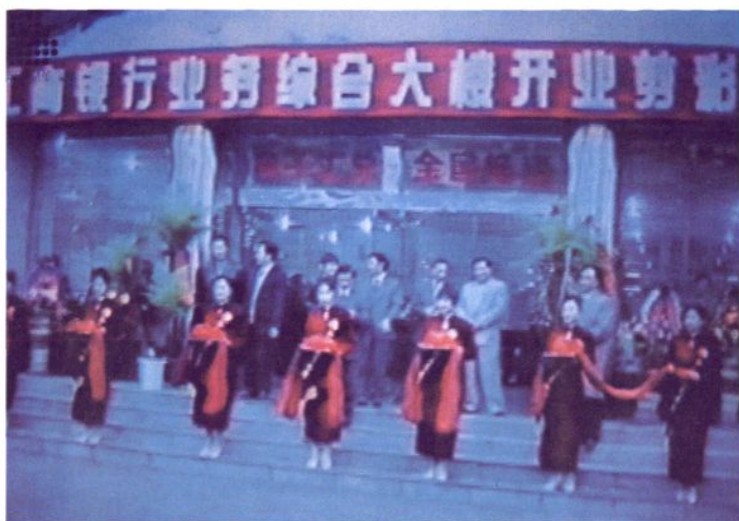
1998年2月24日，支行新建业务综合大楼开业剪彩仪式