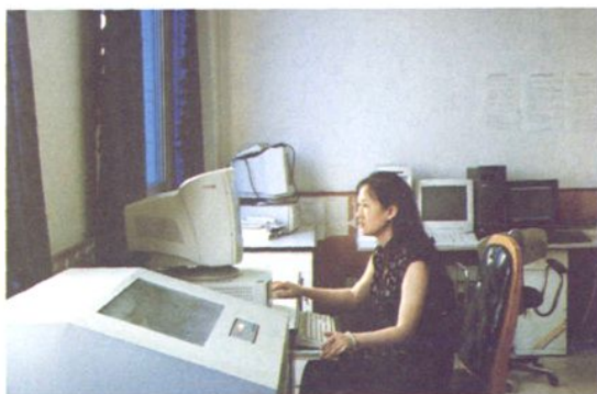
电子计算机联网 处理储蓄所临柜业务