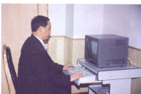
电子计算机管理信贷资金、监控企业贷款运行