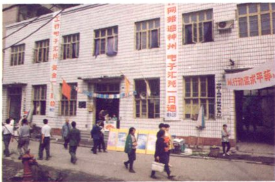
1995年9月,开展电子汇兑结算宣传