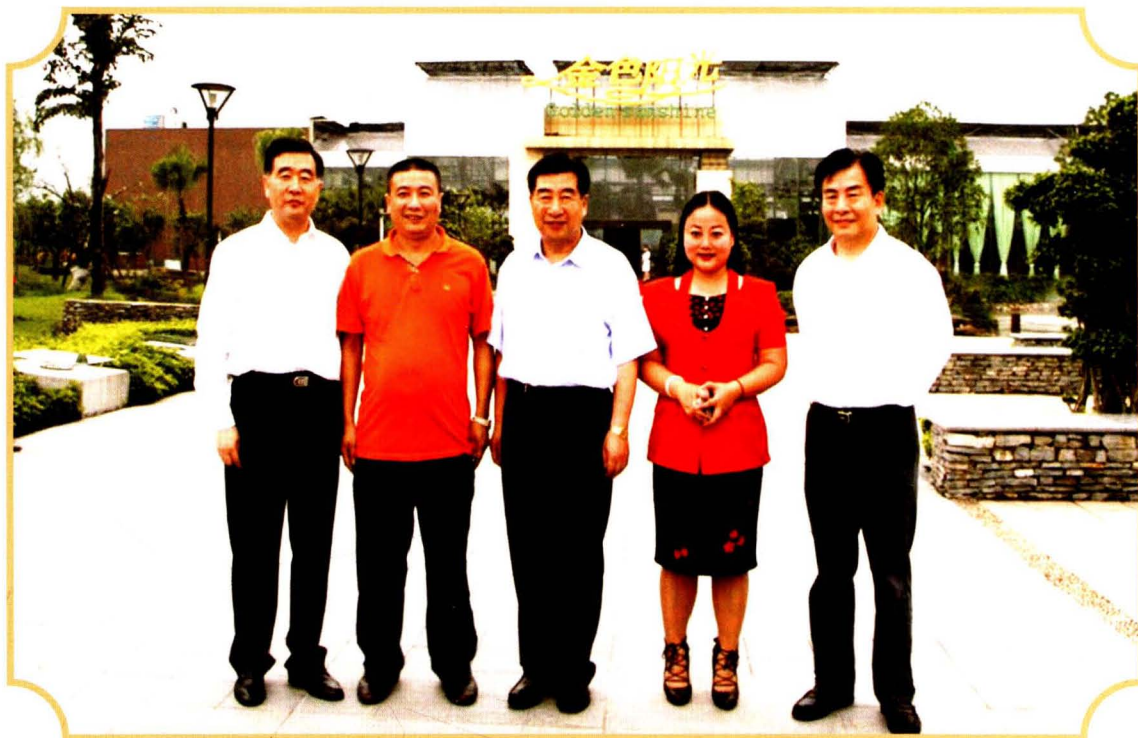
2007年6月18日，国务院副总理回良玉（中）视察陶然居金色阳光。市委书记汪洋（左一），市委副书记、市长王鸿举（右一）等陪同