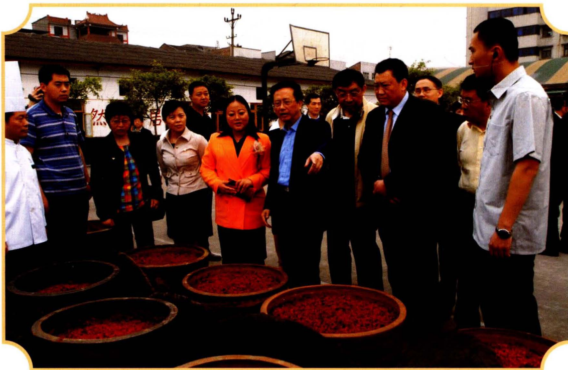
2008年4月22日，全国人大常委会副委员长陈昌智（右五）视察陶然居厨师学校。区人大常委会主任汪丛林（右三）等陪同