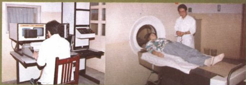
地区人民医院全身CT诊断机