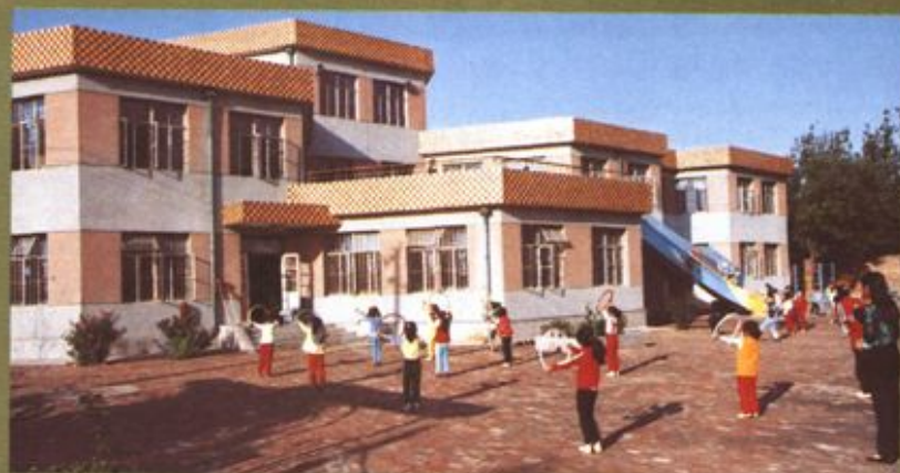
滨洲医学院幼儿园