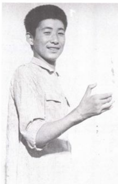
手术后3个月, 复活的腕关节及手指活动良好