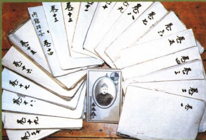
曹广勋《医学简明录》 手稿