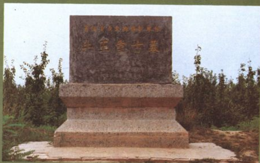
阳信县境内牛王堂 古墓