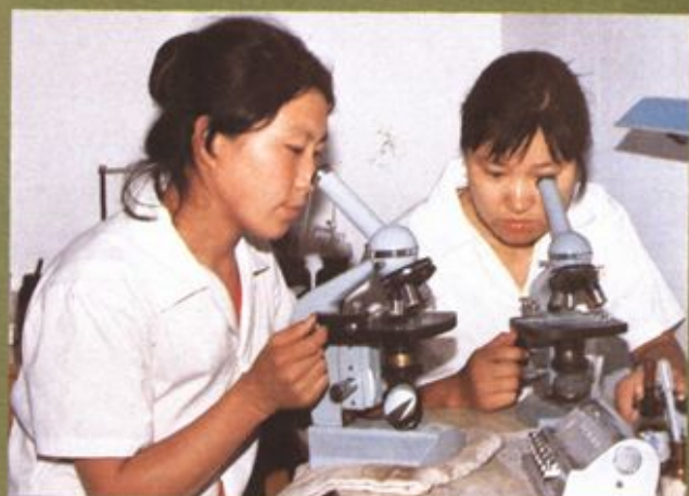
滨州市立医院检验人员在工作