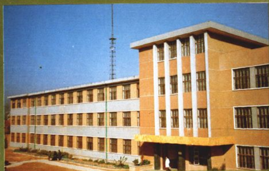
地区精神病医院 病房楼