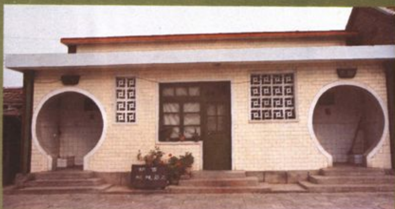
滨州市内水冲式厕所