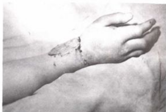
惠民中心医院为其断手再植, 获得成功