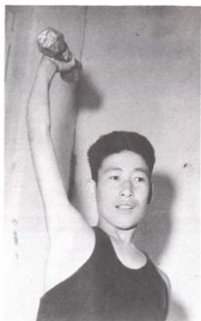
手术后4个月, 复活的手能举起4公斤重的哑铃