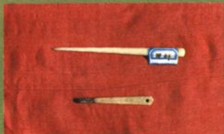
在滨县出土的新石器时期针灸用骨针