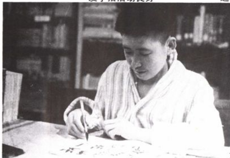
芦天柱用复活的手持笔写字