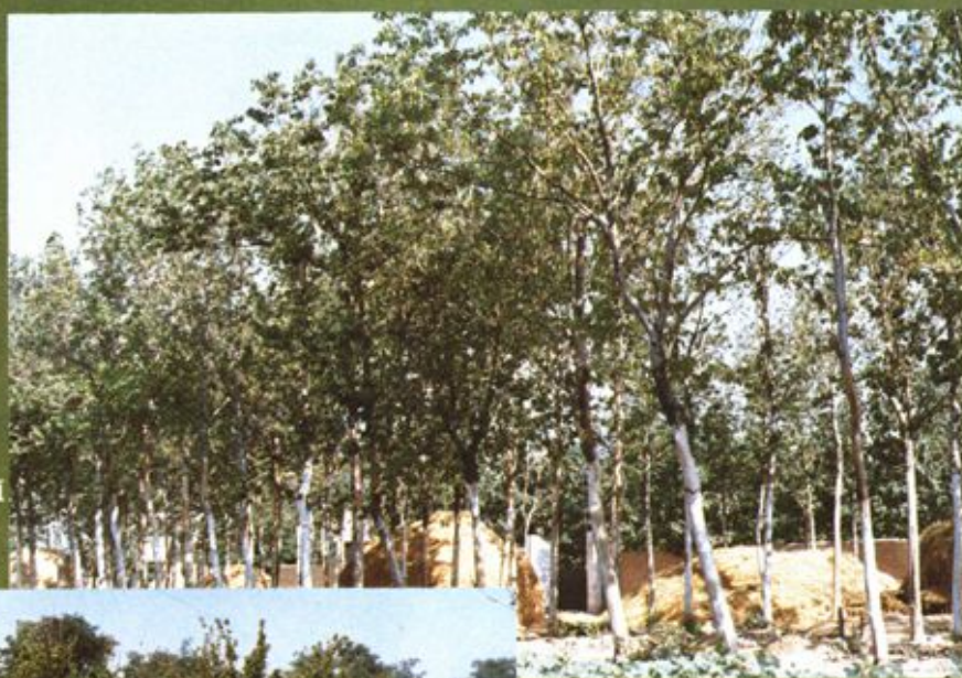
博兴县境内的药用植 物 杜仲(上) 山茱萸(下)