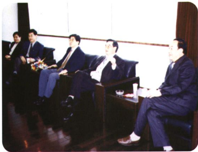
◀ 2003年4月18日，最高人民法院原检察长韩抒滨（中），在安徽省委常委、政法委书记任海深（左2）、省检察院检察长柯汉民（左1）、在省院原检察长宋孝贤（右2）的陪同下，到黄山市院座谈调研；黄山市院原检察长许世柯(右1)也参加了座谈。