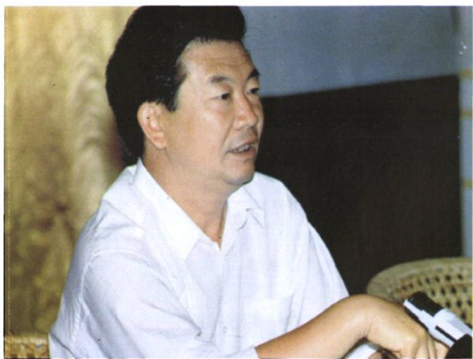
▶1994年5月25日 全国检察机关第三次刑事检察工作会议在最高人民检察院黄山培训中心召开。图为最高人民检察院党组副书记副检察长梁国庆作总结讲话。