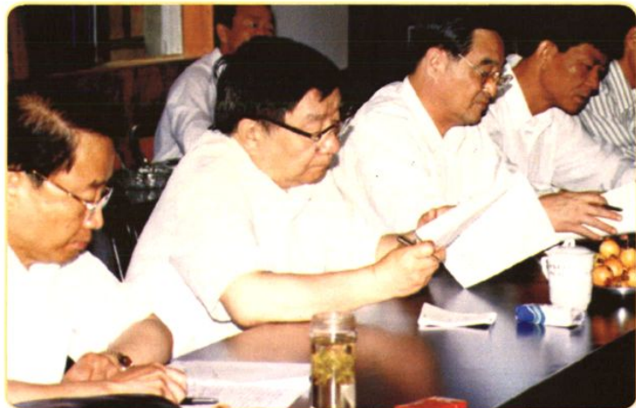
◀ 1997年5月20~23日最高人民检察院副检察长王文元（左2）在省院检察长宋孝贤（左3）、副检察长杨承忠（左1）、柯汉民（左4）的陪同下，到黄山市视察工作。