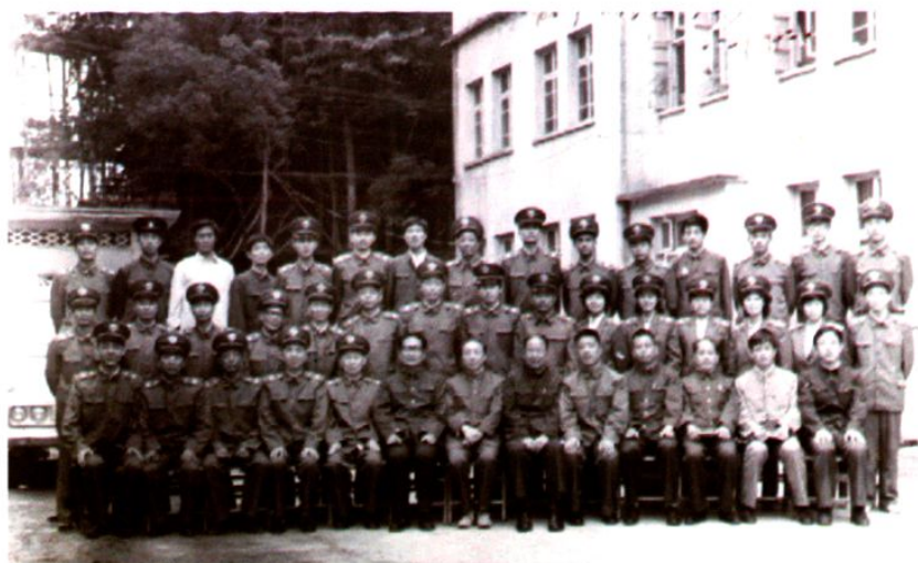
▲1985年5月2日，时任最高人民检察院副检察长张灿明(前排中)率工作组一行5人，在省院检察长冯建华（前排右6）、副检察长刘生（前排右5）的陪同下，视察徽州地区，并同徽州检察分院全体干警合影留念。