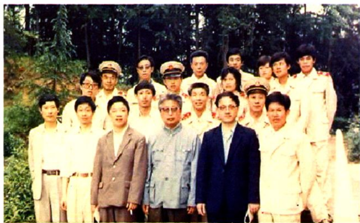
◀1987年5月22日，时任最高人民检察院副检察长张思卿（前排左2）在二厅副厅长张穹、秘书王小江、宋寒松，省院副检察长刘生（前排左1）、办公室主任陈绪德（前排右2）、等领导陪同下，到徽州地区视察工作。图为张思卿副检察长同原黄山市（县级）院干警合影。