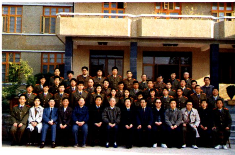
►1991年4月19日，最高人民检察院检察长刘复之（前排左7）、安徽省常委、政法委书记兼公安厅厅长王胜俊（前排右7）、省检察院检察长冯建华（前排左5）、副检察长刘生（前排右4）、中共黄山市委书记季家宏（前排左6）、中共黄山市委副书记刘柳堤（前排左4）、市长吴存心（前排右6）等领导同黄山人民检察院全体干警合影留念。