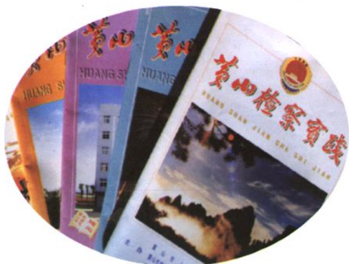
▲时任最高人民检察院检察长刘复之1991年4月到黄山视察时为黄山市人民检察院的内部刊物《黄山检察实践》书写刊名。