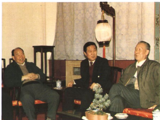
▲1991年4月19日，安徽省人民检察院检察长冯建华（左）、黄山市委书记季家宏（中）与高检院刘复之检察长（右1），在黄山市委办公厅亲切交谈。