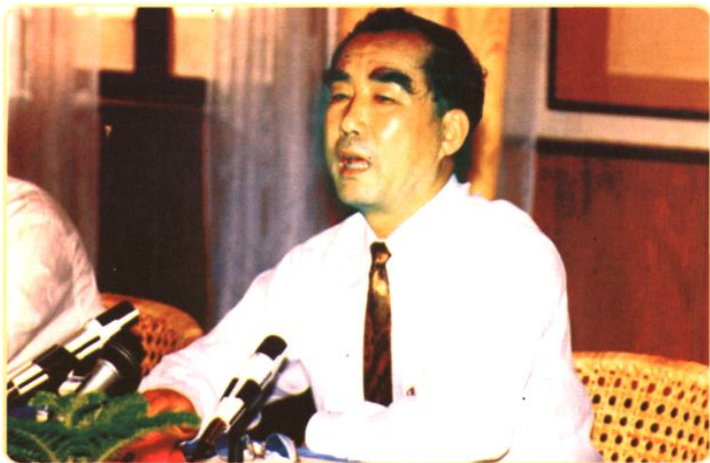
►1994年10月，最高人民检察院副检察长赵登举在最高人民检察院黄山培训中心召开的全国检察机关第四次反贪污贿赂侦查工作会议上作报告。