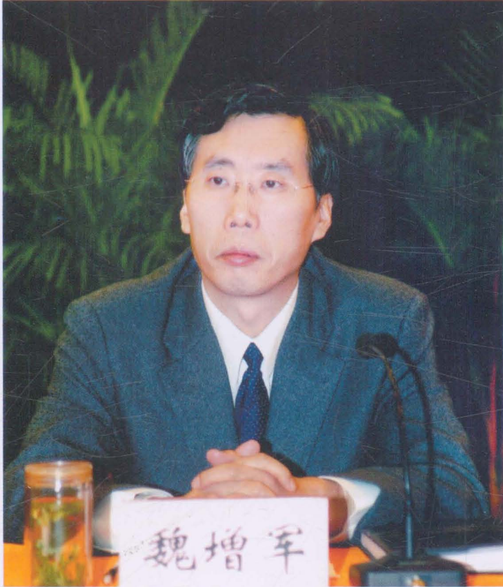
2008年4月,时任商洛市市长魏增军出席全市审计工作会议