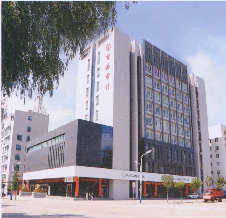
位于通江西路的办公大楼