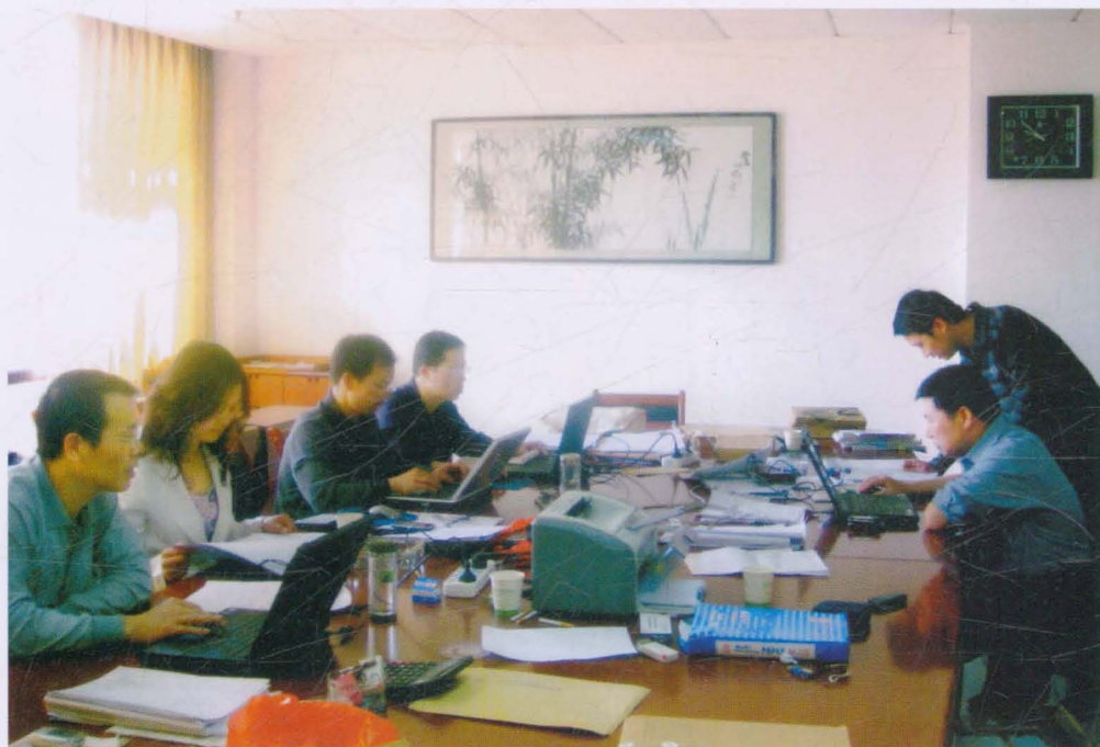
2010年3月7日,商洛市审计局财政金融审计科审计人员在市财政局进行政府债务审计