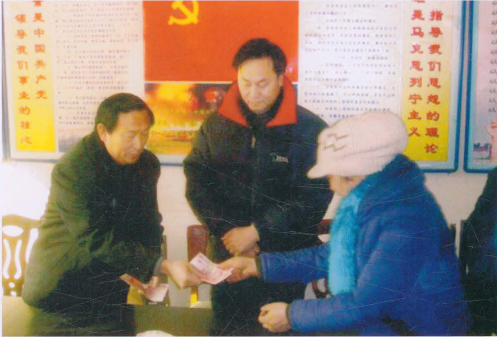
2010年1月,商洛市审计局在镇安县黄家湾乡一星村慰问困难户