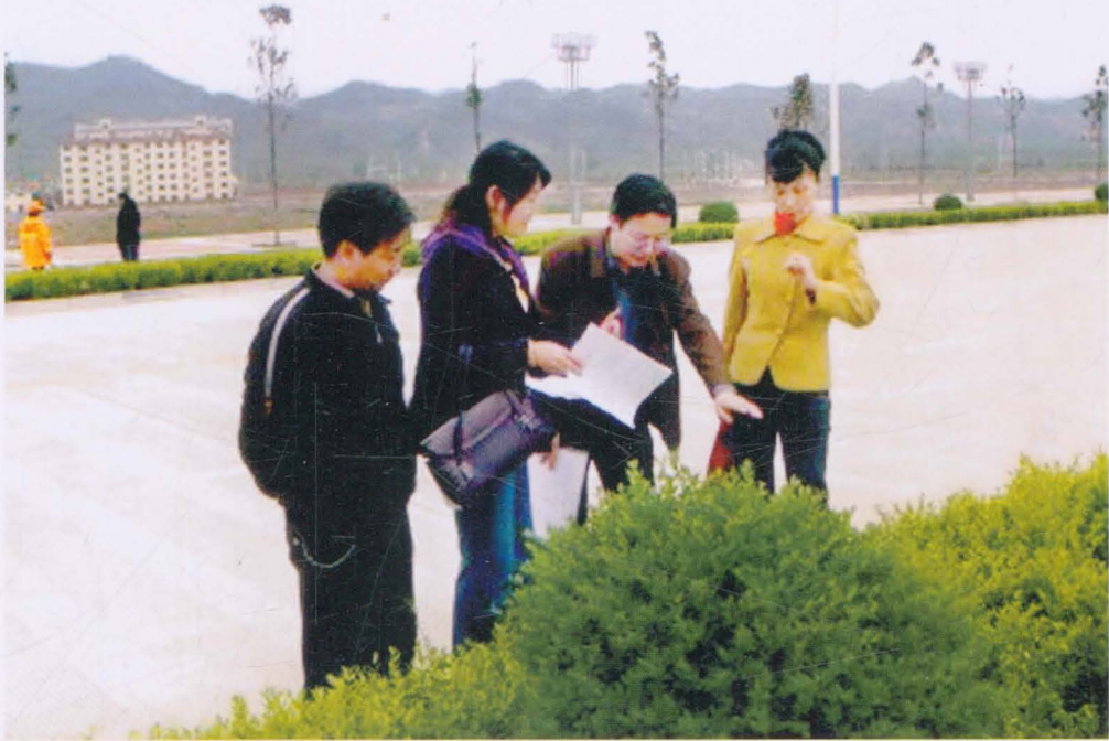
2008年,商洛市西片路网建设工程审计。图为市审计局固定资产投资科的审计人员现场测量绿化工程量