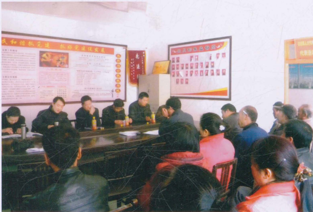
2008年3月,商洛市审计局领导在洛南县古城镇李庙村宣讲政策