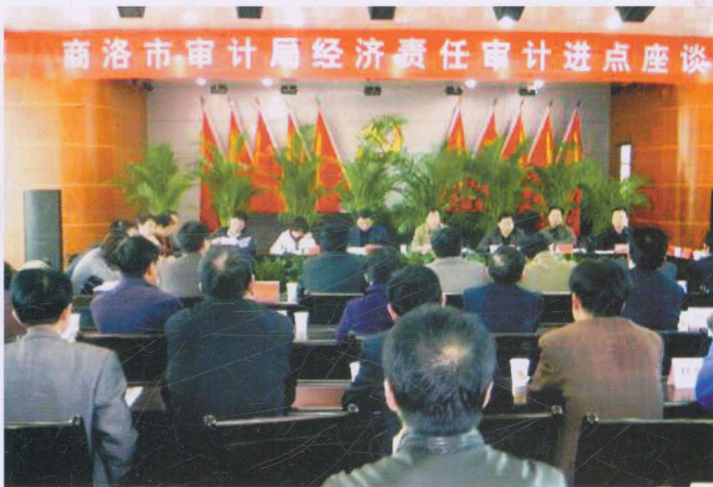
2010年11月,商州区区委书记、区长经济责任审计进点座谈会