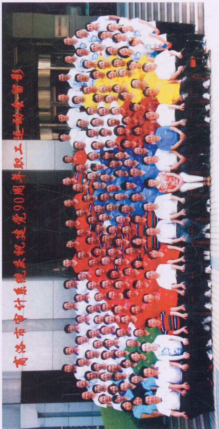
商洛市审计系统职工运动会合影