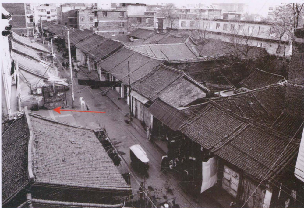
箭头所指为商洛市审计局旧城区老办公楼所处位置