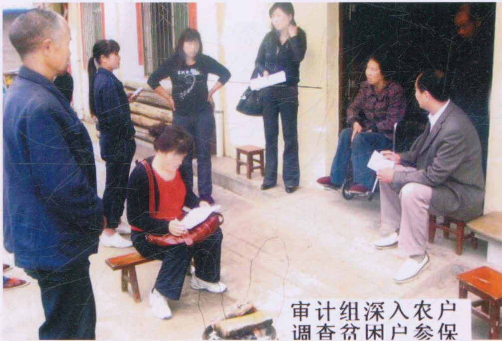
审计组深入农户 调查贫困户参保