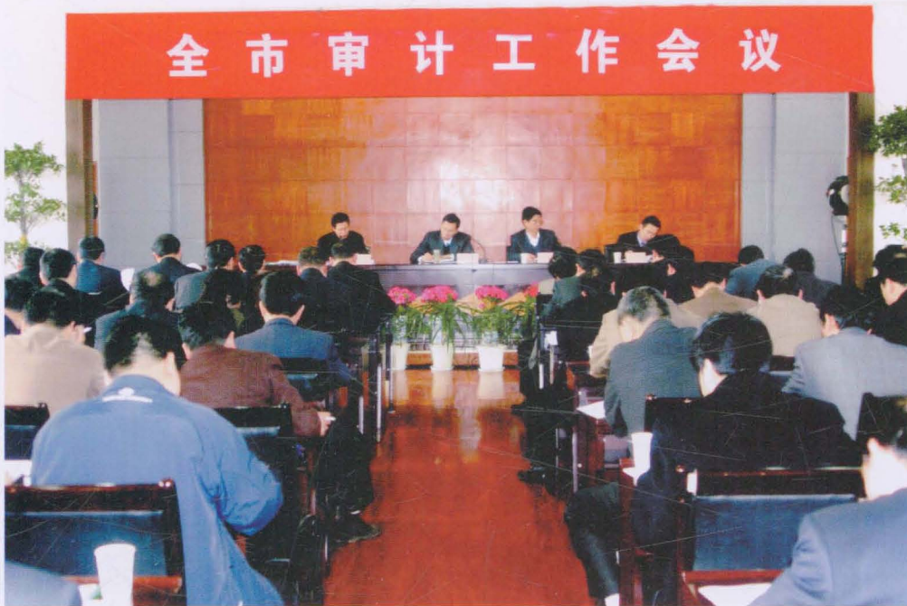
2005年3月,全市审计工作会议会场