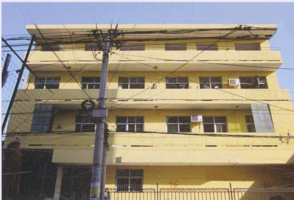
位于原西街老办公楼