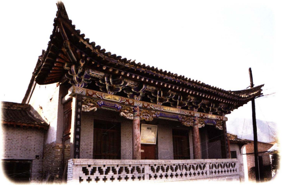
北耽车奶奶庙戏楼