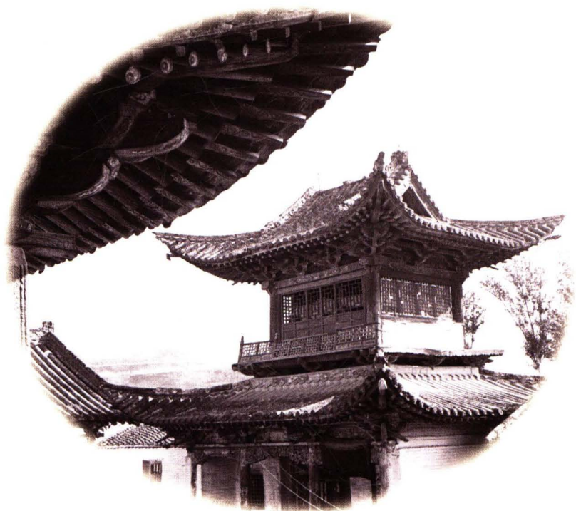
九天圣母庙梳妆楼