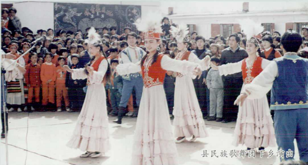
县民族歌舞团下乡演出