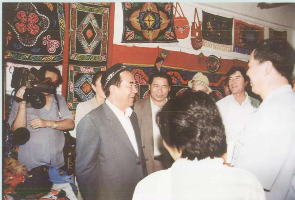
全国人大副委员长铁木尔·达瓦买提视察木垒县民族刺绣厂。