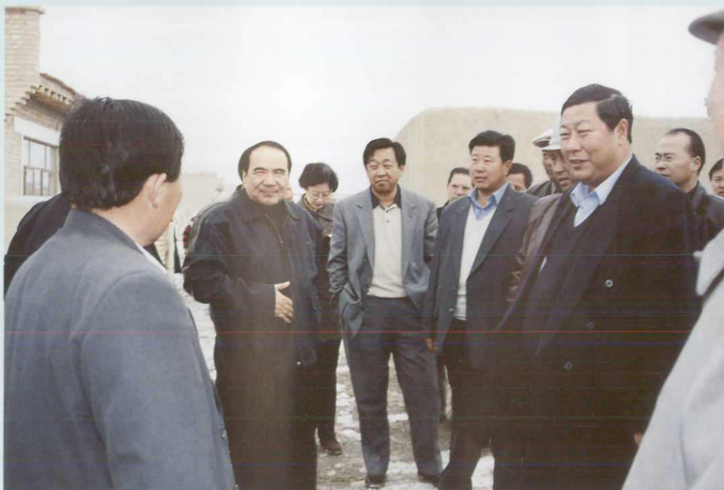
自治区人民政府主席阿不来提·阿不都热西提视察木垒县大石头乡牧民定居点。