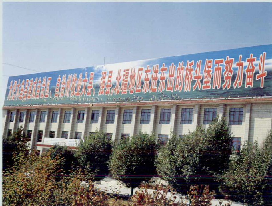
县委、政府办公大楼