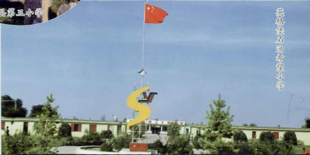
英格堡石油希望小学