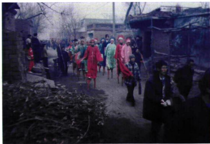
八里营娱乐会高跷