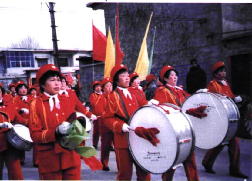
八里营东方娱乐团队