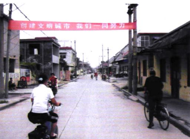
↑ 八里营老村中心大街