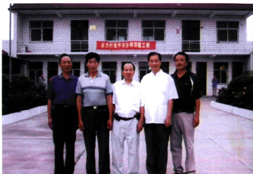
村志编纂委员会成员合影