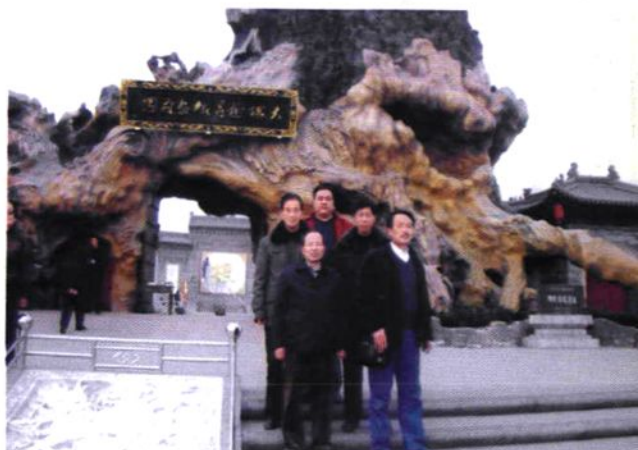
村志编委赴山西洪洞县考查