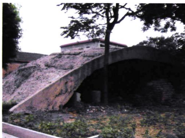
↗ 飞机屋（日军侵华罪证）