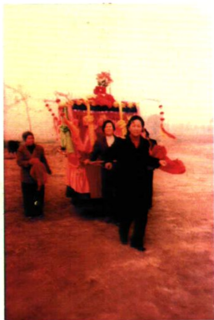
八里营娱乐会抬花轿表演