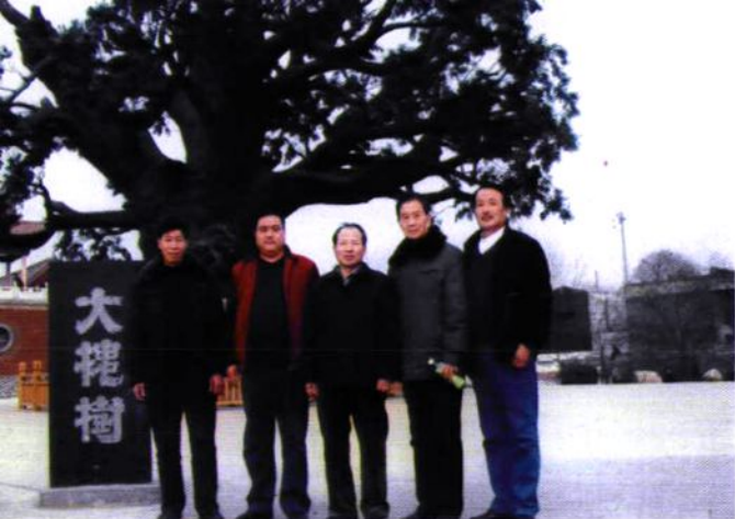
村志编委于山西洪洞县大槐树处合影