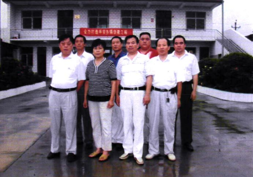
八里营村两委会成员合影