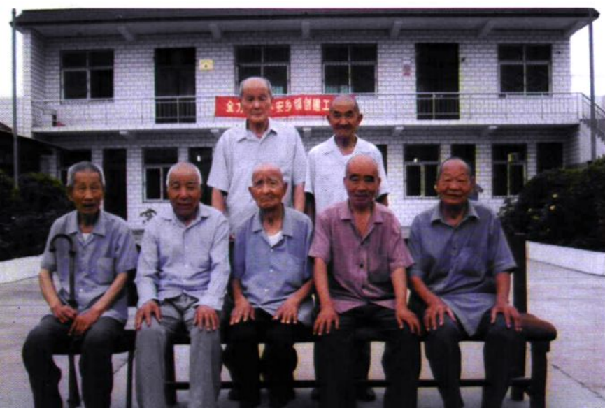
村志编纂顾问小组成员合影