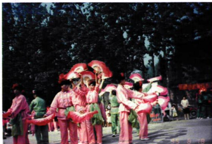
八里营扇子舞队在表演