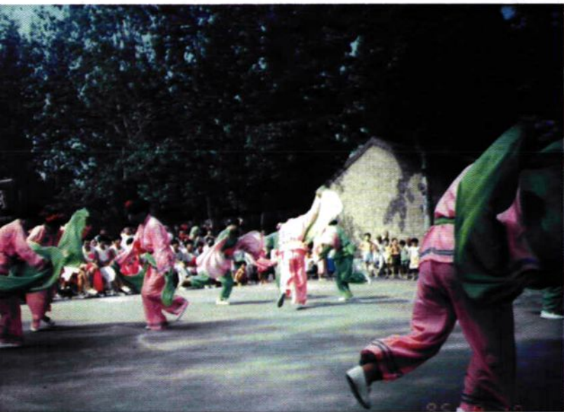
八里营秧歌队在表演