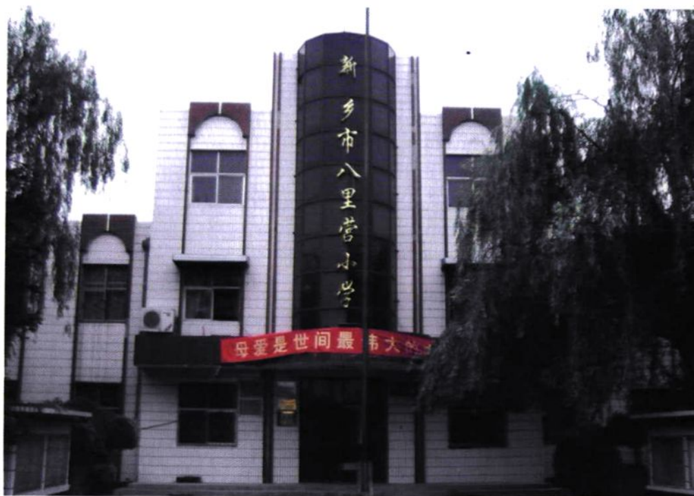
新乡市八里营小学