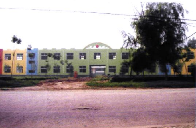
平原乡中心幼儿园