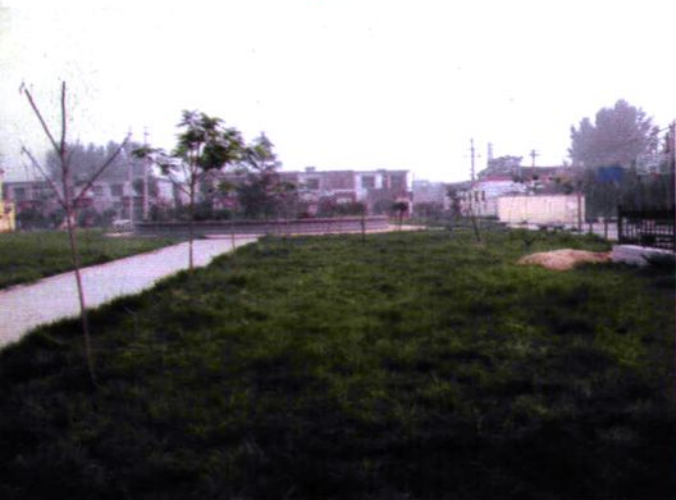
八里营新村休闲广场